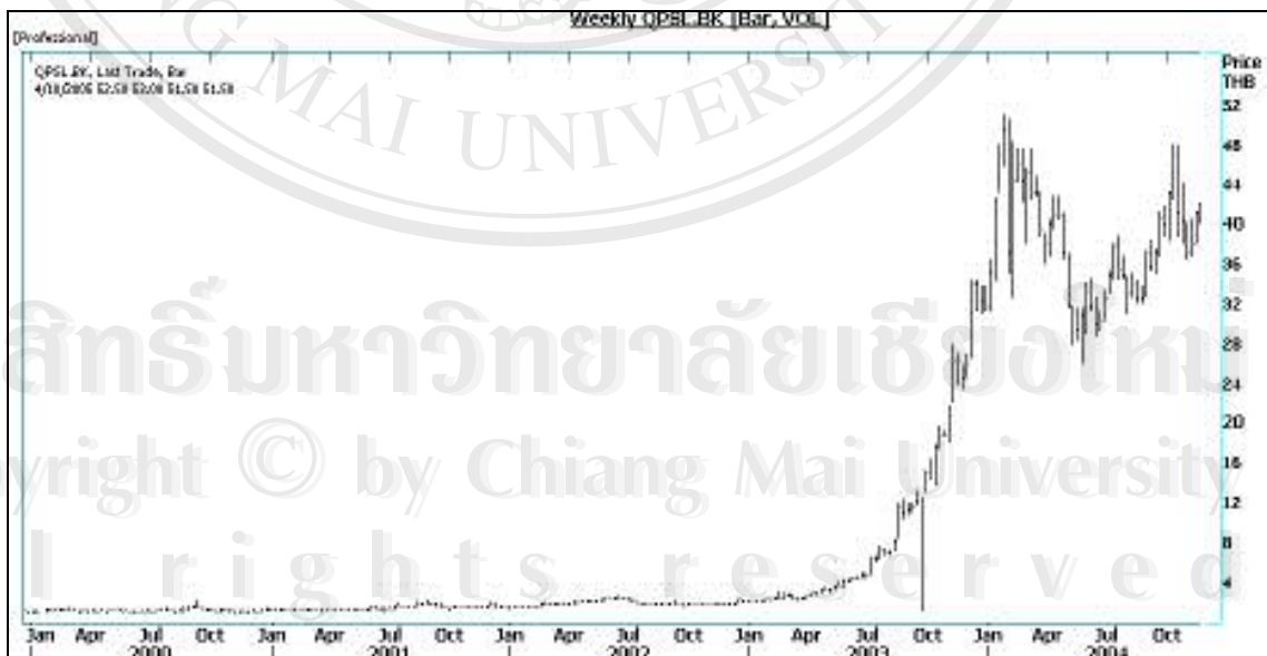
รูป 3.4 ราคาปีตราขายสัปดาห์ของหลักทรัพย์ PSL

พีเอสแอลบริหารงานกองเรือแบบไม่ประจำเส้นทาง ซึ่งมีเส้นทางเดินเรือครอบคลุมไปทั่วโลก สินค้าพื้นฐานที่กองเรือพีเอสแอล ขนส่งคือสินค้าทางการเกษตร, เหล็ก, ปูน, สินแร่และเนื้อแร่, ไม้ซุง และอื่นๆ พีเอสแอลได้ประมาณเครือข่ายการขนส่งสินค้าของกองเรือของบริษัทฯ อย่างคร่าวๆ เป็น 5 ภูมิภาคประกอบด้วย สหรัฐอเมริกา / แคนาดา, ยุโรป, ละตินอเมริกา-แอฟริกา, อินเดีย อนุทวีป-ตะวันออกกลาง และเอเชียตะวันออกเฉียงใต้และตะวันออกไกล กองเรือพีเอสแอลสามารถให้บริการในท่าเรือที่มีขีดจำกัดในเรื่องร่อนน้ำ เนื่องจากขนาดเรือของพีเอสแอลสามารถเข้าเทียบท่าในร่อนน้ำตื้นได้ ขณะที่เรือขนาดใหญ่ไม่สามารถเข้าเทียบท่าได้ ลักษณะดังกล่าวถือเป็นข้อได้เปรียบและส่งผลให้พีเอสแอลได้อัตรากำไรสูงกว่าผู้ประกอบการเดินเรือขนาดใหญ่