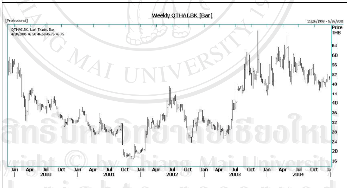
รูป 3.2 ราคาปีครายสัปดาห์ของหลักทรัพย์ THAI

ธุรกิจการขนส่งทางอากาศมีลักษณะแตกต่างจากการขนส่งทางบกและทางน้ำ เนื่องจากธุรกิจการขนส่งทางอากาศนั้น สายการบินที่รับขนส่งต้องให้บริการผู้โดยสารเริ่มตั้งแต่ภายในอาคารท่าอากาศยาน ณ จุดต้นทาง จากนั้นจะมีบริการ ณ ลานจอด การให้บริการบนเครื่องบินตลอดเส้นทางบิน จนถึง ณ จุดปลายทาง การขนส่งสินค้าทางอากาศก็มีลักษณะเช่นเดียวกัน กล่าวคือสายการบินที่รับขนส่งสินค้า จะต้องให้บริการดูแลรักษาสินค้าในคลังสินค้าทั้งสินค้าที่จะส่งออกไปหรือรับเข้ามา(cargo services) รวมทั้งให้บริการรับส่งระหว่างคลังสินค้ากับเครื่องบิน(cargo handling)