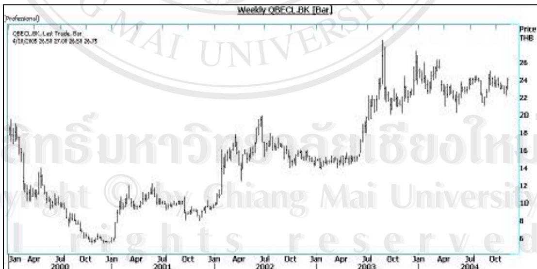
รูป 3.5 ราคาปิดรายสัปดาห์ของหลักทรัพย์ BECL

นอกจากนี้ บริษัทยังมุ่งมั่นที่จะปรับปรุงคุณภาพของบุคลากรและคุณภาพงานอย่างต่อเนื่องจากการที่ได้นำระบบบริหารงานคุณภาพได้แก่ ระบบบริหารงานคุณภาพ (ISO) กิจกรรม 5ส กิจกรรมปรับปรุงการปฏิบัติงาน กิจกรรมข้อเสนอแนะ มาประยุกต์ใช้กับระบบการทำงานของ บริษัท ซึ่งจากวันที่ 22 สิงหาคม พ.ศ.2544 ที่บริษัทได้รับการรับรองระบบบริหารงานคุณภาพ ISO 9001: 2000 จากบริษัท เอส จี เอส (ประเทศไทย) จำกัด ตามมาตรฐานของ UKAS แห่งประเทศอังกฤษและNACแห่งประเทศไทยบริษัทยังคงได้รับการต่ออายุการรับรองจนถึงปีพ.ศ.2550