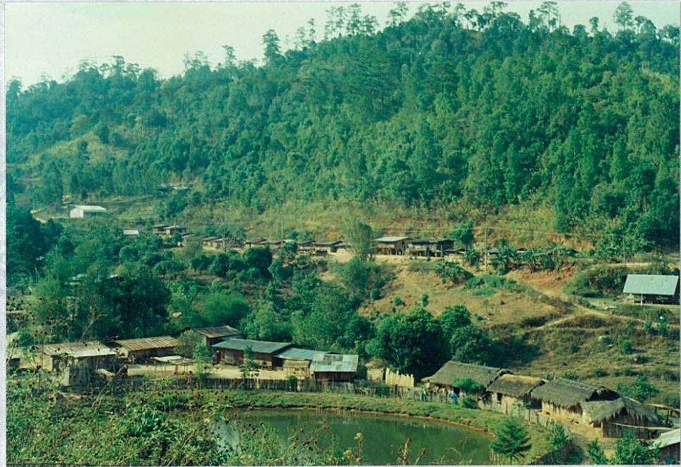
แผนภาพ 5 ภาพหมู่บ้านห้วยน้ำดัง ตำบลกัณฑ์ช้าง อำเภอแม่แตง จังหวัดเชียงใหม่