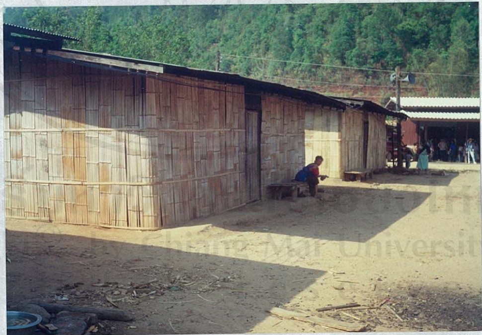
แผนภาพ 6 ภาพลักษณะของบ้านชาวห้วยน้ำดัง