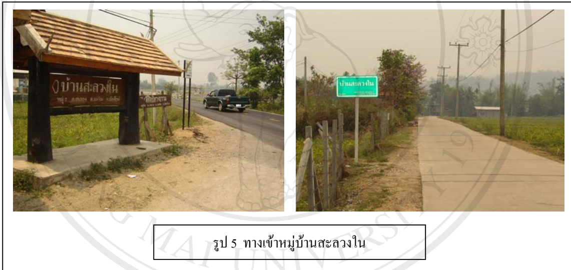
รูป 5 ทางเข้าหมู่บ้านสะลงโน

หมู่บ้านสะลงโน ตั้งอยู่ที่หมู่ 2 ตำบลสะลงโน อำเภอแม่อริม จังหวัดเชียงใหม่ บ้านสะลงโน เป็นหมู่บ้านชนบทมีลักษณะพื้นที่เป็นที่ราบ แวดล้อมไปด้วยภูเขา มีพื้นที่ส่วนใหญ่ใช้ไปในการเกษตรกรรมและมีลักษณะภูมิอากาศ คล้ายคลึงกับบ้านนาหูก