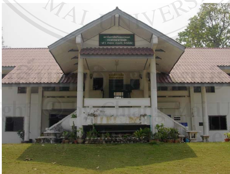
รูป 1 สถานีอนามัยสะลวง

ตำบลสะลวงมีประชากรทั้งหมด 4,467 คน จำนวนหลังคาเรือน 1,187 หลัง ประกอบด้วย 8 หมู่บ้าน ได้แก่ หมู่ที่ 1 บ้านนาหิ่ก หมู่ที่ 2 บ้านสะลวงใน หมู่ที่ 3 บ้านสะลวงนอก หมู่ที่ 4 บ้านกาดฮาว หมู่ที่ 5 บ้านเมืองกะ หมู่ที่ 6 บ้านพระบาทสี่รอย หมู่ที่ 7 บ้านห้วยส้มสุก และ หมู่ที่ 8 บ้านแม่กะเปียง ประชากรส่วนใหญ่ประกอบอาชีพรับจ้าง รองลงมาได้แก่ เกษตรกรรม มีสถานบริการสาธารณสุข 1 แห่ง คือ ศูนย์สุขภาพชุมชนสะลวง หรือสถานีอนามัยสะลวง (รายงานประจำปี สถานีอนามัยสะลวง, 2547, หน้า 1-3)