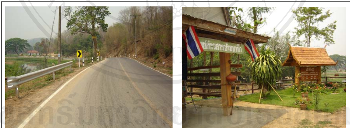
รูป 3 ทางเข้าหมู่บ้านนาหูก

ลักษณะภูมิอากาศของหมู่บ้าน ฤดูร้อนเริ่มตั้งแต่ปลายเดือนกุมภาพันธ์จนถึงกลางเดือนพฤษภาคม ฤดูฝนเริ่มตั้งแต่เดือนพฤษภาคมจนถึงเดือนตุลาคม ฤดูหนาวเริ่มตั้งแต่เดือนพฤศจิกายนถึงเดือนกุมภาพันธ์ แต่ปัจจุบันสภาพป่าบริเวณรอบ ๆ หมู่บ้าน ถูกทำลายไปมาก ทำให้ในฤดูร้อนอากาศจะร้อนอบอ้าวมาก