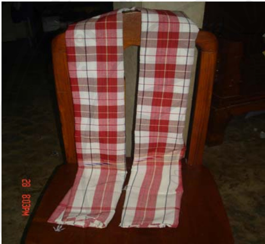
ภาพที่ 6 ผ้าผืนยาวสำหรับพันรอบเอว