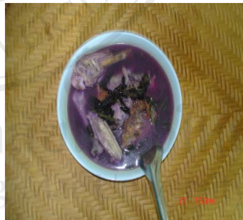
ภาพที่ 4 ไก่ต้มสมุนไพรมะเขือขี้หมู