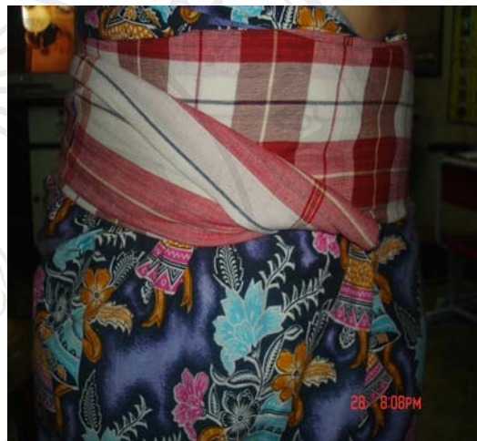
ภาพที่ 7 การพันผ้ารอบเอว