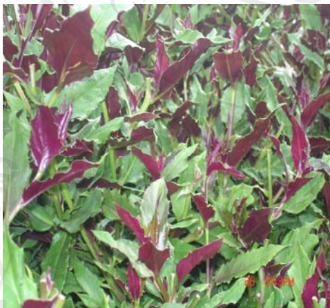
ภาพที่ 3 ยาสุมุนไพรมะเขือขี้หมู