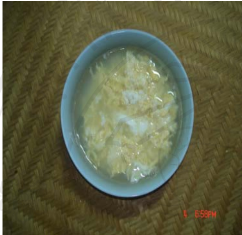
ภาพที่ 1 ใส่น้ำ