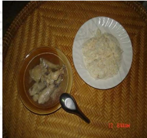
ภาพที่ 2 ไก่ต้มและข้าวสวย