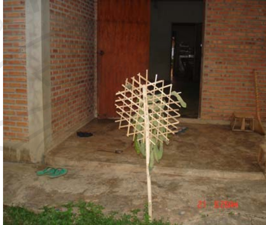
ภาพที่ 5 ตะเหลวปักไว้หน้าบ้าน