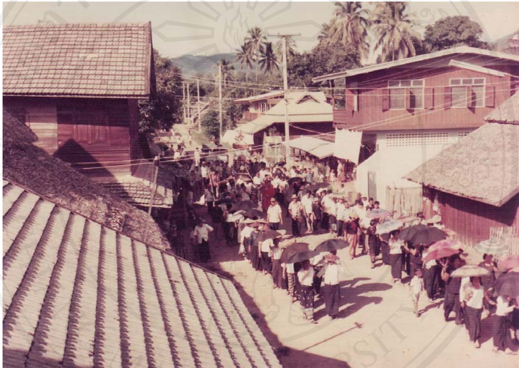
ภาพที่ 1 ชุมชนเขตถนนคนเดินปายในอดีต

ลิขสิทธิ์มหาวิทยาลัยเชียงใหม่ Copyright© by Chiang Mai University All rights reserved