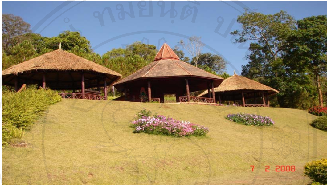
พลับพลาที่ประทับในโครงสถานีสวัสดิ์