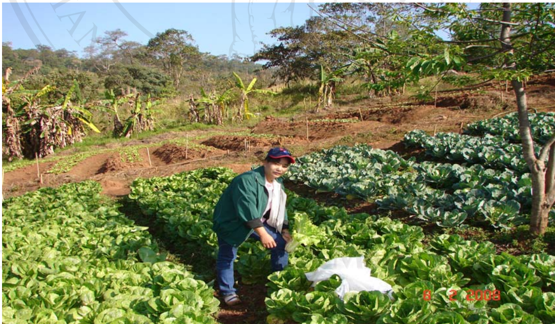
แปลงผักในพื้นที่โครงการสถานีสาธิตฯ