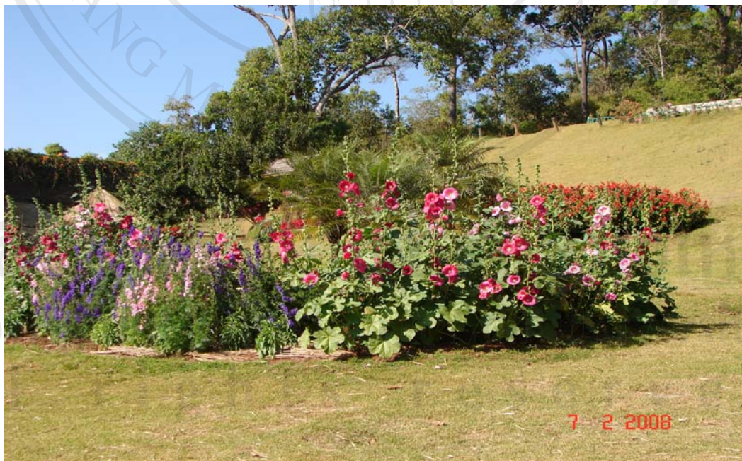
พื้นที่บริเวณหน้าพลับพลาที่ประทับ