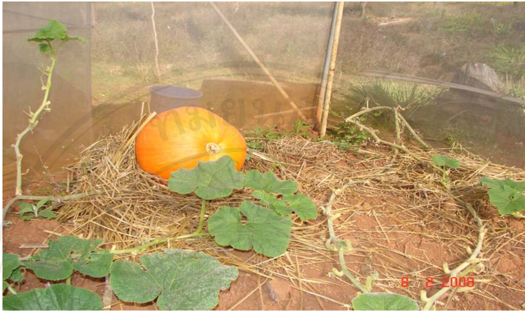
ผลผลิตจากการดำเนินงานด้านการเกษตรของโครงการสถานีสาธิตฯ