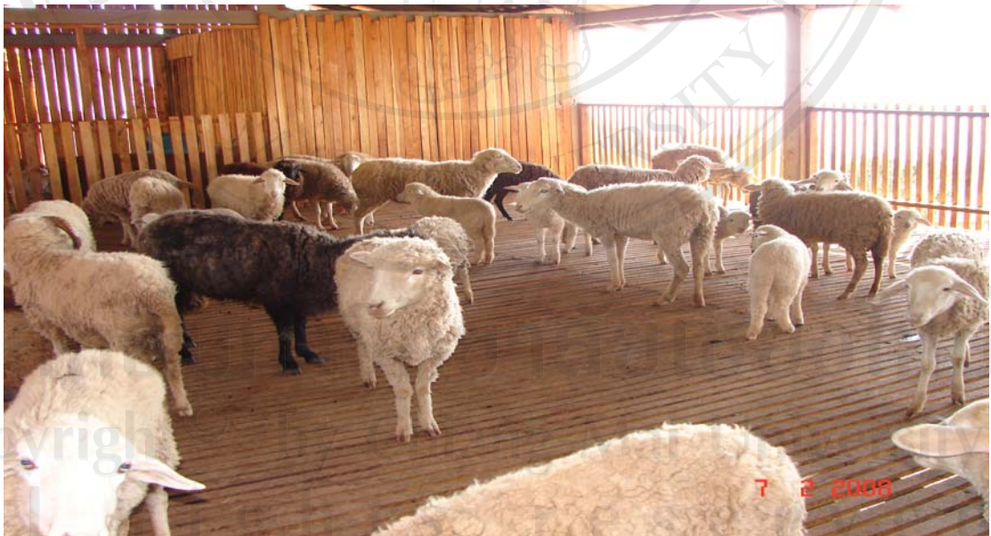
โครงการปศุสัตว์ เลี้ยงแกะในโครงการสถานีสาธิตฯ