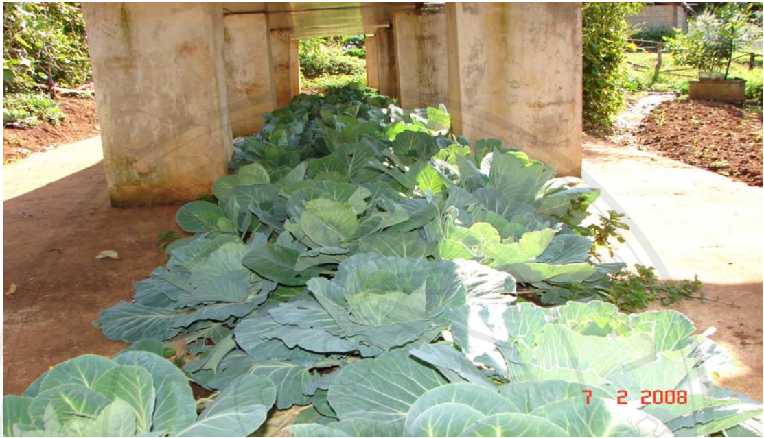
แปลงปลูกกะหล่ำปลีในพื้นที่โครงการสถานีสาธิตฯ