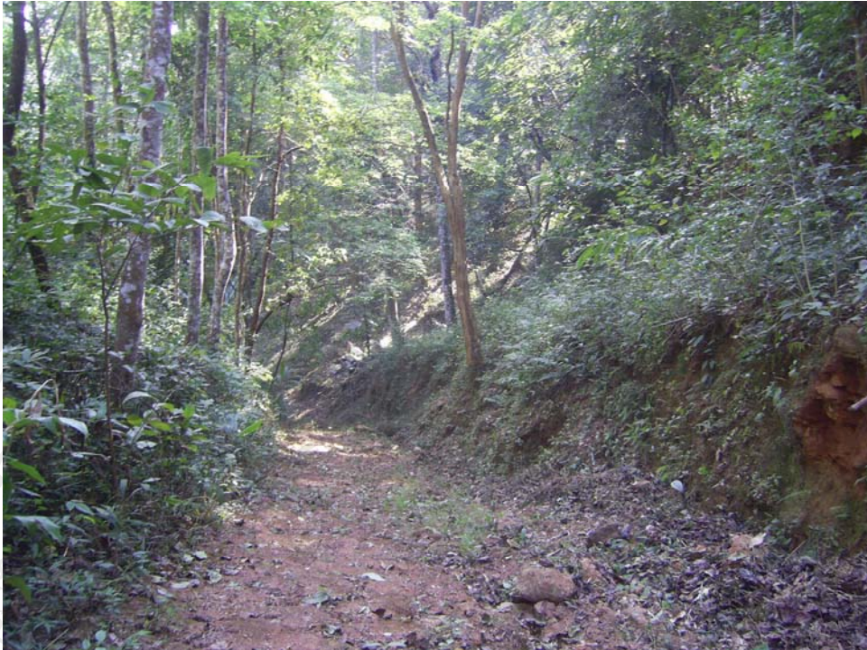
แนวกันไฟของหมู่บ้าน