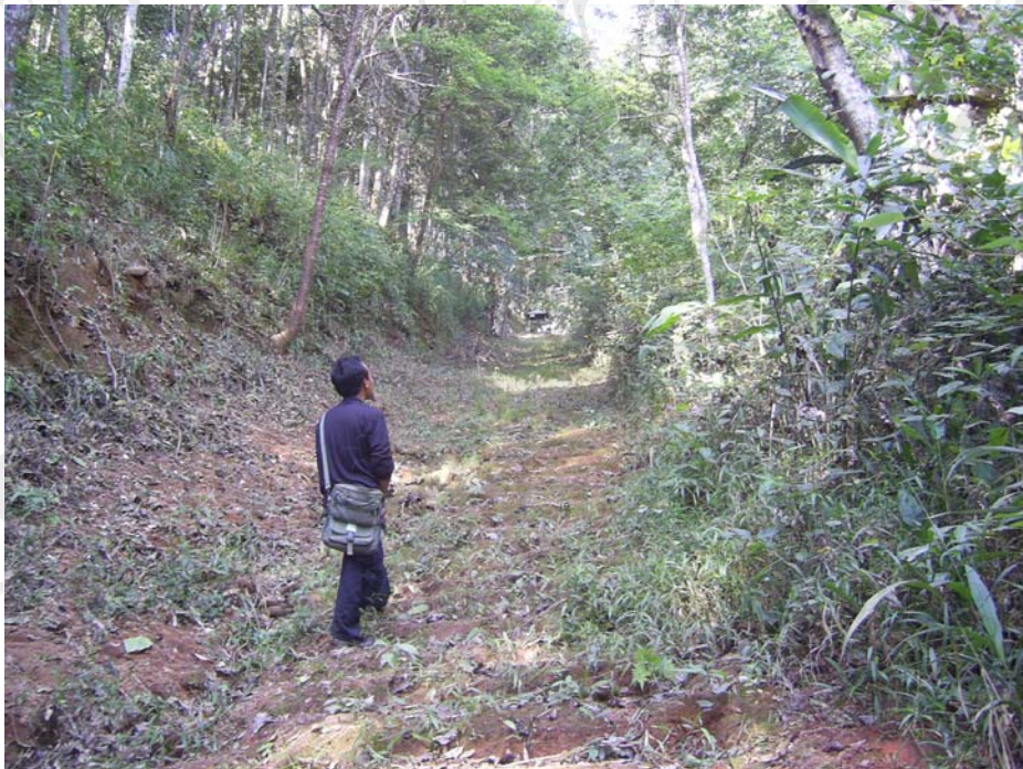
แนวกันไฟของหมู่บ้าน