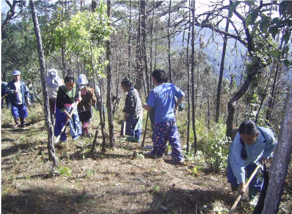
ชาวบ้านร่วมกันทำแนวกันไฟ