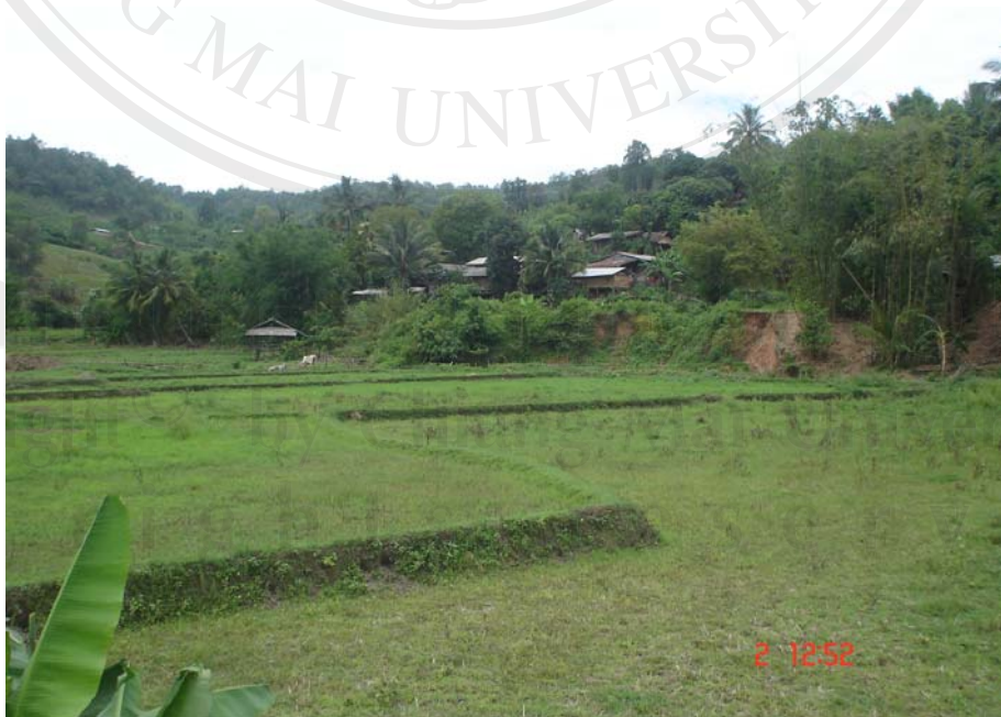
การตั้งบ้านเรือนของหมู่บ้าน