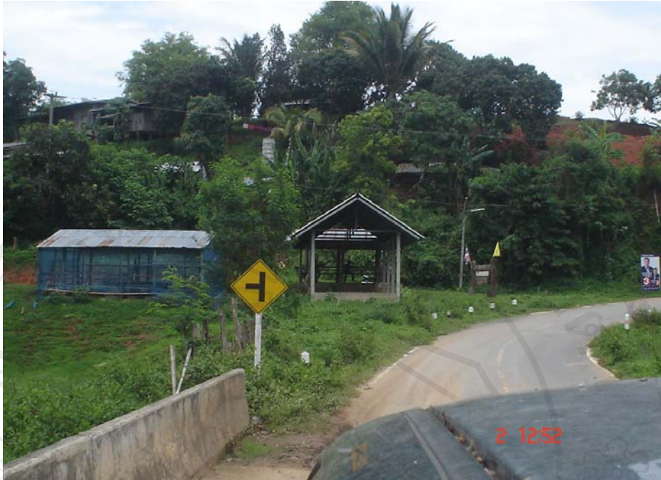
เส้นทางเข้าหมู่บ้าน