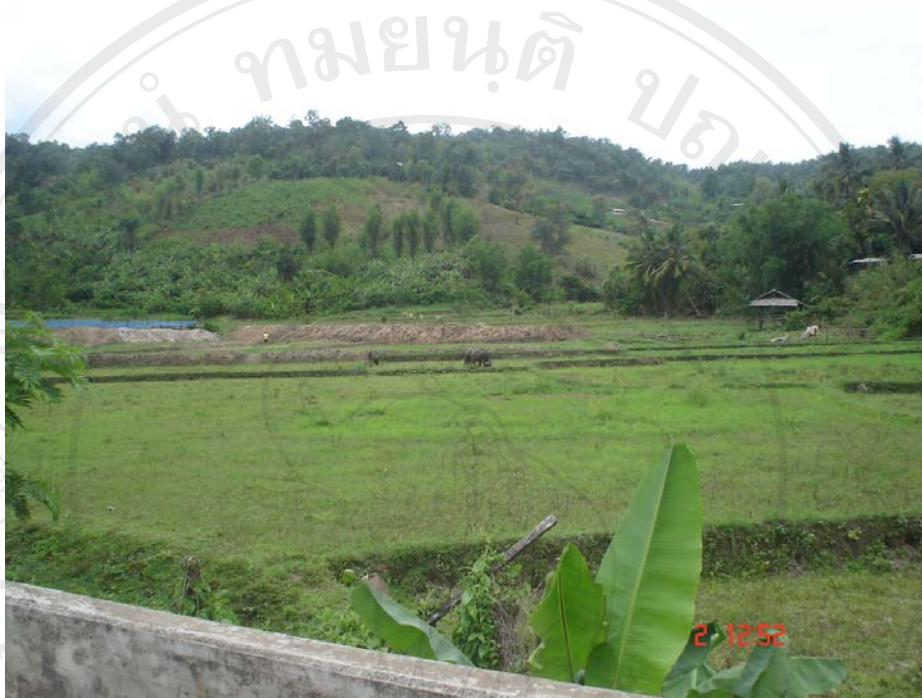
สภาพป่าของชุมชน