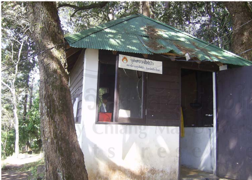
จุดตรวจไฟฟ้าประจำหมู่บ้าน