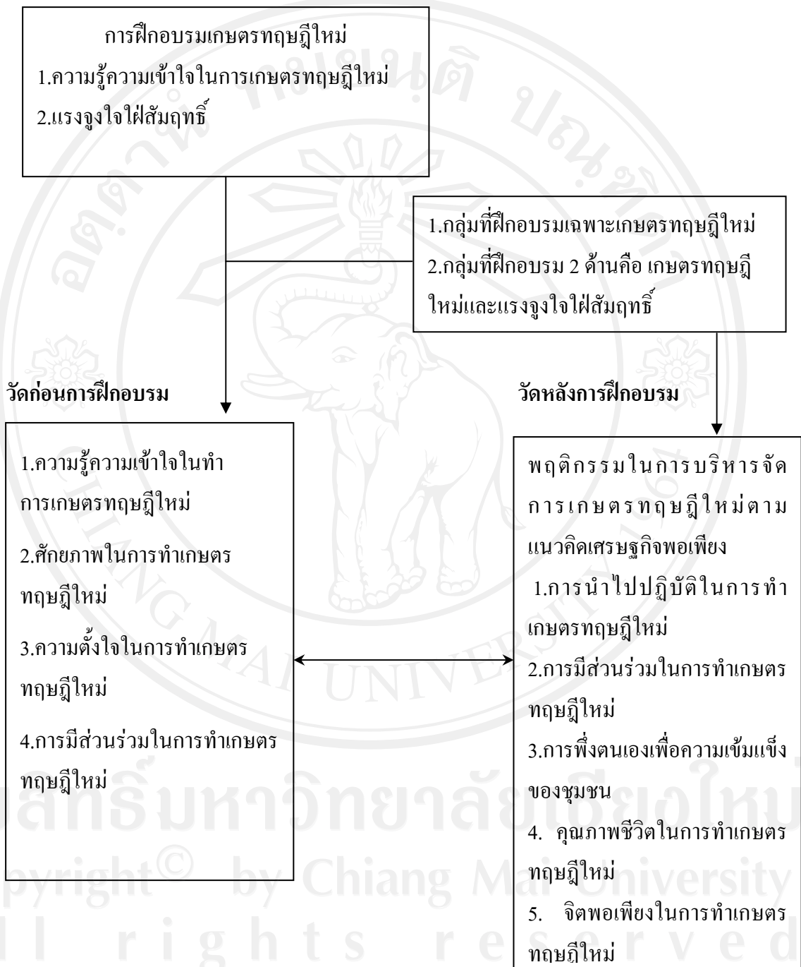
แผนภูมิ 2 แนวคิดความสัมพันธ์ระหว่างตัวแปรในการวิจัย

ส่วนที่สองเป็นกรอบแนวคิดความสัมพันธ์ระหว่างตัวแปรในการวิจัยเชิงปริมาณ