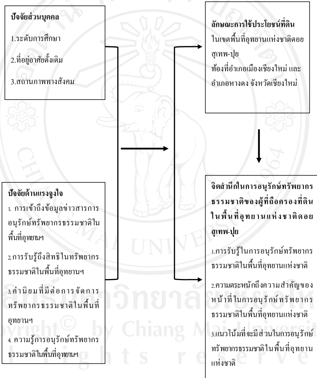
ภาพ 1 กรอบแนวคิดในการศึกษา

จากการทบทวนแนวคิดและงานวิจัยที่เกี่ยวข้อง ทำให้ผู้วิจัยนำมาพัฒนาเป็นกรอบแนวคิดในการศึกษา เรื่อง จิตสำนึกในการอนุรักษ์ทรัพยากรธรรมชาติของผู้ถือครองที่ดินในพื้นที่อุทยานแห่งชาติดอยสุเทพ-ปุย ดังแสดงในภาพ 1 ดังนี้