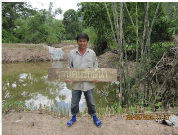
ภาพ 5 ฐานคนรักน้ำ

1. กิจกรรมการสร้างฐานการเรียนรู้ 9 ฐาน (ครอบคลุม 3 แผนกของศูนย์ฯ ประกอบด้วย แผนกที่ 1 การอนุรักษ์ทรัพยากรธรรมชาติและป่าต้นน้ำ แผนกที่ 2 ป่าจัยสี่เกษตรอินทรีย์และสารชีวภาพ แผนกที่ 3 พลังงานทดแทนและอนุรักษ์พลังงาน)