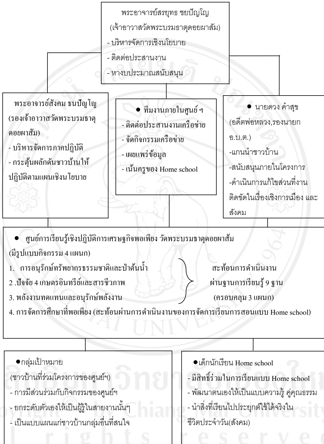
ภาพ 4 กระบวนการทำงาน การมีส่วนร่วมของทุกภาคส่วน วิธีการจัดการ โครงการ/กิจกรรม แผนผังกระบวนการทำงานวิธีการจัดการ โครงการ/กิจกรรมของศูนย์ฯ