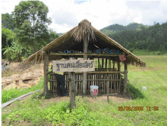
ภาพ 11 ฐานคนเลี้ยงสัตว์