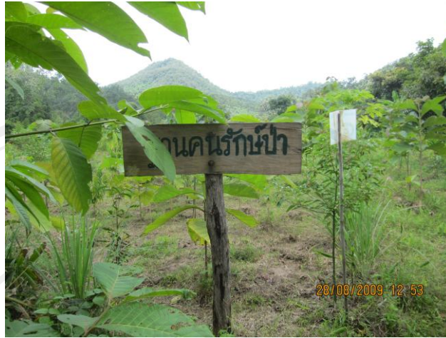
ภาพ 6 ฐานคนรักป่า