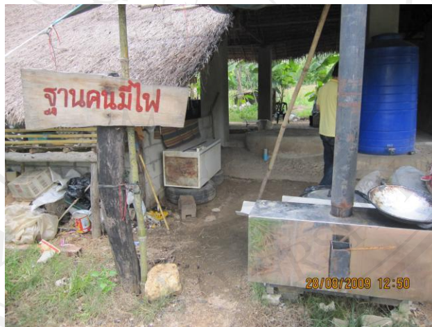
ภาพ 10 ฐานคนมีไฟ

จะอยู่ในช่วงของการทดลองทำอยู่ ซึ่งในการทดลองทำก็พบว่าทางกลุ่มที่ทดลองก็สามารถทำได้และนำไปใช้ได้จริง