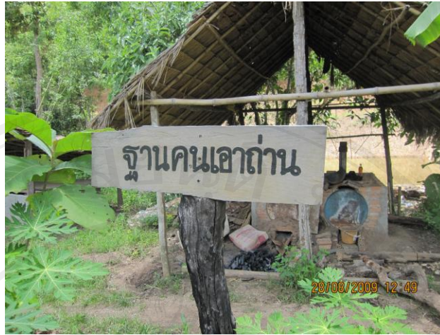
ภาพ 9 ฐานคนเอาถ่าน