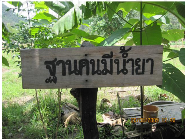
ภาพ 8 ฐานคนมีน้ำยา

ในฐานนี้พระอาจารย์จะเน้นเรื่องเกี่ยวกับการปรับสภาพดิน ซึ่งก็เป็นผลมาจากการดูแลน้ำคูแลป่า แต่สิ่งที่เพิ่มมาก็จะเป็นการทำปุ๋ยจุลินทรีย์ชีวภาพ โดยจะให้ชาวบ้านตั้งกลุ่มกันทำ โดยวัตถุประสงค์ต่างๆก็จะมาจากการบริจาคของชาวบ้าน ในรูปแบบของกลุ่มที่เรียกว่าสหกรณ์บุญ ซึ่งจะเน้นบุญมากกว่าผลประโยชน์ เพราะการออมเช่นนี้จะให้ของที่ตัวเองไม่เดือนร้อน เช่นมูลสัตว์เป็นต้นและจะช่วยกันทำปุ๋ย ทุกวันพระ ปุ๋ยที่ได้ก็จะเป็นของสหกรณ์ ส่วนสหกรณ์ก็จะให้สิ่งตอบแทนคือการให้สมาชิกได้ซื้อน้ำมันในราคาถูก (ราคาเท่าทุน) โดยหลักของกระบวนการนี้ก็จะทำให้เห็นการเชื่อมโยงอย่างเป็นระบบระหว่างดิน น้ำ ป่า ซึ่งเป็นการชี้ให้เห็นผลของการใช้สารเคมี กับไม่ใช่สารเคมี ว่าแบบไหนจะมีความยั่งยืนกว่า