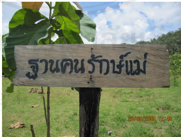
ภาพ 7 ฐานคนรักแม่

กระบวนการของฐานคนรักป่า ตามวิธีการของพระอาจารย์ทั้ง 2 รูปก็จะทำควบคู่ไปกับวิธีการของฐานคนรักน้ำ โดยกระบวนการที่น่าสนใจของพระอาจารย์จะใช้วิธีการปลูกต้นไม้ 400-1,000 ต้น ต้นต่อวัน โดยมีทหารกับชาวบ้านเป็นแนวร่วมหลัก มีการประชุมการทำงานก่อนทุกวัน ตอนเช้า-เย็น และระหว่างการดำเนินงานก็จะใช้การติดต่อประสานงานโดยวิทยุ 6-10 ตัวมีการสำรวจป่าอย่างสม่ำเสมอ 2 วันต่อครั้ง ส่วนต้นกล้าที่ได้มาก็จะให้ชาวบ้านเป็นคนเพาะปลูกเอง โดยทางศูนย์ฯ ก็จะทำการซื้อจากชาวบ้านมาปลูก เป็นการสร้างรายได้ให้แก่ชาวบ้าน และเป็นการย้ำฝึกถึงกระบวนการมีส่วนร่วมของชุมชน โดยต้นไม้ที่ทางศูนย์ฯ ซื้อมานั้นจะให้ทางชาวบ้านเจ้าของต้นกล้านั้นเป็นคนปลูกเอง และท้ายที่สุดพระอาจารย์ก็จะใช้กระบวนการถ่ายทอดความรู้ ระหว่างคนกับปามนุษย์กับสิ่งแวดล้อม อันจะทำให้ชาวบ้านเกิดกระบวนการเรียนรู้ได้ในที่สุด