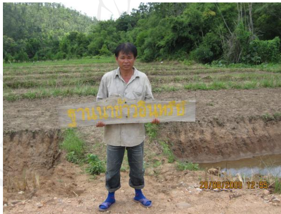
ภาพ 12 ฐานคนทำนาอินทรีย์

พระอาจารย์จะเริ่มจากการอบรมชาวบ้านก่อน โดยชี้ให้เห็นถึงการเลี้ยงที่มีต้นทุนในการเลี้ยงต่ำ และมูลสัตว์ก็จะสามารถนำไปทำปุ๋ยหมักชีวภาพ ช่วยในฐานที่ 3 คนรักแม่ได้ โดยสัตว์ที่เลี้ยงจะเป็นหมู ไก่ วัว ควาย เป็นต้น ซึ่งพระอาจารย์ก็เน้นย้ำว่าเราสามารถนำมาบริโภคเองได้ เป็นการลดต้นทุนการบริโภคในครอบครัวอีกด้วย