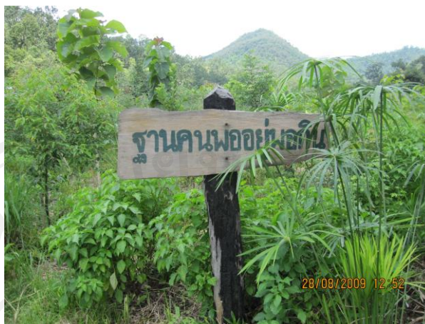
ภาพ 13 ฐานคนพอยู่พอกิน