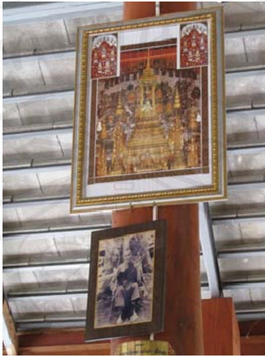
ภาพพระแก้วมรกต และครูปาศรีวิชัย