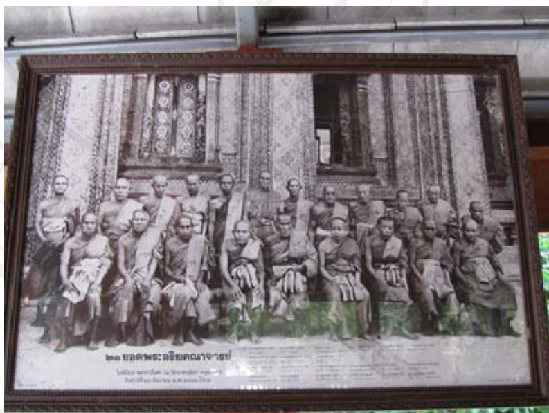
ภาพถ่ายพระอริยคณาจารย์ จำนวน 20 องค์