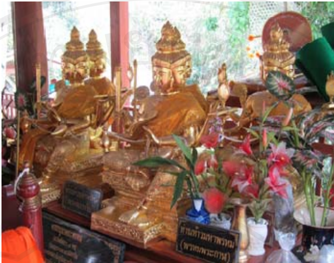
ภาพพระพรหม