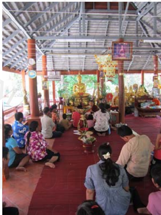
ภาพเทศกาลสงกรานต์ (วันที่ 15 เมษายน 2554)