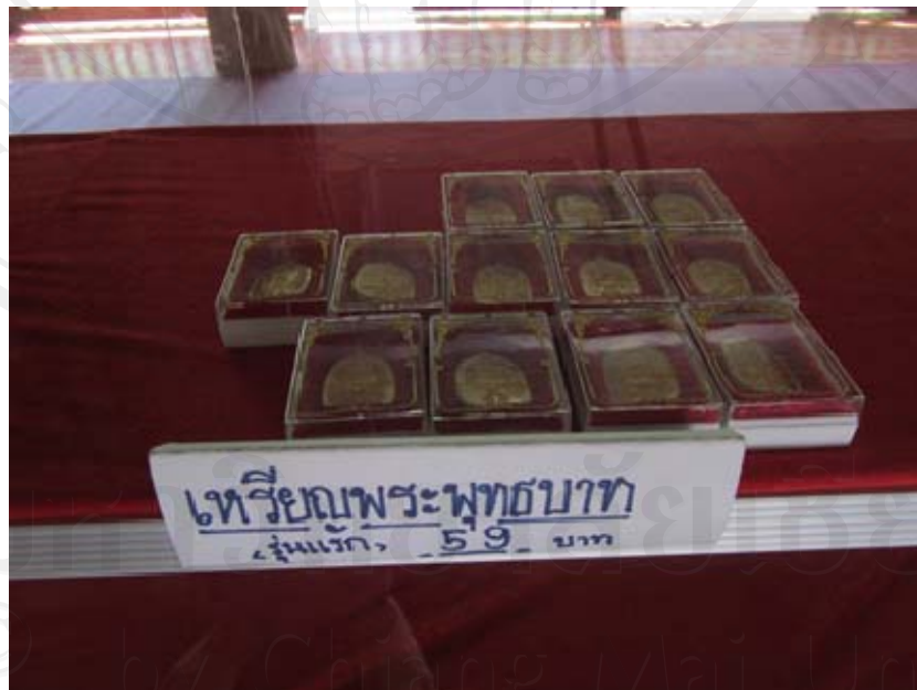
ภาพเหรียญพระพุทธรูปบาท