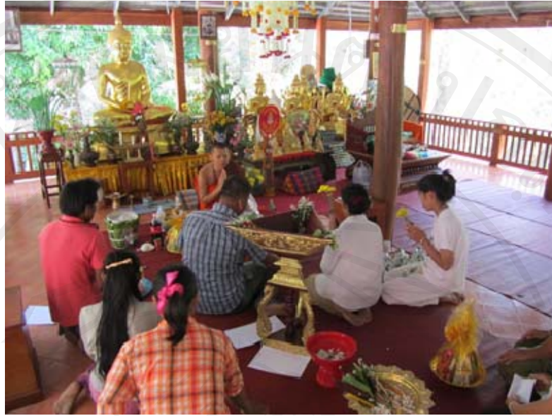
ภาพชาวบ้านมาทำบุญที่ห้วยหลวงแม่แอน หลังจากเสร็จพิธีในวันธรรมสวนะจากวัดแม่แอน