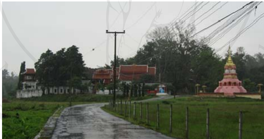
ภาพสภาพวัดแม่แอนในปัจจุบัน