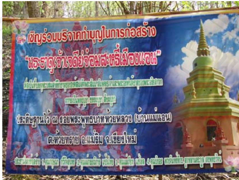
ภาพโปสเตอร์ประชาสัมพันธ์เชิญชวนผู้มีจิตศรัทธาร่วมทำบุญในการก่อสร้าง “พระธาตุเจ้าเจดีย์จอมสะหรีเมืองแอน”