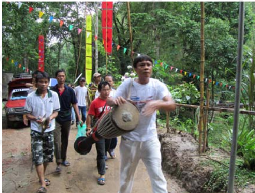
ภาพชาวบ้านมาร่วมพิธีสมโภชรอยพระพุทธรบาทและรอยพระพุทธรหัสต์ ครอบรอบ 2 ปี (วันที่ 17 พฤษภาคม 2554)