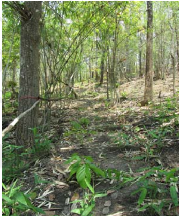
ภาพทางขึ้น “พระธาตุเจ้าเจดีย์จอมสะหรีเมืองแอน” อยู่ระหว่างรอการก่อสร้าง