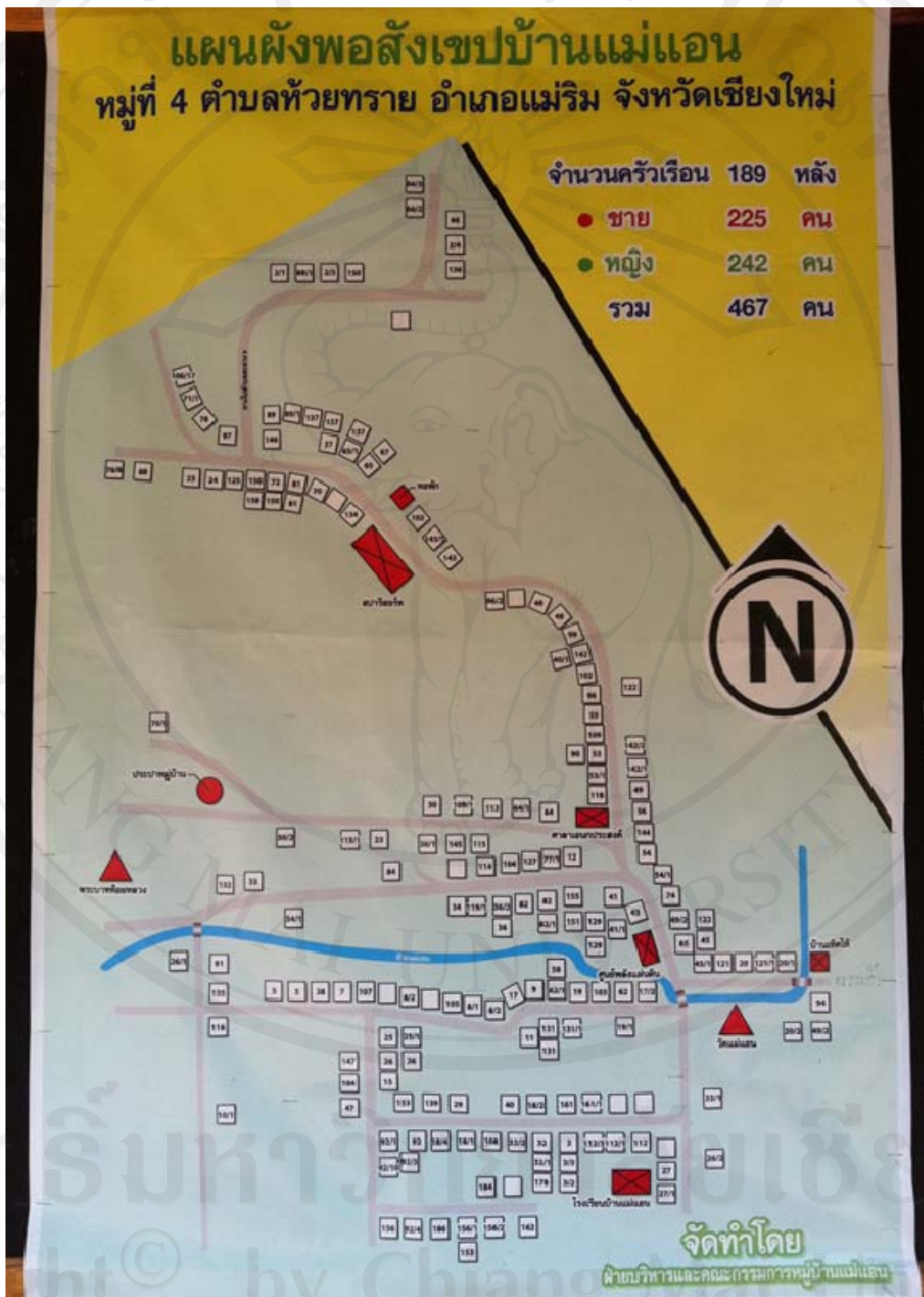
ภาพหมู่บ้านแม่แอน ตำบลห้วยทราย อำเภอเมือง จังหวัดเชียงใหม่