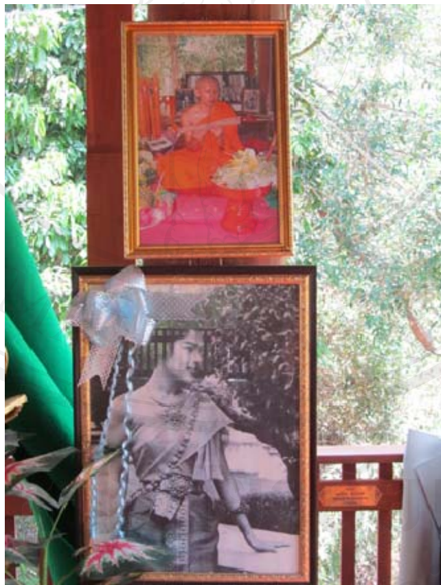
ภาพพระจักรา วรญาโณ และสมเด็จพระนางเจ้าพระบรมราชินีนาถ