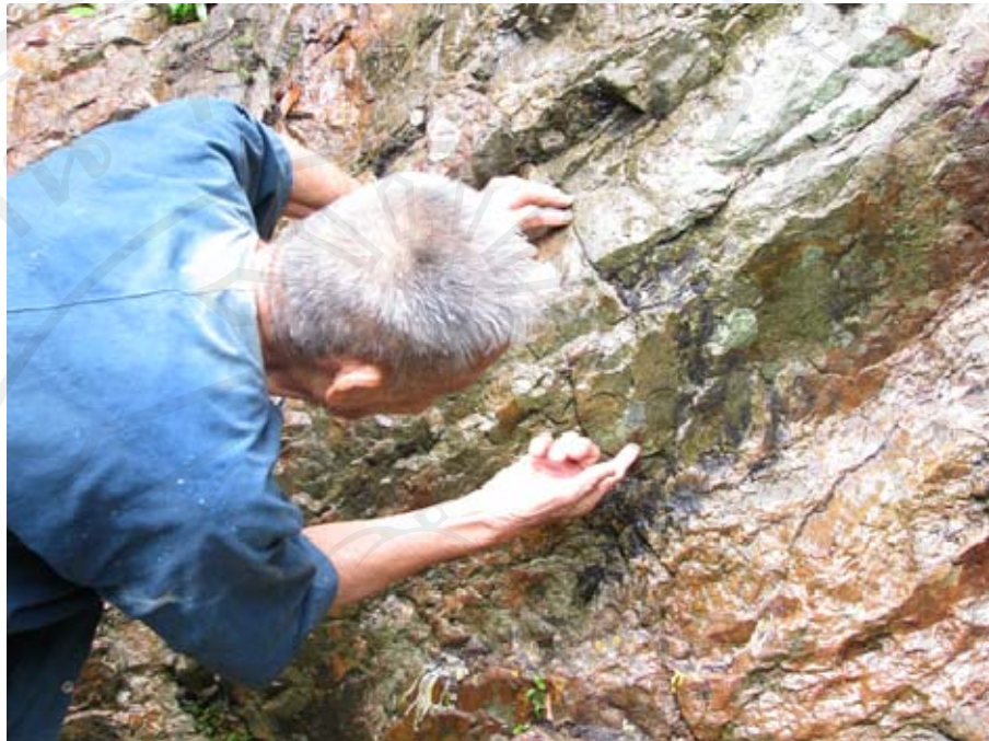
ภาพ ชาวบ้านชี้ใบหน้าคนยืมที่ปรากฏบนโขดหิน