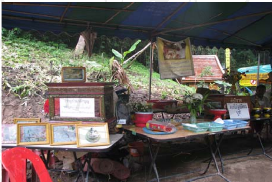
ภาพ ชาวบ้านตั้งตู้รับบริจาคและตู้ร่วมทำบุญในการดำเนินกิจกรรมต่างๆ ในห้วยหลวงแม่แอน