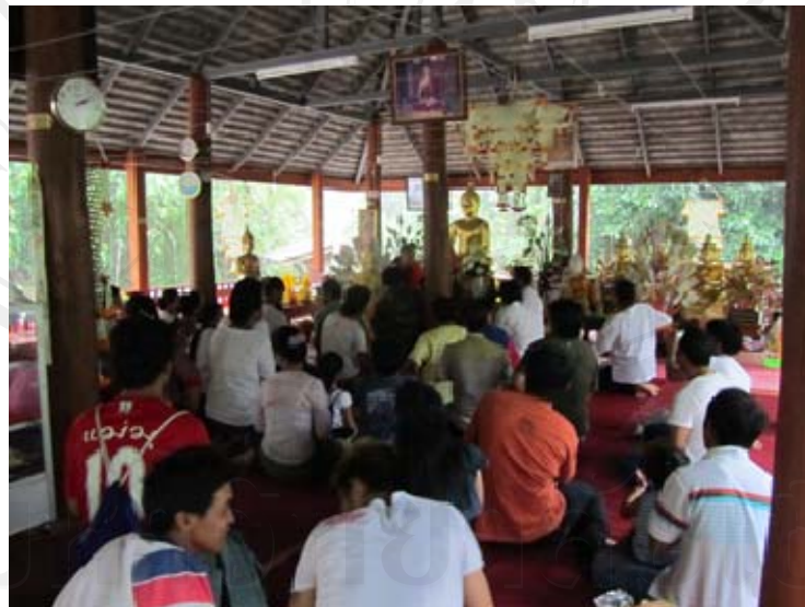
ภาพทำพิธีฉลองครบรอบ สมโภช รอยพระพุทธรบาท ครบรอบ 2 ปี (วันที่ 17 พฤษภาคม 2554)