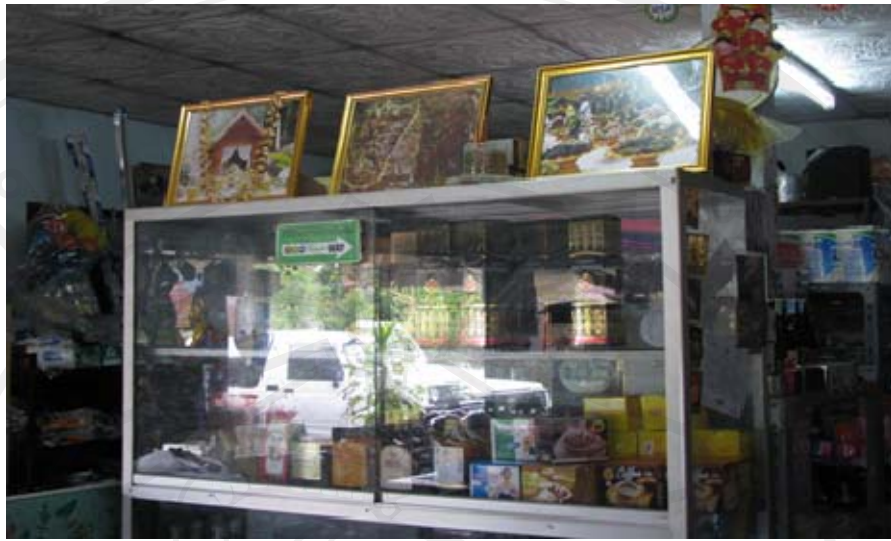
ภาพร้านขายของชำประจำหมู่บ้านแม่แอนขายภาพเพื่อนำไปสมทบทุนการดำเนินกิจกรรมต่างๆ ใน ห้วยหลวงแม่แอน