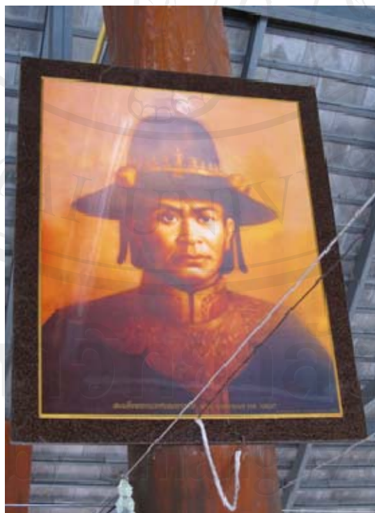
ภาพสมเด็จพระนเรศวรมหาราช