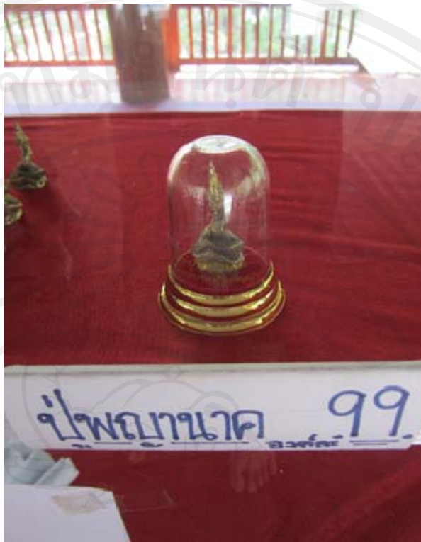
ภาพพ่อปู่พญานาค