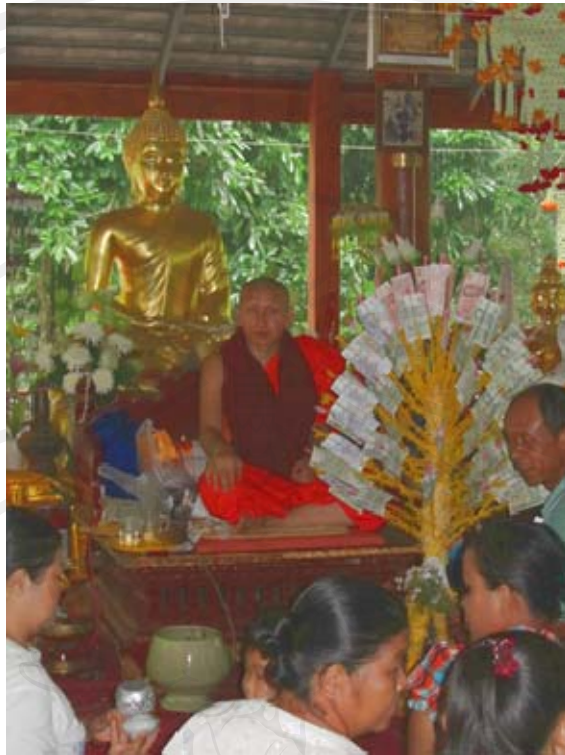
ภาพพิธีฉลองครบรอบ สมโภช รอยพระพุทธรบาท ครบรอบ 2 ปี (วันที่ 17 พฤษภาคม 2554)