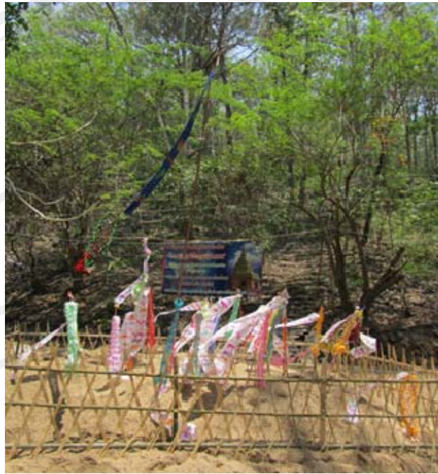
ภาพเทศกาลสงกรานต์ (วันที่ 15 เมษายน 2554)