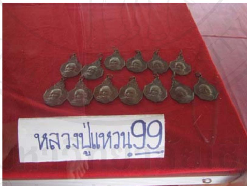
ภาพเหรียญหลวงปู่แหวน