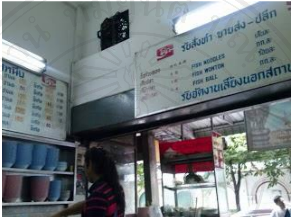
บรรยากาศภายในร้าน