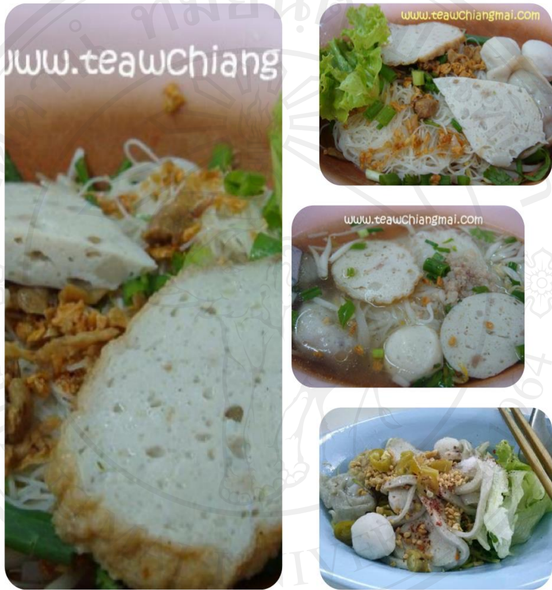
ผลิตภัณฑ์ร้านก๋วยเตี๋ยวปลารสหนึ่ง