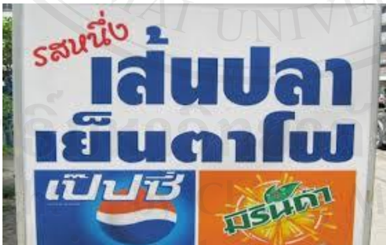
ป้ายหน้าร้าน

ร้านตั้งอยู่บนถนนเจริญประเทศ ตรงข้าม โรงแรมเพชรงาม เดินทางจากถนน Night Bazar เลี้ยวซ้ายเพื่อเข้าสู่ถนนเจริญประเทศ จากนั้น วิ่งมาตามถนน ประมาณ 200 เมตร ร้านตั้งอยู่ทางด้านซ้ายมือ ตรงข้าม โรงแรมเพชรงาม จ.เชียงใหม่