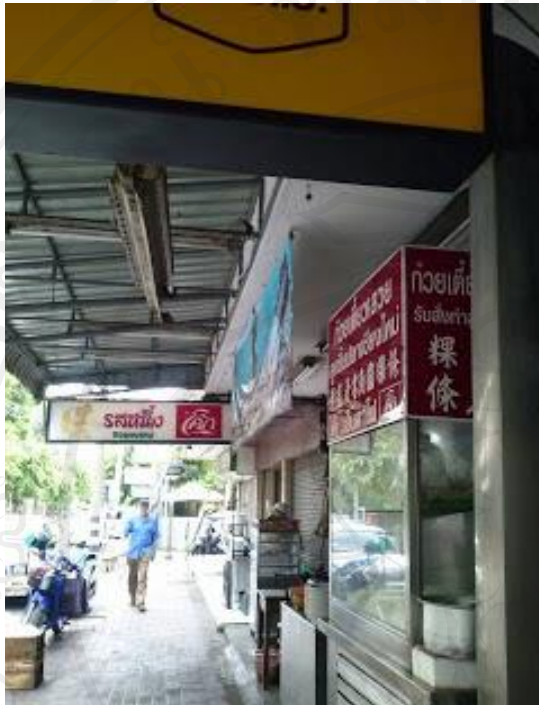
ที่ตั้งของร้าน