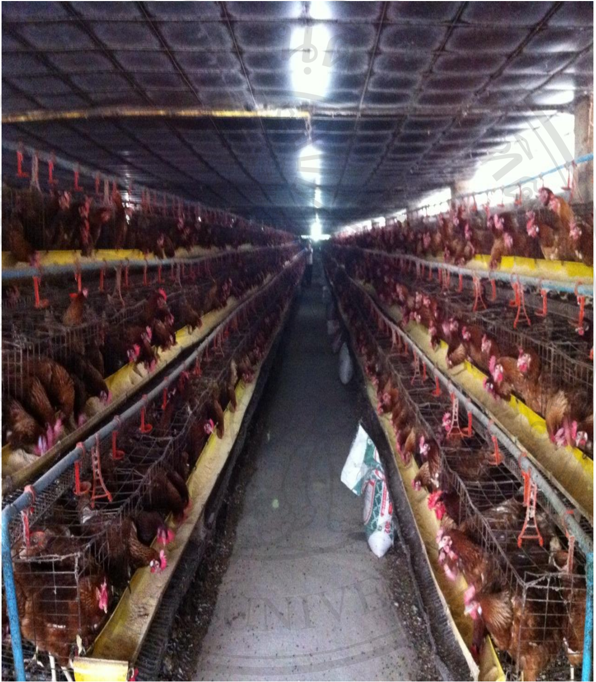
รูปภาพที่ 5 kandangเลี้ยงไก่ไข่