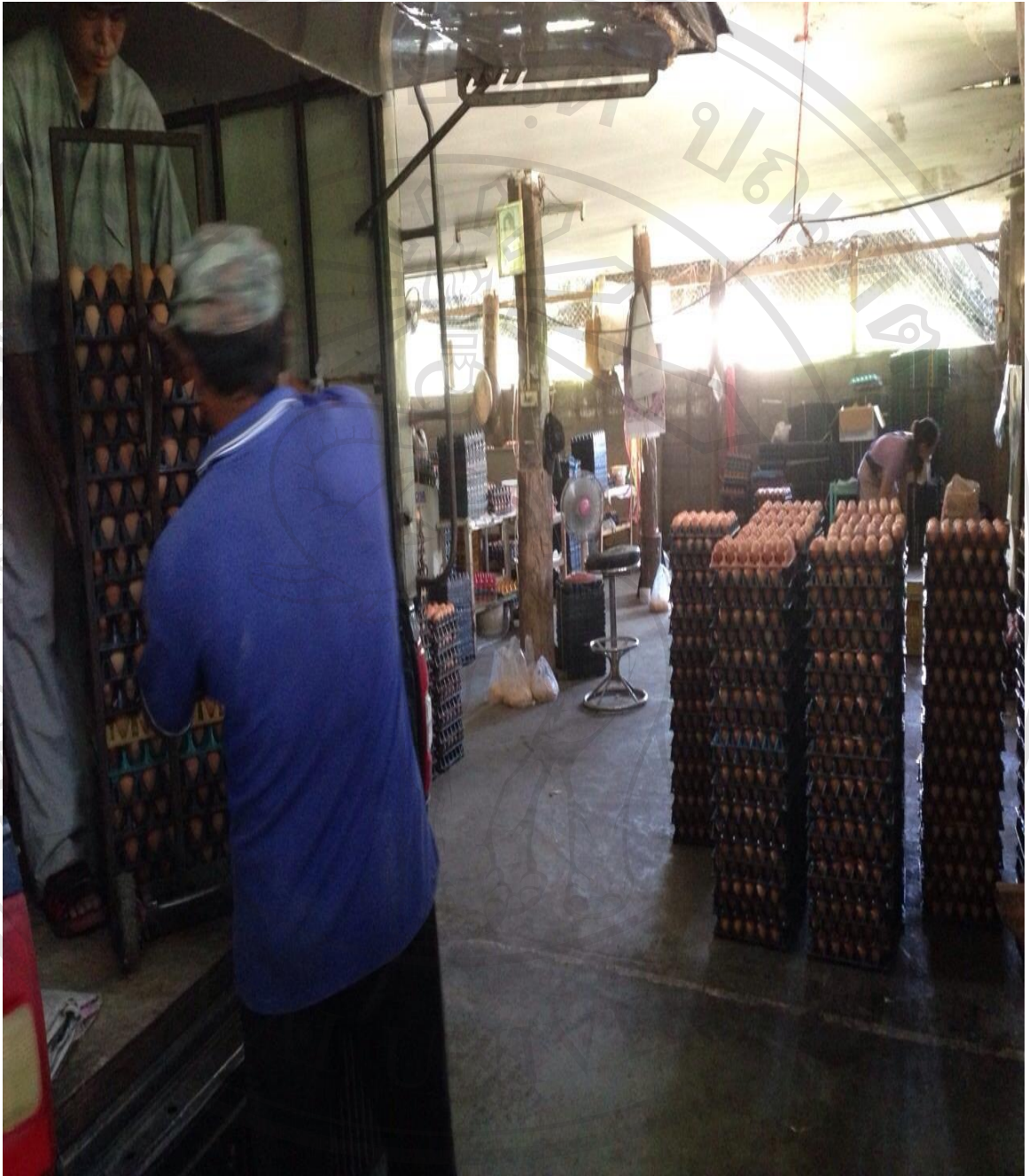
รูปภาพที่ 8 การขนส่งไข่ไก่

ลิขสิทธิ์มหาวิทยาลัยเชียงใหม่ Copyright © by Chiang Mai University All rights reserved