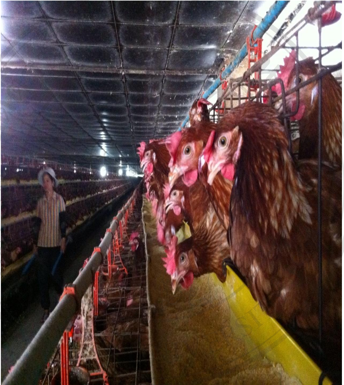
รูปภาพที่ 4 ไก่ไข่พันธุ์ไฮไลน์ (Hyline)

ลิขสิทธิ์มหาวิทยาลัยเชียงใหม่ Copyright © by Chiang Mai University All rights reserved