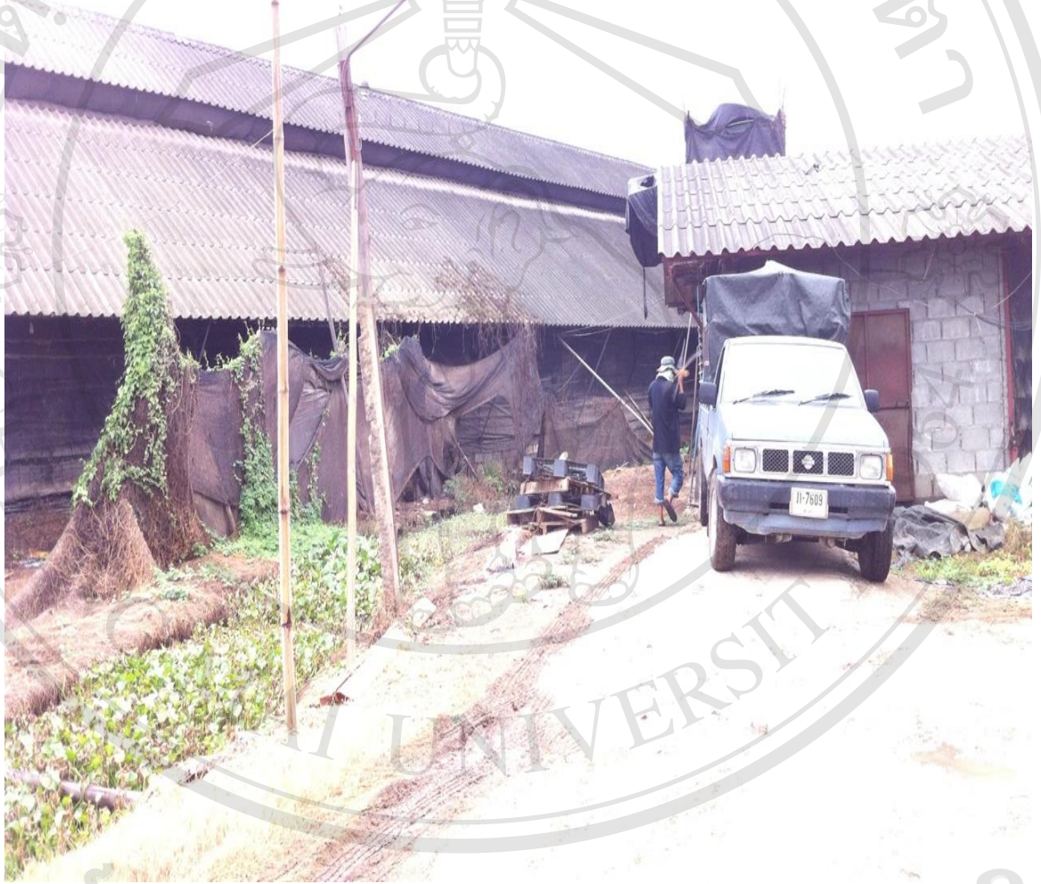
รูปภาพที่ 2 โรงเรือนเลี้ยงไก่ไข่