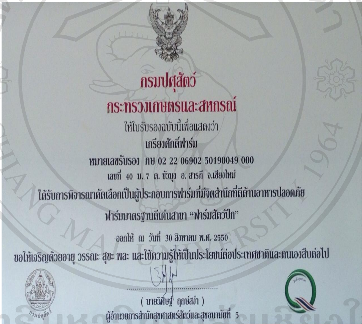
รูปภาพที่ 1 ใบรับรองจากกรมปศุสัตว์

ฟาร์มไก่ไข่เครื่องสกัดมีวิธีการเลี้ยงไก่ในโรงเรือนแบบปิด (EVAP) ซึ่งเป็นโรงเรือนที่ระบายความร้อนโดยใช้การระเหยของน้ำ มีส่วนประกอบหลัก ได้แก่ ฉนวนป้องกันความร้อน แผ่นระเหยไอน้ำ และพัดลมดูดอากาศ พัดลมจะดูดอากาศผ่านแผ่นระเหยไอน้ำเข้าภายในโรงเรือนทางเดียว ทำให้อากาศภายในโรงเรือนเย็นลง สามารถควบคุมอุณหภูมิได้คงที่ตลอดเวลา จึงช่วยลดอัตราการสูญเสียที่เกิดจากสภาพอากาศร้อน และเพิ่มปริมาณการเลี้ยงไก่ต่อตารางเมตรได้ด้วย