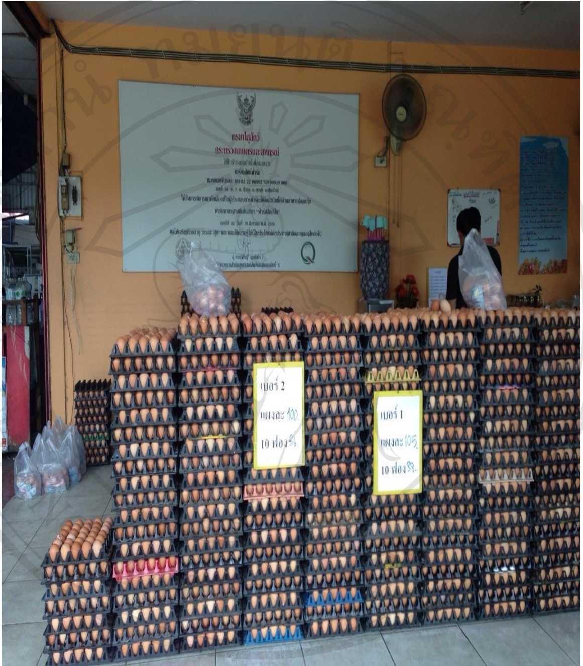
รูปภาพที่ 6 หน้าร้านขายไข่ไก่เกรียงศักดิ์ฟาร์ม