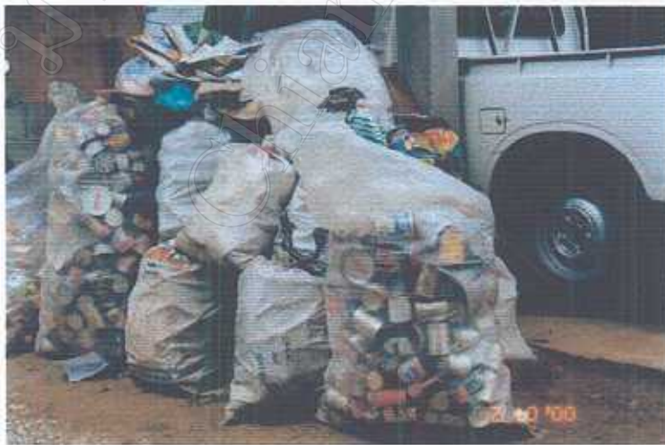
การคัดแยกมูลฝอยของชุมชนกำแพงเมือง