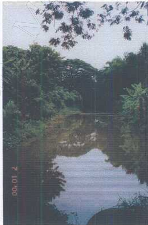
สภาพแวดล้อมภายในชุมชนกำแพงเมือง