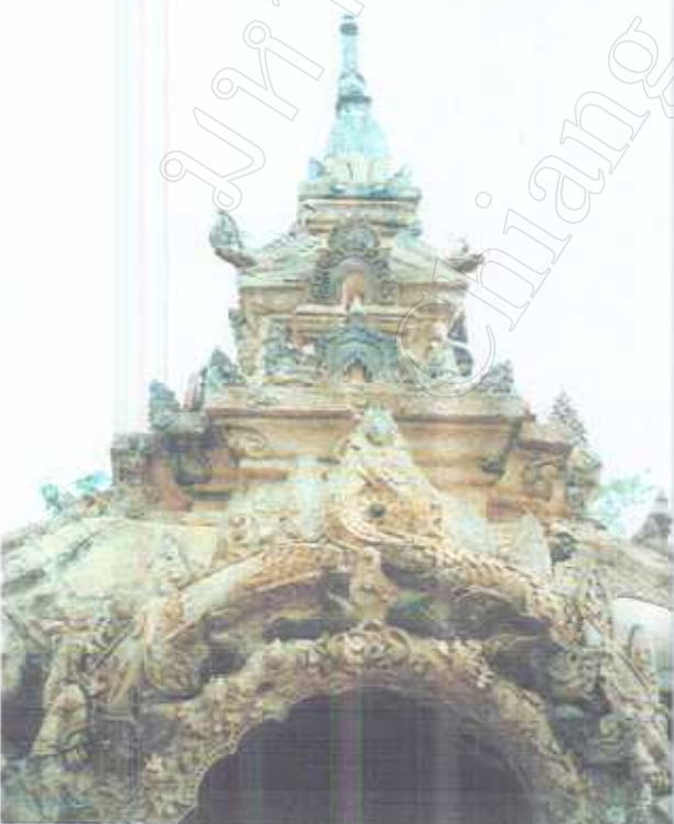
ลวดลายประดับซุ้ม ที่ประกอบด้วยเครื่องเกาล้านนา และรูปสัตว์หิมพานต์