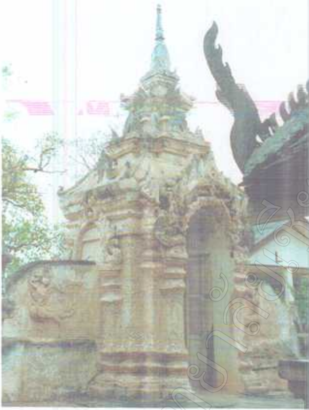
ซุ้มประตูโขง บริเวณทางเข้าด้านทิศตะวันออก ซึ่งเป็นทางเข้าด้านหน้าวัด ลักษณะศิลปะล้านนา