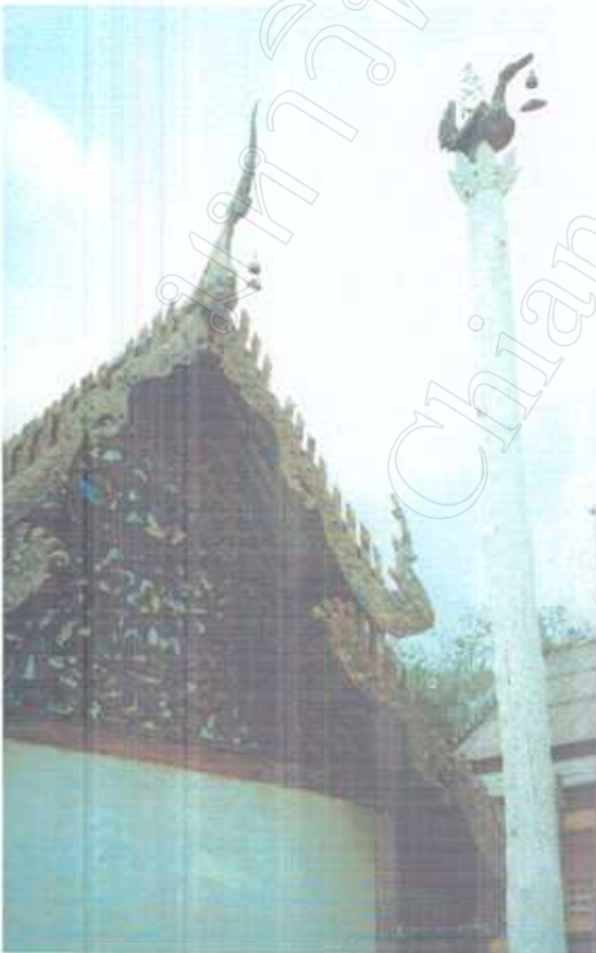
ภาพบน แสดงรูปทรงสี่ประดับอยู่บนหน้าบันของ ศาลาบาตรที่อยู่รายรอบวิหาร