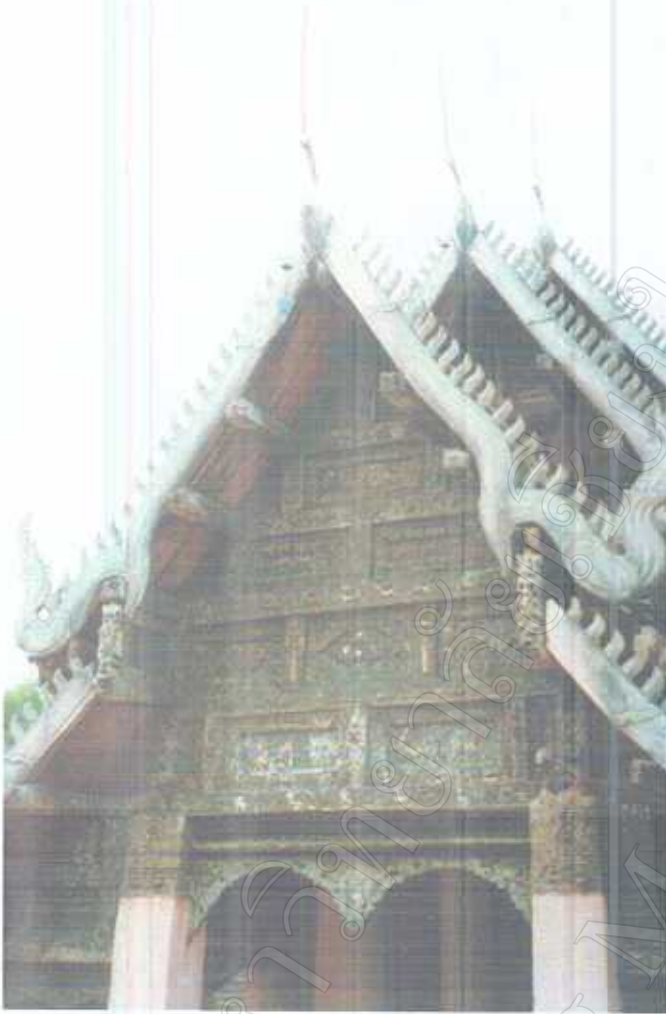
หน้าบันวิหารแบบ ม้าต่างใหม่ ประดับด้วยลวดลายปูนปั้น