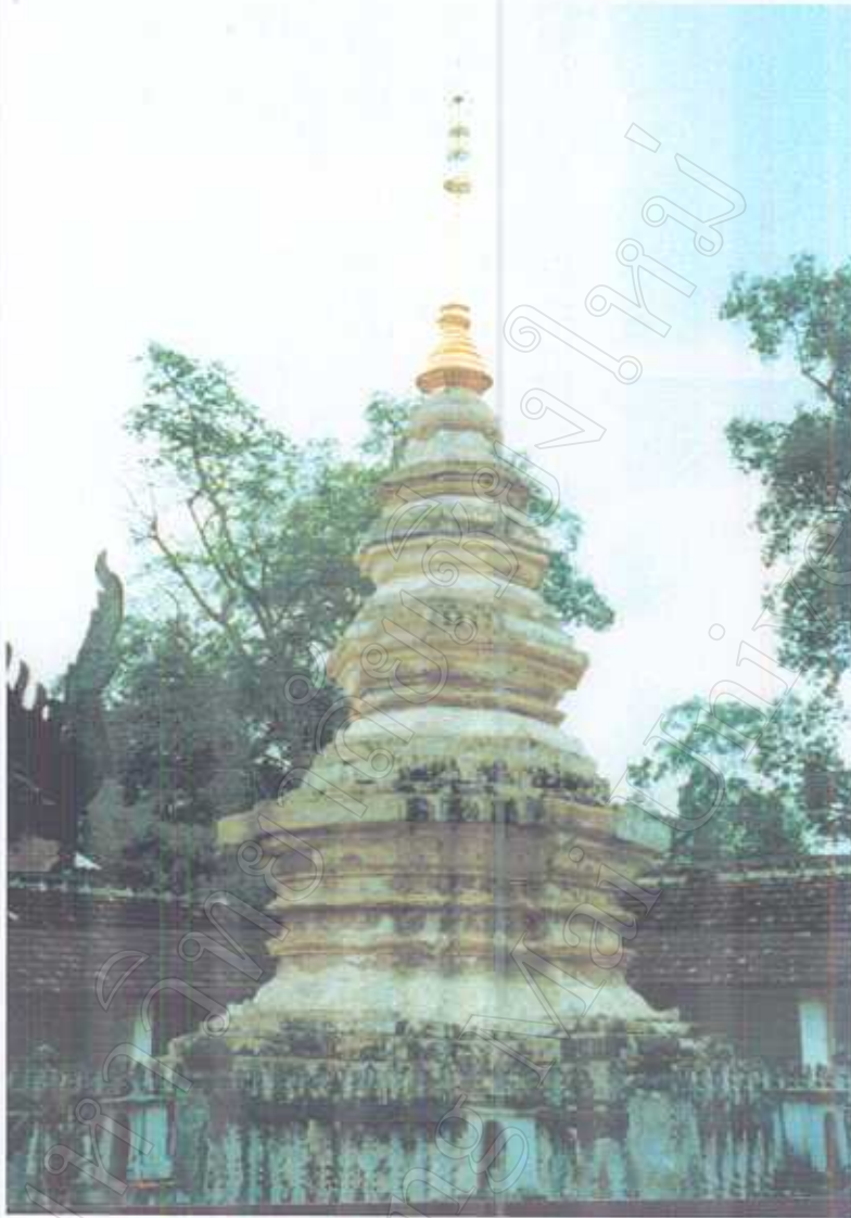
เจดีย์ด้านหลังวิหาร