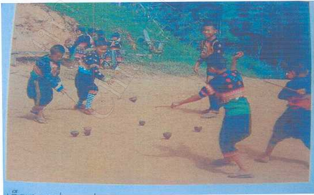
รูปภาพที่ 2 การละเล่นลูกข่างของเด็กชายชาวเขาในเทศกาลปีใหม่

ปัจจุบันการละเล่นลูกข่างจะเป็นลักษณะแข่งขันเพื่อชิงคู่ได้นักท่องเที่ยว