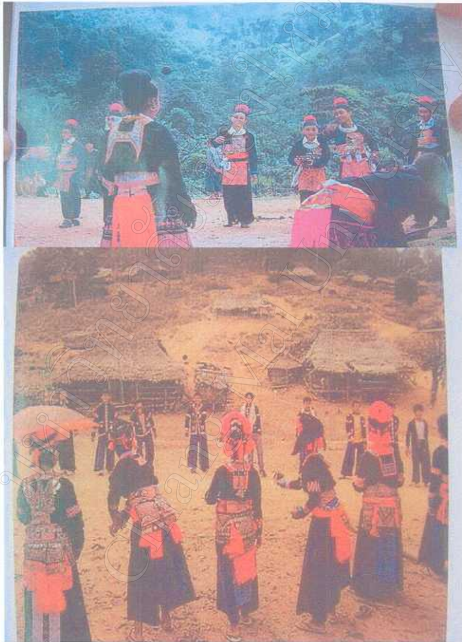
กลุ่มชนชาวเผ่าม้งที่อพยพหนี โมงชะ โขนศึก อดีตกลุ่มสาวลูกหน่มุ่งชุดประจำเผ่า ปัจจุบันชุดประจำเผ่าถูกเปลี่ยนเป็นชุดสากลมากขึ้น