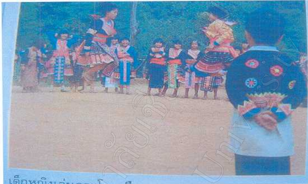
เด็กหญิงเล่นกระโดดเชือก

ปัจจุบันการละเล่นกระโดดเชือกของเด็กผู้หญิงชาวเขาจะไม่ได้ได้รับความสนใจแล้ว