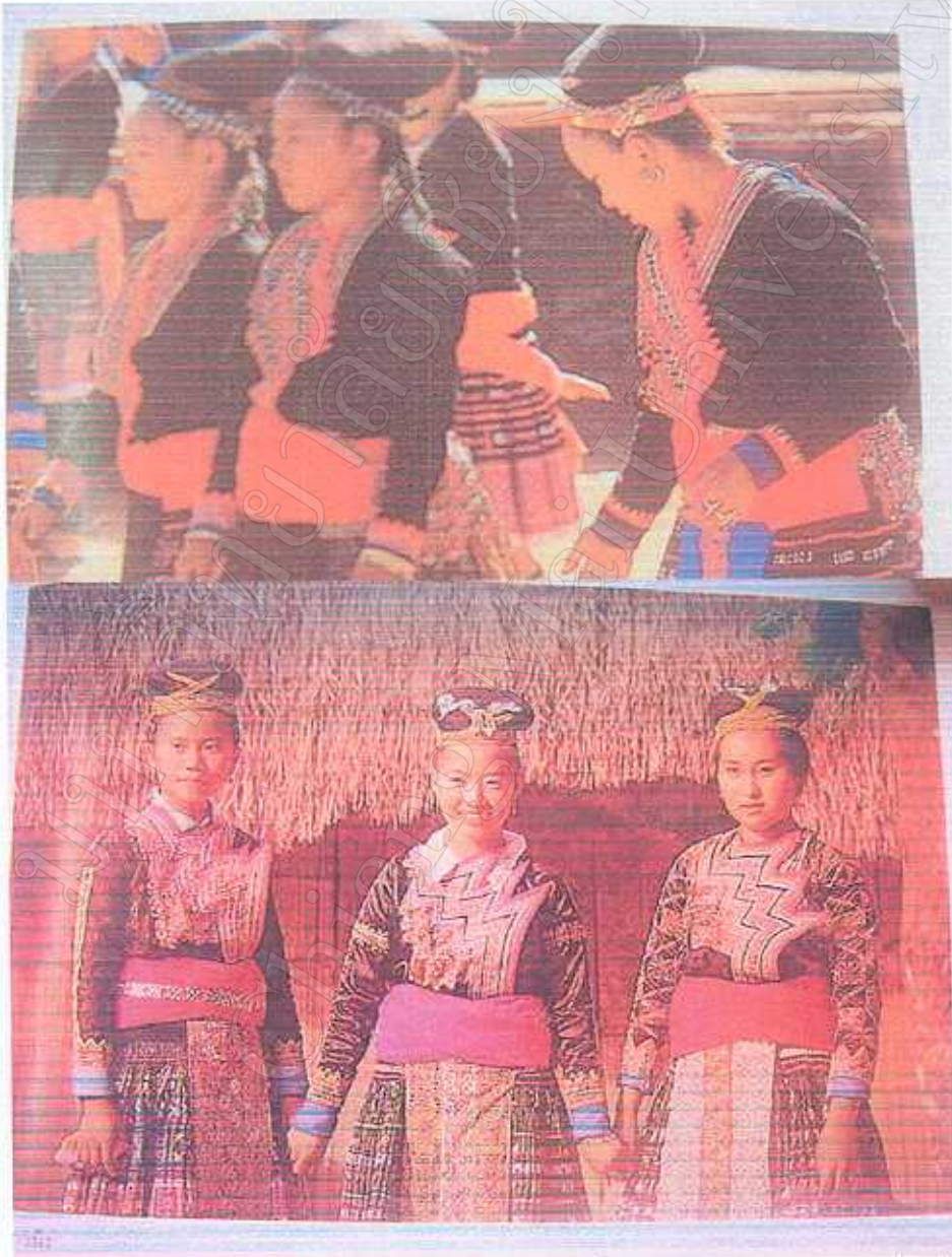
รูปภาพ ที่ 6 การแต่งกายชุดประจำเผ่าม้ง ในงานเทศกาลต่างๆ

ในปัจจุบันการแต่งกายชุดประจำเผ่าในงานเทศกาลจะเริ่มพบเห็นน้อยลง หรือจะเห็นเป็นแบบผสมผสานกับวัฒนธรรมอื่นๆ เป็นส่วนมากและเป็นชุดสากลมากขึ้น