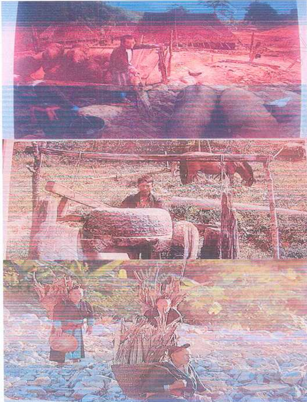
รูปภาพที่ 5 วิธีชีวิต การดำรงชีพประจำวันชนเผ่าม้ง

ปัจจุบันเกิดการเปลี่ยนแปลงขึ้นในชุมชน 1. ลดการเลี้ยงหมู