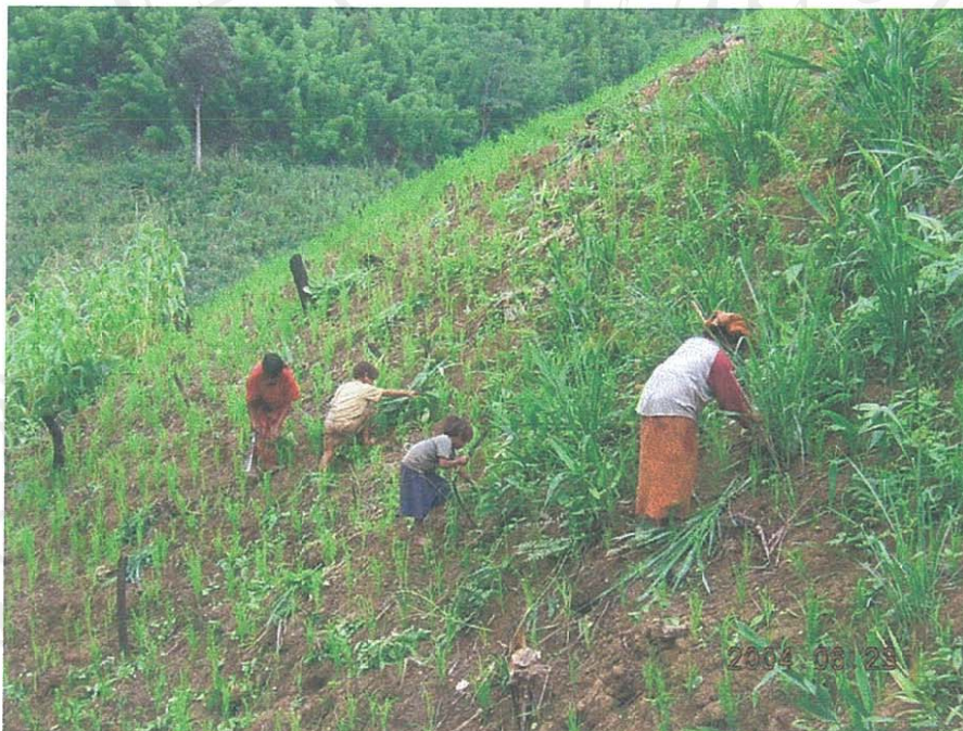
รูป 8 แสดงการถางหญ้าในไร่ข้าวที่เป็นที่ดินของชาวมลาบรับมาจากการยกให้ของชาวม้งในแบบ “ระหมาบมล่า” โดยเลือกปลูกทั้งข้าวโพดและข้าวไร่เพื่อเก็บไว้บริโภคที่เห็นนี้คือ ครัวเรือนตาแก้ว