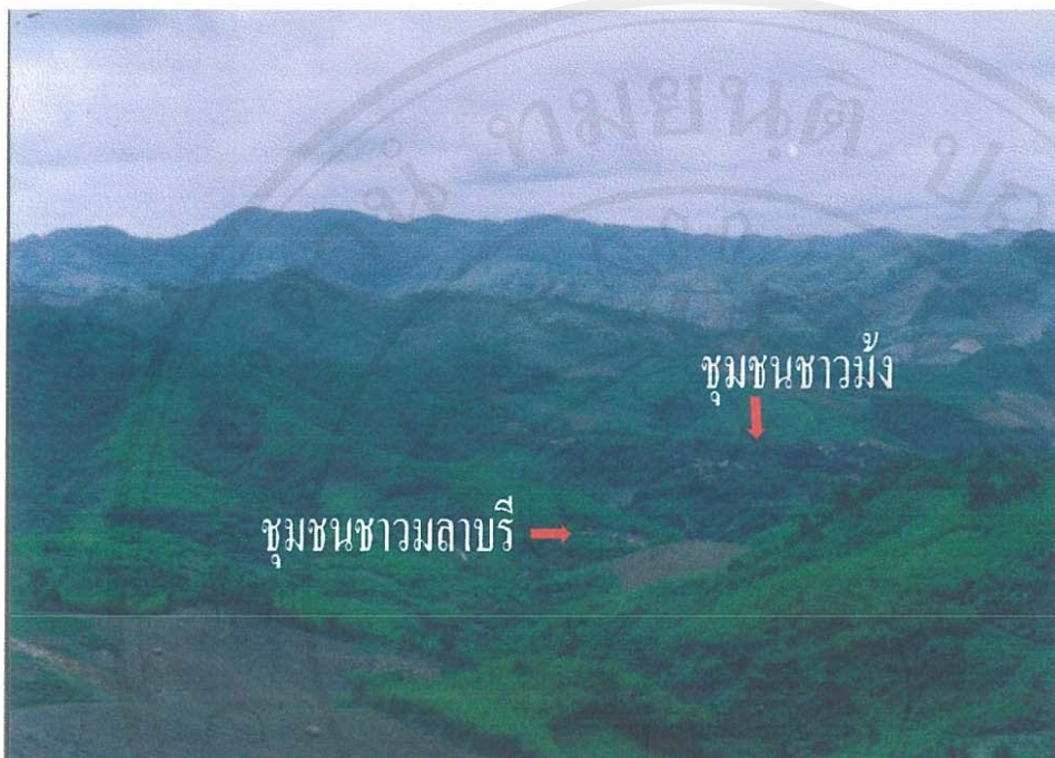
รูป 1 แสดงสภาพหมู่บ้านที่ตั้งชุมชนชาวมลาบรีที่โอบล้อมด้วยพื้นที่ป่าเหล่าของชุมชนม้ง