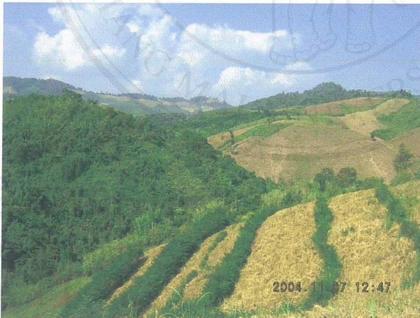
รูป 10 แสดงการปลูกแนวกระถินมะแฮะในไร่ข้าวของชาวมลาบรีในแบบ “ระหมาบดูมาบอน” ที่ต่างไปจากการจัดการที่ดินแบบชาวม้งที่เห็นอยู่ไกลออกไป