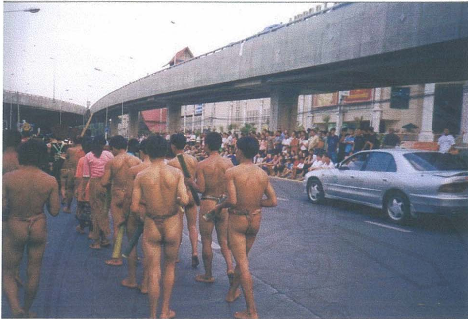
รูป 5 แสดงการนำชาวมลาบรีมาร่วมเดินในวันที่ 10 เมษายน พ.ศ. 2547 เนื่องในงาน "เย็นทั่วหล้า มหาสงกรานต์ อารยธรรมล้านนาและห้าประเทศ" ณ จังหวัดเชียงใหม่