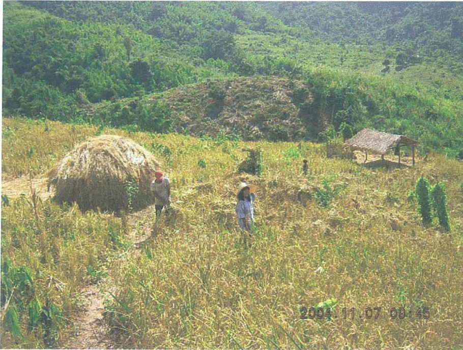
รูป 7 แสดงการเกี่ยวข้าวที่ครัวเรือนมลาบหรืออย่างตาเล้งได้ที่ดินจากนายจ้างชาวม้งแบ่งให้เพื่อปลูกข้าวไร่ในแบบ “ระหมาบแก้วหระ”