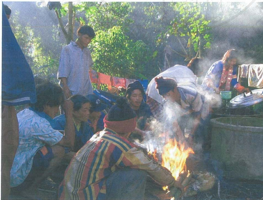
รูป 12 แสดงภาพการช่วยกันจัดการกับหมูของกลุ่มผู้ชายในชุมชน ในขณะที่ผู้หญิงกำลังเตรียมน้ำไว้ต้มเนื้อหมู