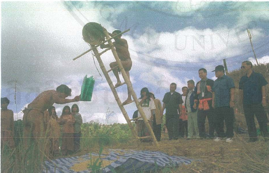
รูป 2 แสดงการตีข้าวของชาวมลาบรีเมื่อ ปี พ.ศ. 2544 โดยมีอดีตผู้ว่าราชการจังหวัดน่าน (สวมหมวก) และหัวหน้าส่วนราชการจังหวัดน่านเยี่ยมชมการตีข้าวของชาวมลาบรีตามกรรมวิธีแบบม้ง