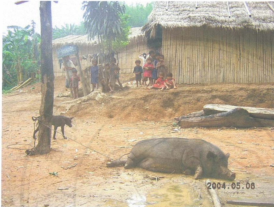
รูป 11 แสดงภาพหมูที่รวบรวมเงินจากครัวเรือนต่างๆ ไปซื้อมา โดยเนื้อหมูจะนำมาชำแหละแบ่งกันทุกครัวเรือนในชุมชนมลาบรี