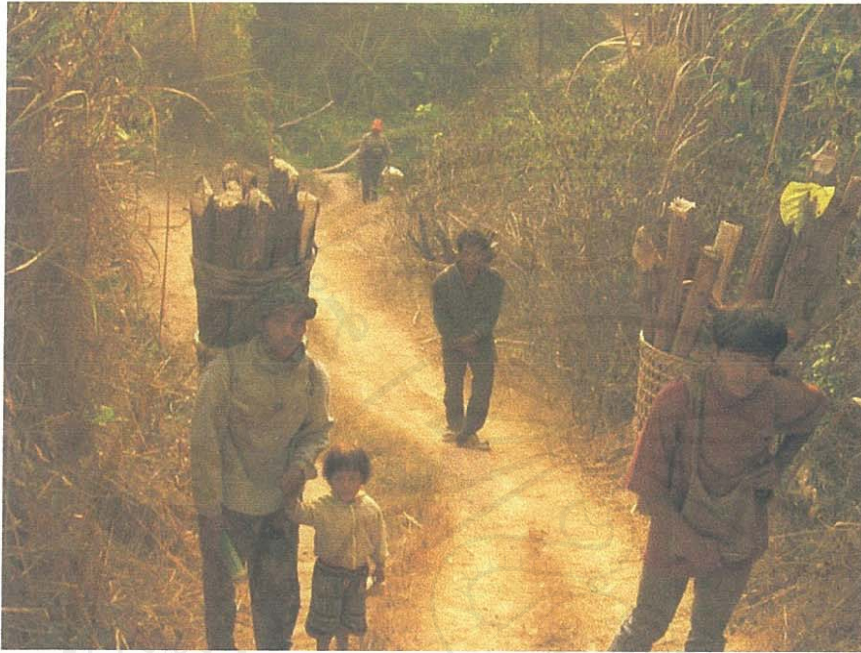
รูป 9 แสดงการนำทรัพยากรบางอย่างเช่น ไม้ฟืน ที่เก็บมาจากป่าเหล่าของชาวม้งที่แรงงานนำระบบอุปถัมภ์มาใช้ในการเข้าถึงทรัพยากรที่จำเป็นในชีวิตประจำวัน