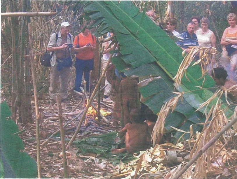
รูป 3 แสดงการ “ไปฝรั่ง” ของชาวมลาบรี ผู้ชายทั้งเด็กและผู้ใหญ่สวม “ตะแยะ” แสดงในบริเวณที่ ได้นัดกับบริษัทท่องเที่ยวในเขตป่าสงวนแห่งชาติ อำเภอบ้านหลวง จังหวัดน่าน