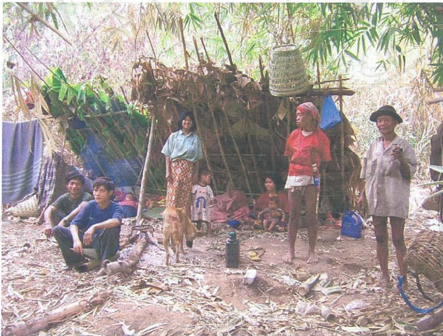
รูป 6 แสดงสภาพที่พักของแรงงานชาวมลาบรี 2 ครอบครัวที่มาอยู่ทำงานในไร่ชาวม้งที่หมู่บ้านม้งห้วยนาจิว