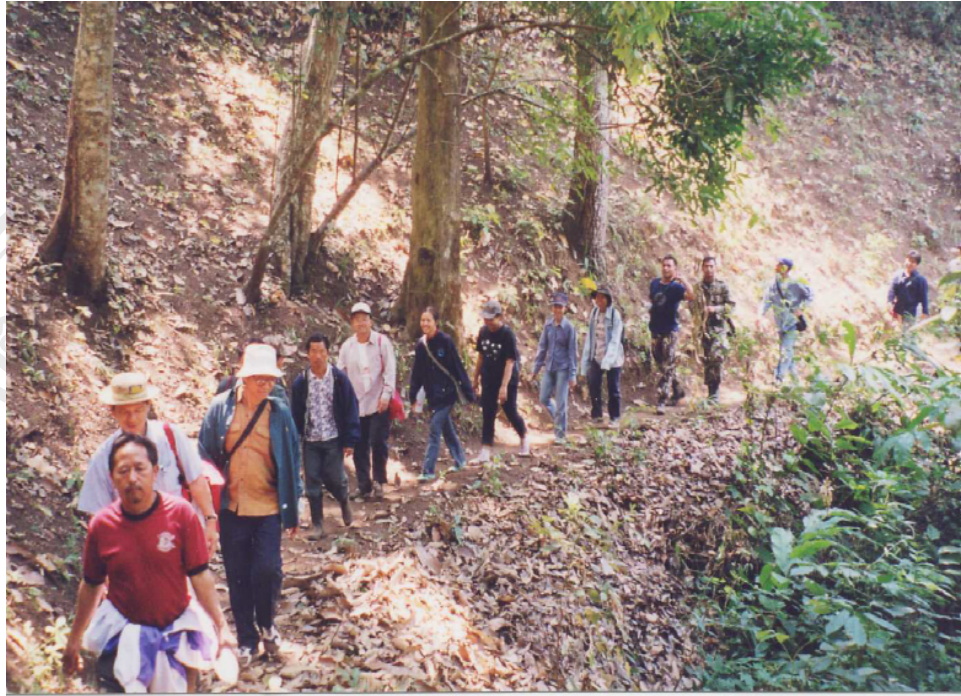
กิจกรรมการตรวจป่าตรวจสายน้ำ