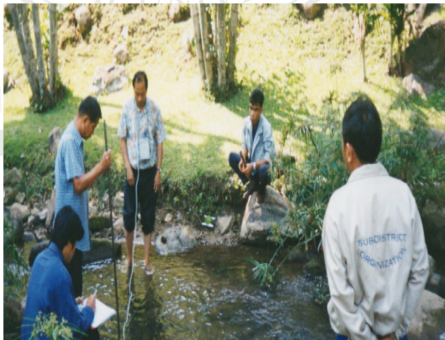
กิจกรรมการวัดปริมาณน้ำ