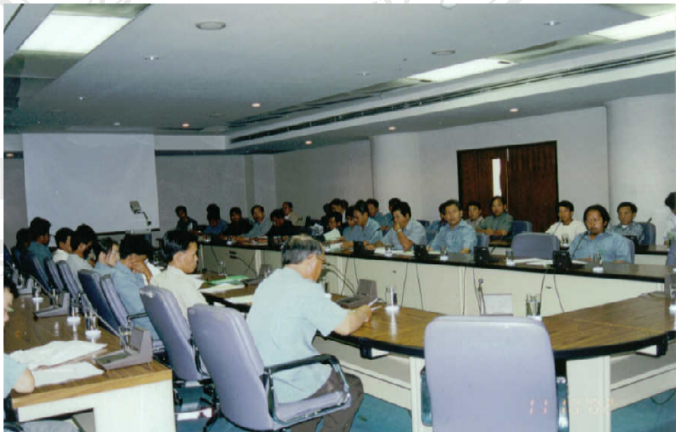
กิจกรรมการอบรมสัมมนา