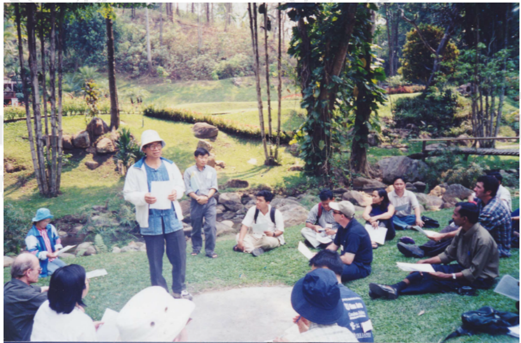
กิจกรรมการแลกเปลี่ยนข้ามเครือข่าย