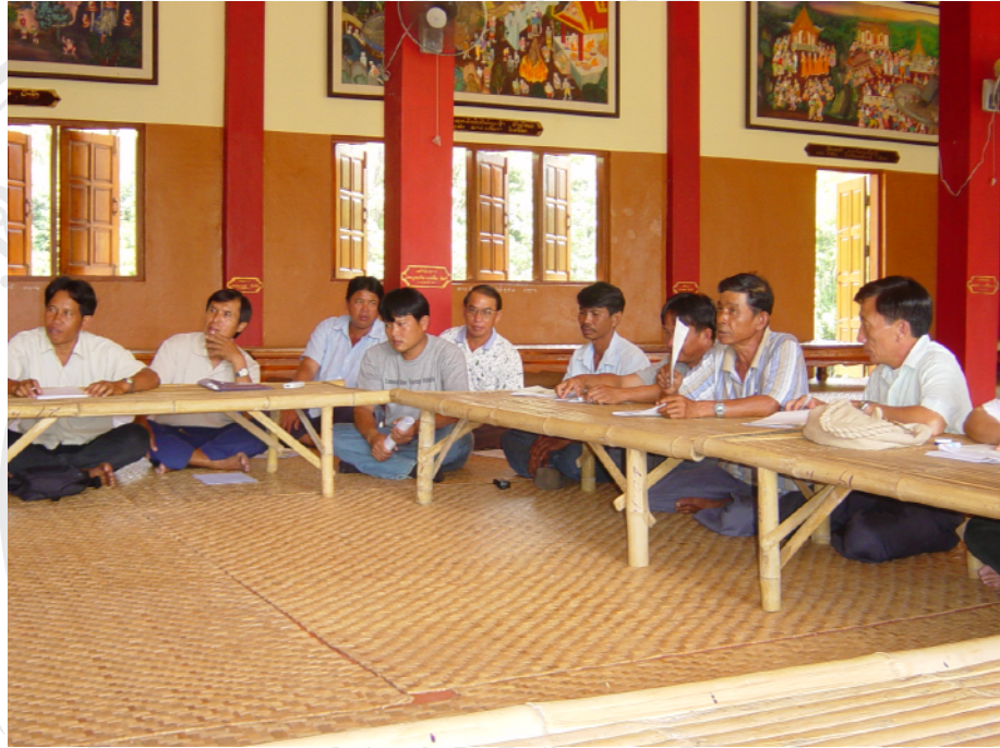
กิจกรรมการประชุมคณะกรรมการประจำเดือน