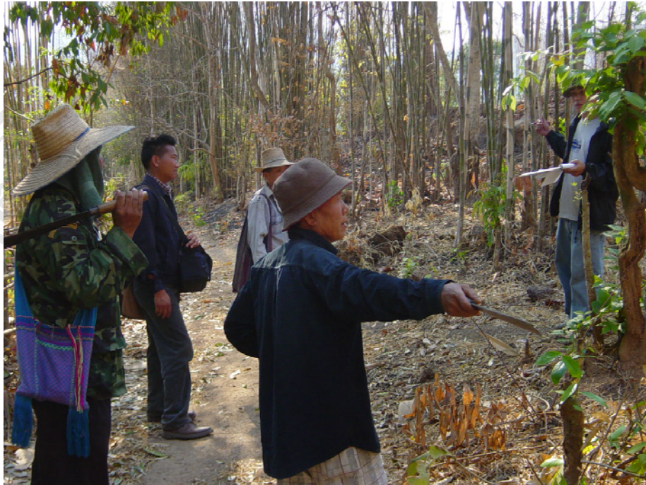
กิจกรรมการสำรวจการแผนที่การใช้ที่ดิน