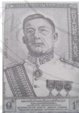
รูปที่ 8 เจ้ามหาชีวิตศรีสว่างวัฒนา

ในวันที่ 2 ธันวาคม พ.ศ.2518 พระราชอาณาจักรลาว ถูกเปลี่ยนชื่อเป็น สาธารณรัฐประชาธิปไตยประชาชนลาว บนดวงตราไปรษณียากรของลาวก็ยังคงใช้คำว่า ROYAUME DU LAOS อยู่ดั้งเดิม แต่ คำว่า ROYAUME DU จะถูกแรเงาโดยปากกาหรือดินสอ แสดงให้เห็นว่าระบอบกษัตริย์ได้หมดอำนาจในลาวไปแล้ว ( http://www.laostamp.com/stamp_lao.htm :26 มิถุนายน 2550)