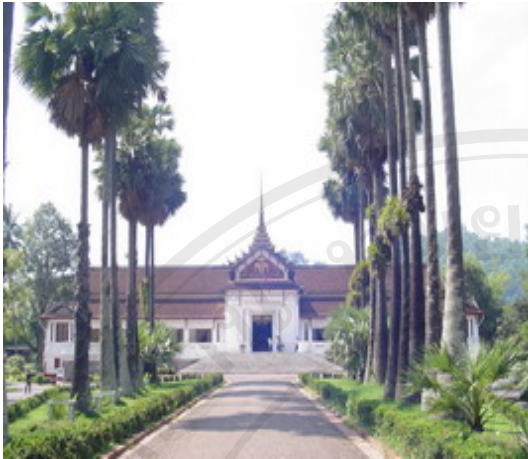
รูปที่ 6 พิพิธภัณฑ์เจ้ามหาชีวิต