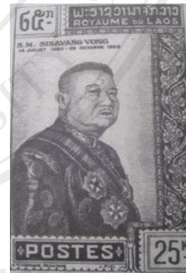
รูปที่ 9 เจ้ามหาชีวิตศรีสว่างวงศ์

ดวงตราไปรษณียากรของลาวสมัยพระราชอาณาจักรนั้นมีหลายแบบ แต่ที่เด่นชัดว่าลาวยังปกครองโดยเจ้ามหาชีวิตคือ การผลิตดวงตราไปรษณียากรภาพเจ้ามหาชีวิตศรีสว่างวงศ์ เจ้ามหาชีวิตศรีสว่างวัฒนา ซึ่งหลังจากลาวเปลี่ยนระบอบการปกครองก็ไม่มีการผลิตออกมาอีกต่อไป ปัจจุบันดวงตราไปรษณียากรลาวก็มีความหลากหลายทั้ง ภาพชนเผ่าต่างๆของลาว การกีฬา ทหาร