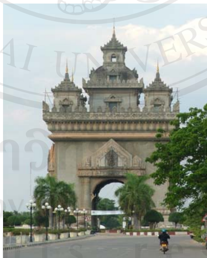
รูปที่ 3 ประตูชัย (ที่เวียงจันทน์)

ประตูดัช หรือชื่อเดิมเรียกว่า อนุสาวรีย์ทหารผ่านศึก ที่ปัจจุบันกลายเป็นสัญลักษณ์สำคัญอีกอย่างหนึ่งของเวียงจันทน์ ก่อสร้างในปี พ.ศ.2500 สังเกตได้ว่าในปีดังกล่าวรัฐบาลราชอาณาจักรลาว ก่อสร้างอนุสาวรีย์หลายแห่ง แกมมุมหนึ่งคือเพื่อสร้างความทันสมัยให้กับเมืองเวียงจันทน์ เช่นเดียวกับเมืองอื่นๆในยุโรป จุดประสงค์ในการก่อสร้างอนุสาวรีย์ทหารผ่านศึก คือ เพื่อระลึกถึงนักรบฝ่ายรัฐบาลราชอาณาจักรที่เสียชีวิตในสงครามระหว่างฝ่ายรัฐบาลกับฝ่าย “ขบวนการปะเทดลาว” รัฐบาลในระบอบใหม่พยายามนิยามความหมายใหม่ให้กับ อนุสาวรีย์ทหารผ่านศึก โดยในปี พ.ศ. 2538 รัฐมนตรีว่าการกระทรวงแถลงข่าวและวัฒนธรรมได้ประกาศว่า อนุสาวรีย์ทหารผ่านศึกเป็นมรดกของชาติ คือ สัญลักษณ์ของชัยชนะเรียกว่า ประตูชัย เนื่องจากในวันที่ 23 สิงหาคม พ.ศ. 2518 ประชาชนลาวได้ใช้เป็นสถานที่ชุมนุมประท้วงรัฐบาลราชอาณาจักร (ปณิตา สระวาสี, 2546: 76-78) นับเป็นการนิยาม “ชาติลาว” ที่เน้นความสำคัญของประชาชนต่อชาติลาวในระบอบใหม่