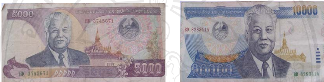
รูปที่ 11 ธนบัตรลาวสมัยสังคมนิยม

จากปรากฏการณ์ต่างๆในข้างต้น ทำให้เห็นถึงความเปลี่ยนแปลงของสำนึกความเป็นชาติลาว ซึ่งแรกเริ่มฝรั่งเศสเป็นผู้วางรากฐานการสร้างสำนึกความเป็นชาติให้กับลาว ทำให้ลาวมีอัตลักษณ์ที่แตกต่างจากไทย และชื่นชมในฝรั่งเศส ในสมัยพระราชอาณาจักรลาวนั้น สำนึกความเป็นชาติลาวเน้นที่ สถาบัน ชาติ ศาสนา พระมหากษัตริย์ ดังจะเห็นได้จาก การเขียนประวัติศาสตร์แบบเรียน ธงชาติ เพลงชาติ ธนบัตร ฯลฯ ทุกสิ่งที่สร้างขึ้นนั้น เป็นไปเพื่อสร้างความชอบธรรมให้ ชาติ ศาสน์ กษัตริย์ สิ่งที่เปรียบเสมือนศูนย์รวมจิตใจของคนลาวทั้งประเทศ ซึ่งเป็นการทำให้ประชาชนลาวระลึกอยู่เสมอว่า ถ้าเป็นคนลาวและรักในชาติลาว ต้องมีความรักในสถาบันหลักทั้ง 3 นี้ด้วยเช่นกัน แต่เมื่อลาวเปลี่ยนระบอบการปกครองเป็นสังคมนิยม เมื่อปีพ.ศ. 2518 รัฐบาลลาวก็นิยามสำนึกความเป็นชาติลาวขึ้นมาใหม่ ว่าชาติลาวก็คือพรรคประชาชนปฏิวัติลาว ประเทศลาวมีเอกราชอย่างแท้จริงได้ก็เพราะการต่อสู้ ความกล้าหาญของพรรคฯ ประชาชนลาวควรรู้และสำนึกบุญคุณของพรรคฯ ถ้ารักชาติลาวก็ต้องรักพรรคฯ ซึ่งการนิยามดังกล่าวเป็นไปเพราะต้องการให้พรรคฯมีความชอบธรรมในการปกครองประเทศ ปัจจุบันรัฐบาลลาวก็ยังคงมีแนวคิดการสร้างสำนึกความเป็นชาติที่เน้นความสำคัญของพรรคฯอย่างต่อเนื่อง นอกจากนี้ยังเน้นชาติลาวที่ประกอบด้วยชนเผ่าต่างๆซึ่งล้วนแต่ถือว่าเป็นลาวและมีความเสมอภาคกัน