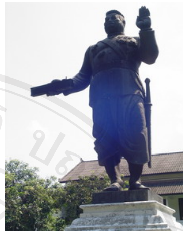
รูปที่ 7 อนุสาวรีย์เจ้ามหาชีวิตศรีสว่างวงศ์

จะเห็นได้ชัดเจนว่าพิพิธภัณฑ์ในเมืองเวียงจันทน์นั้นถูกสร้างขึ้นเพื่อสร้างความชอบธรรมให้กับพรรคประชาชนปฏิวัติลาว ให้ประชาชนลาวเห็นถึงความกล้าหาญ เสียสละ ที่พรรคฯทำเพื่อประเทศชาติ และให้ประชาชนสำนึกในบุญคุณของพรรค แต่พิพิธภัณฑ์เจ้ามหาชีวิตที่เมืองหลวงพระบางนั้น ยังคงมีจุดเน้นไปที่พระมหากษัตริย์และศาสนาพุทธ พิพิธภัณฑ์แห่งนี้เรียกย่อว่า หอหลวง สร้างขึ้นในสมัยของเจ้ามหาชีวิตศรีสว่างวงศ์ ประมาณปี พ.ศ.2447 และสืบทอดมายังเจ้ามหาชีวิตศรีสว่างวัฒนา รูปแบบอาคารเป็นสถาปัตยกรรมแบบฝรั่งเศสผสมกับลาว ด้านนอกอาคารเป็นที่ตั้งของอนุสาวรีย์เจ้ามหาชีวิตศรีสว่างวงศ์ ด้านหลังของอนุสาวรีย์จะเป็นโรงละคร พระราชวังนี้ถูกเปลี่ยนเป็นพิพิธภัณฑ์เมื่อประเทศลาวเปลี่ยนแปลงระบอบการปกครอง ในปี พ.ศ.2518 ภายในพิพิธภัณฑ์ มีการจัดแสดงของใช้ต่างๆของเจ้ามหาชีวิต เช่น พระแสงของ้าว มงกุฎ กระบี่ รวมไปถึงตำหนักที่เคยประทับ ห้องบรรทม ห้องเสวย ฯลฯ และบนฝาผนังจะมีภาพจิตรกรรมเกี่ยวกับวิถีชีวิตชาวลาว งานประเพณีต่างๆ และพิพิธภัณฑ์แห่งนี้ยังเป็นที่ประดิษฐานพระบาง พระคู่บ้านคู่เมืองชาวลาวด้วยเช่นกัน ซึ่งสะท้อนให้เห็นว่าการจัดแสดงของพิพิธภัณฑ์เจ้ามหาชีวิตนั้นคู่สวนทางกับอุดมการณ์ของพรรคฯ เพราะการจัดแสดงจะเน้นไปที่เจ้ามหาชีวิตและพระพุทธศาสนา ซึ่งเป็นไปได้ว่ารัฐบาลลาวเล็งเห็นว่าหลวงพระบางเป็นเมืองที่เต็มไปด้วยประเพณีและวัฒนธรรม มีความเกี่ยวข้องกับระบอบกษัตริย์มายาวนาน เป็นศูนย์กลางของการปกครองโดยเจ้ามหาชีวิต และ UNESCO ได้ประกาศให้เป็นมรดกโลก เมื่อปี พ.ศ.2537 รัฐบาลลาวจึงใช้จุดเด่นดังกล่าวของหลวงพระบางเพื่อการท่องเที่ยว