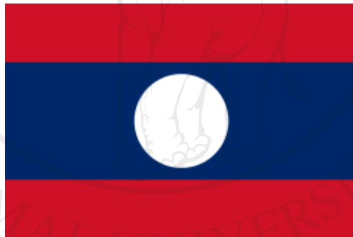
รูปที่ 2 ธงดวงเดือน

ประเทศลาวเป็นเอกราชจากฝรั่งเศสและประกาศจัดตั้งรัฐบาลลาวอิสระ โดยใช้ธงนี้เป็นสัญลักษณ์ในการเคลื่อนไหว แต่ 6 เดือนให้หลังต่อมาฝรั่งเศสก็กลับเข้ามาปกครองลาวซึ่งเป็นส่วนหนึ่งของอินโดจีนฝรั่งเศสและล้มรัฐบาลลาวอิสระลง (ได้ให้เอกราชแก่ลาวภายหลังในปี พ.ศ. 2498 ลาวจึงปกครองตนเองด้วยระบอบประชาธิปไตยอันมีพระมหากษัตริย์เป็นประมุข) ธงนี้ก็ได้ถูกนำมาใช้เป็นสัญลักษณ์ของขบวนการปะเทดลาวแทน ซึ่งขบวนการนี้จัดตั้งโดยผู้นำขบวนการลาวอิสระส่วนหนึ่งที่นิยมแนวคิดทางการเมืองฝ่ายซ้าย ภายใต้การนำของเจ้าสุภานุวงศ์ เมื่อขบวนการปะเทดลาวเคลื่อนไหวปลดปล่อยลาว ล้มล้างรัฐบาลระบอบกษัตริย์ และจัดตั้งรัฐบาลพรรคคอมมิวนิสต์ปกครองประเทศสำเร็จ ธงนี้ก็ได้รับการรับรองให้เป็นธงชาติของสาธารณรัฐประชาธิปไตยประชาชนลาวอย่างเป็นทางการในวันที่ 2 ธันวาคม พ.ศ. 2518