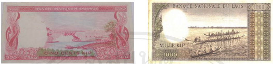
รูปที่ 10 ธนบัตรลาวสมัยพระราชอาณาจักร