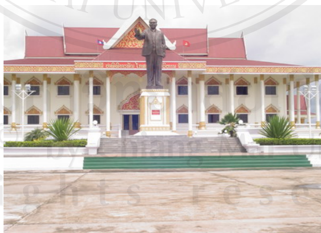
รูปที่ 5 พิพิธภัณฑ์ท่านไกสอน พมวิหาน

นอกจากนี้ยังมีพิพิธภัณฑ์ชนเผ่า ซึ่งก่อตั้งขึ้นในปี พ.ศ.2537 ภายในจัดแสดงวิถีชีวิตและกลุ่มชาติพันธุ์ที่หลากหลายในลาว แสดงให้เห็นว่ารัฐบาลลาวยังให้ความสำคัญกับชนเผ่าต่างๆ และถือว่าเป็นคนลาวเหมือนกัน เพื่อสร้างความเป็นอันหนึ่งอันเดียวกันให้กับชาติลาว