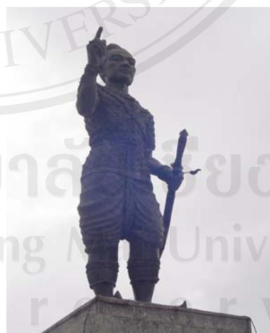
รูปที่ 4 อนุสาวรีย์เจ้าฟ้าจ๋ม