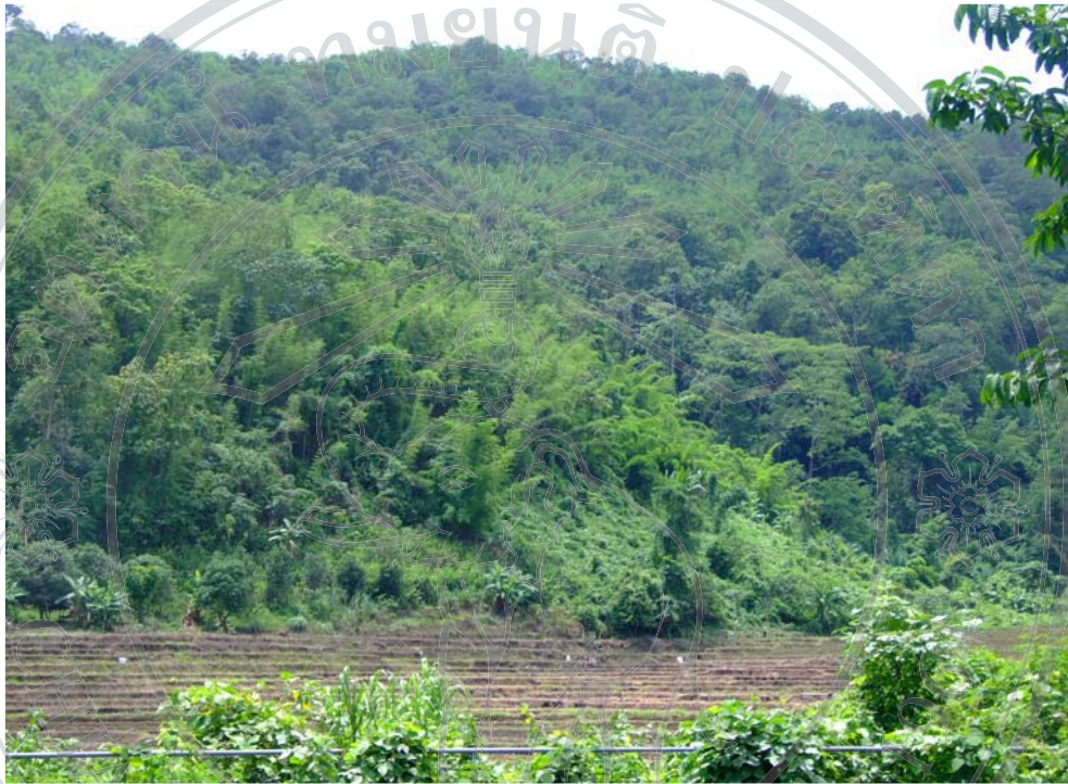
ภาพ 10 พื้นที่ป่าไม้หมู่บ้านนาปลาจาด