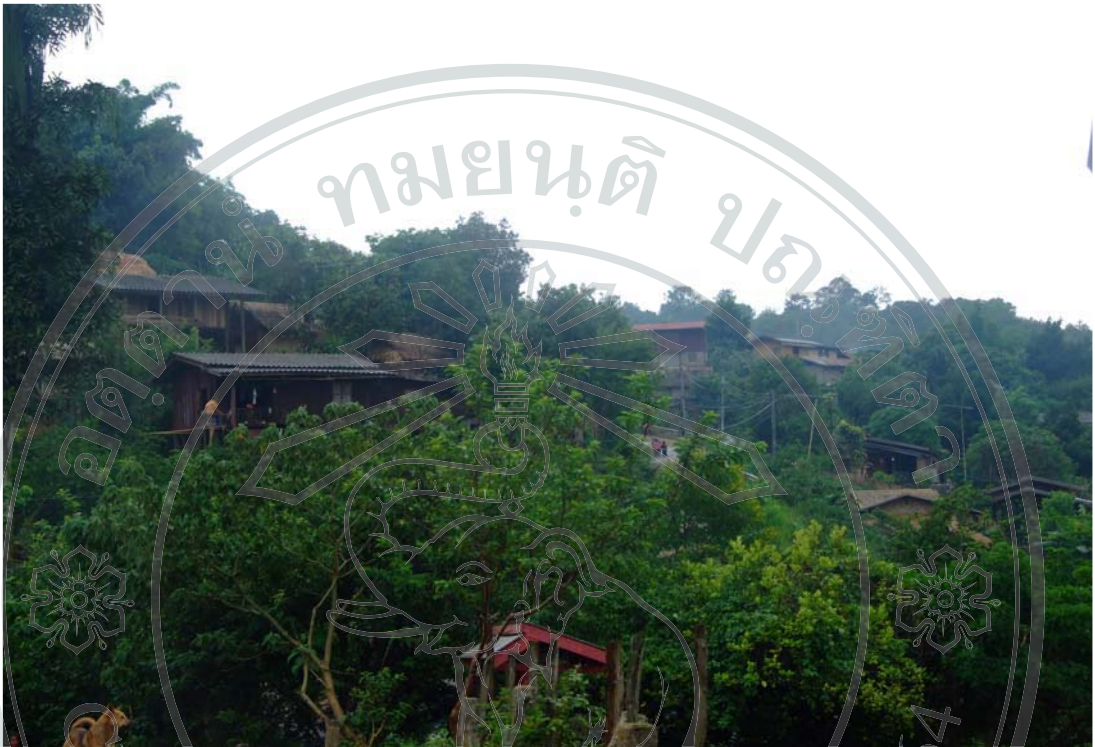
ภาพ 22 พื้นที่ป่าไม้หุ่มบ้านห้วยมะเขือส้ม