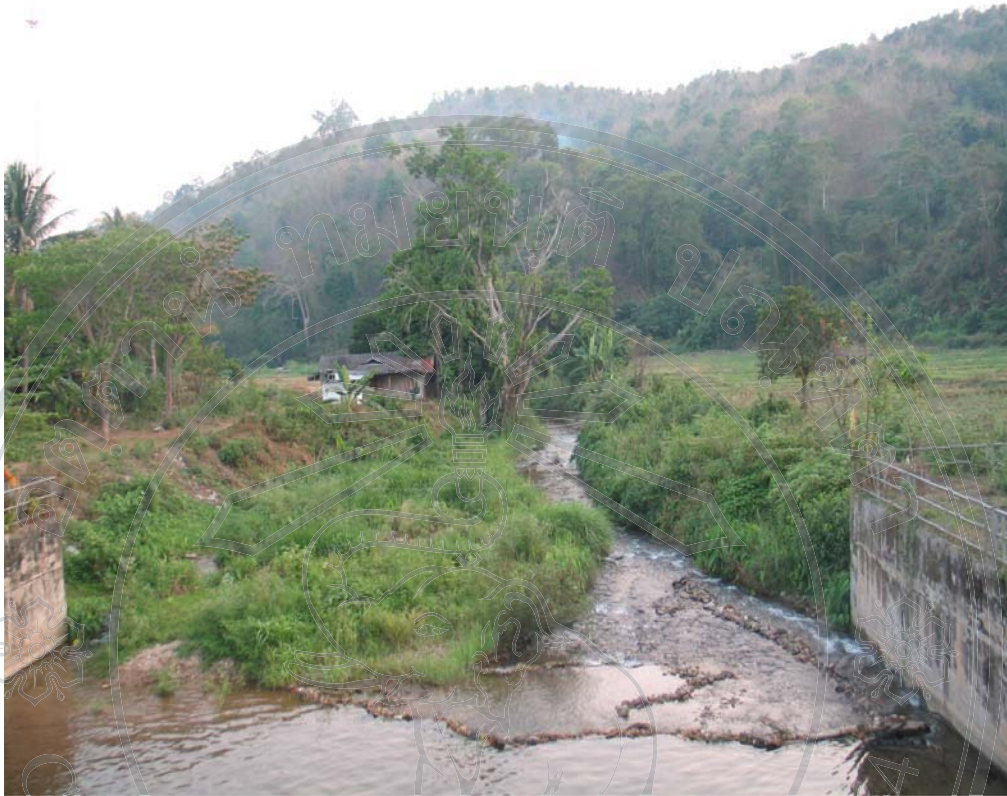
ภาพ 12 ลำน้ำที่ใช้ในการเกษตรของชาวบ้านนาปลาจาด