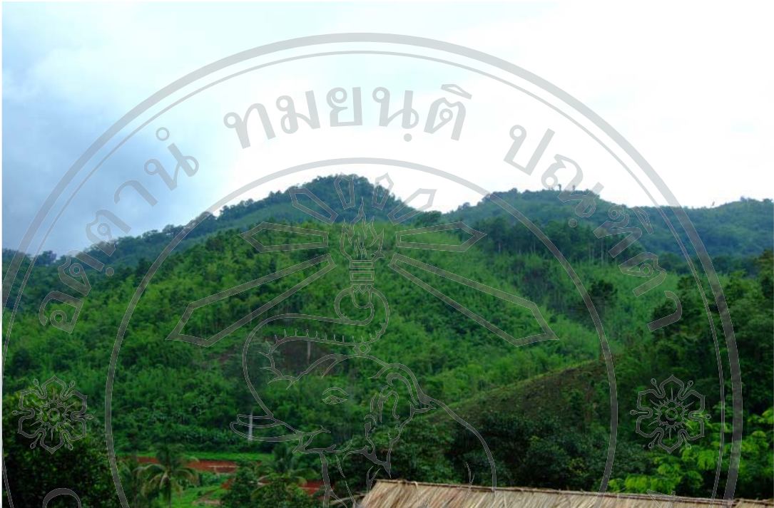
ภาพ 19 พื้นที่ป่าไม้บ้านไม้สะเป่