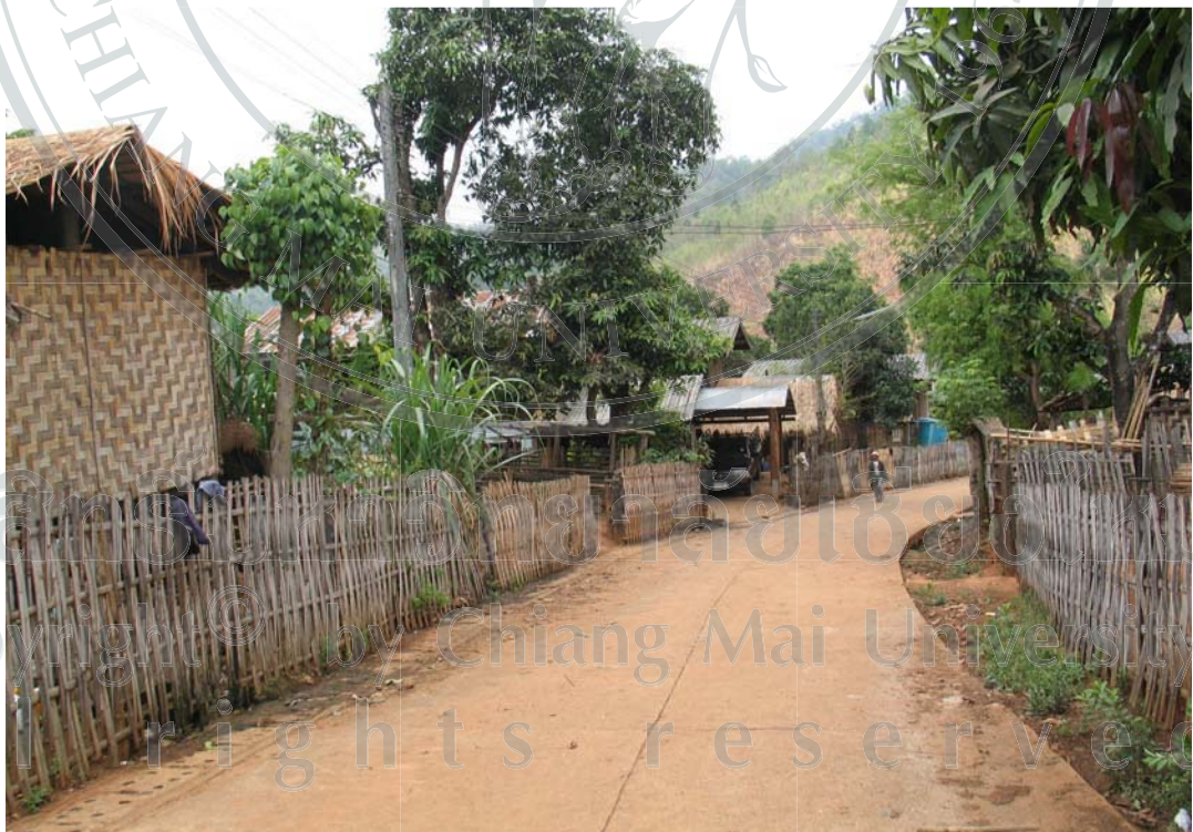
ภาพ 21 พื้นที่อยู่อาศัยบ้านไม้สะเป่