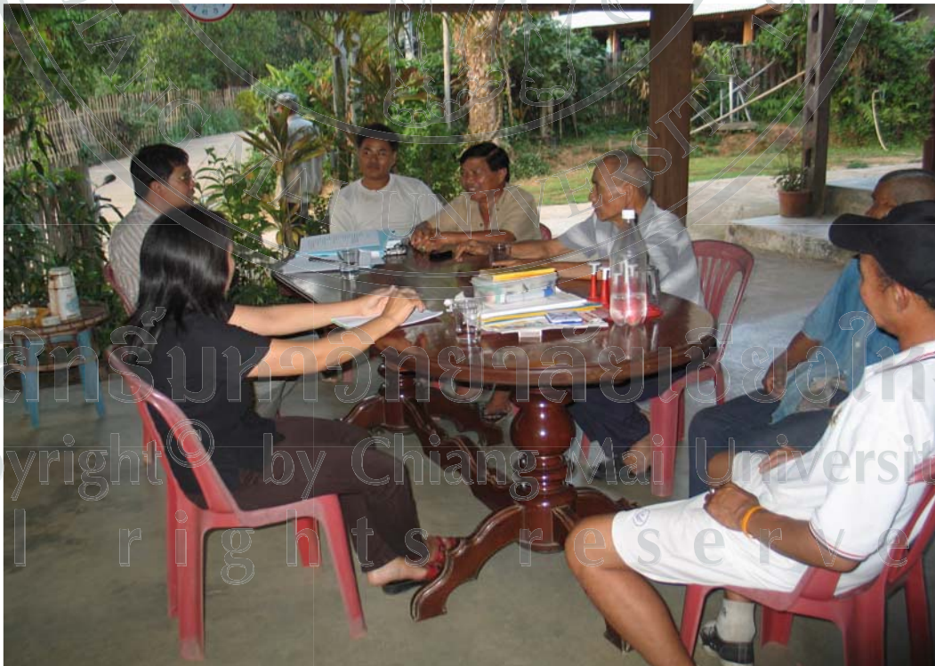
ภาพ 15 การสนทนากับผู้ใหญ่บ้านและผู้นำกลุ่มอนุรักษ์บ้านนาปลาจาด