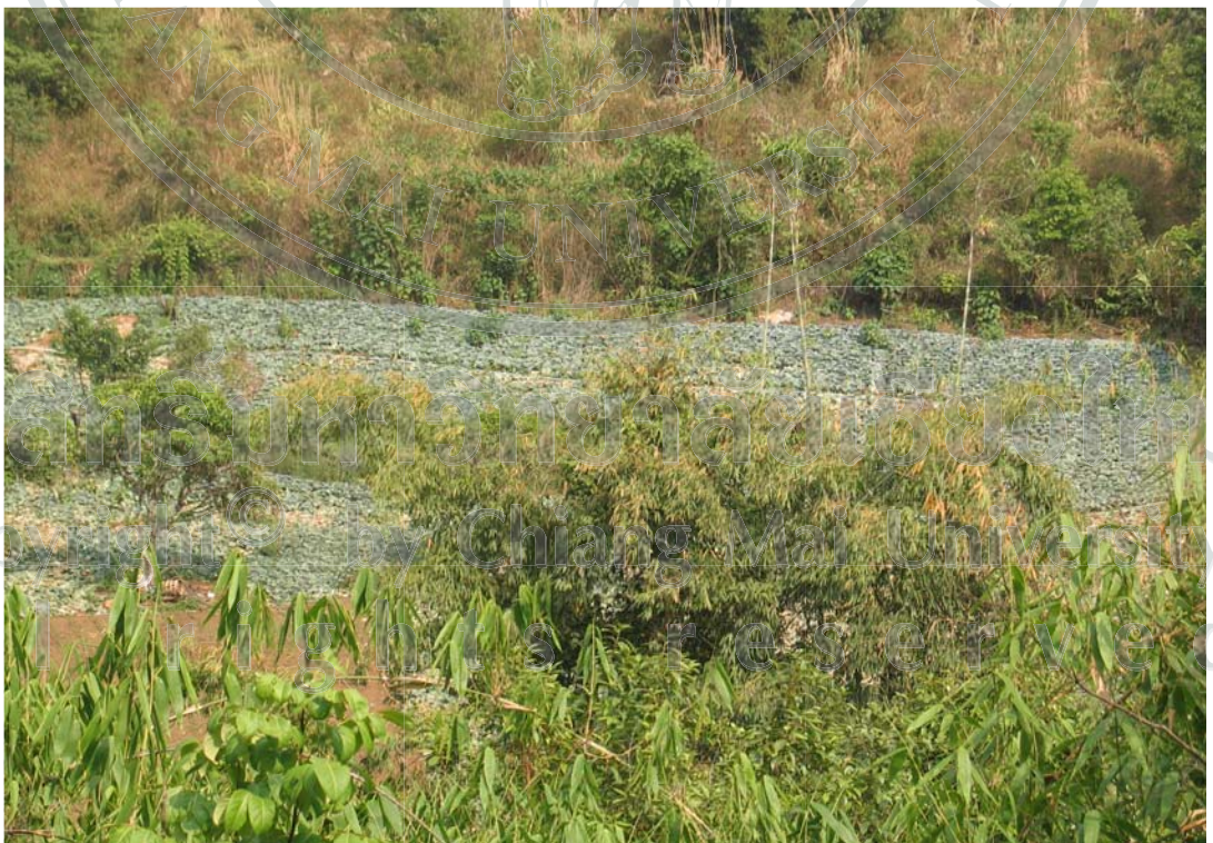
ภาพ 23 พื้นที่ทำการเกษตรหุ่มบ้านห้วยมะเขือส้ม