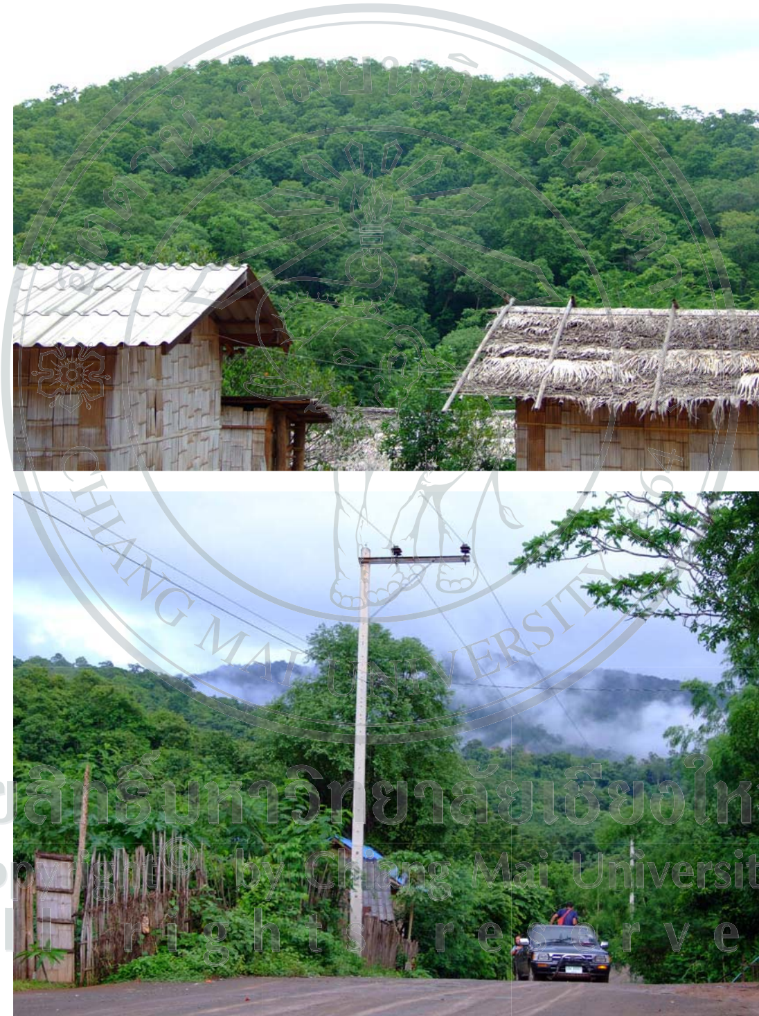
ภาพ 16 พื้นที่ป่าไม้ของหมู่บ้านไม้ซางหนาม