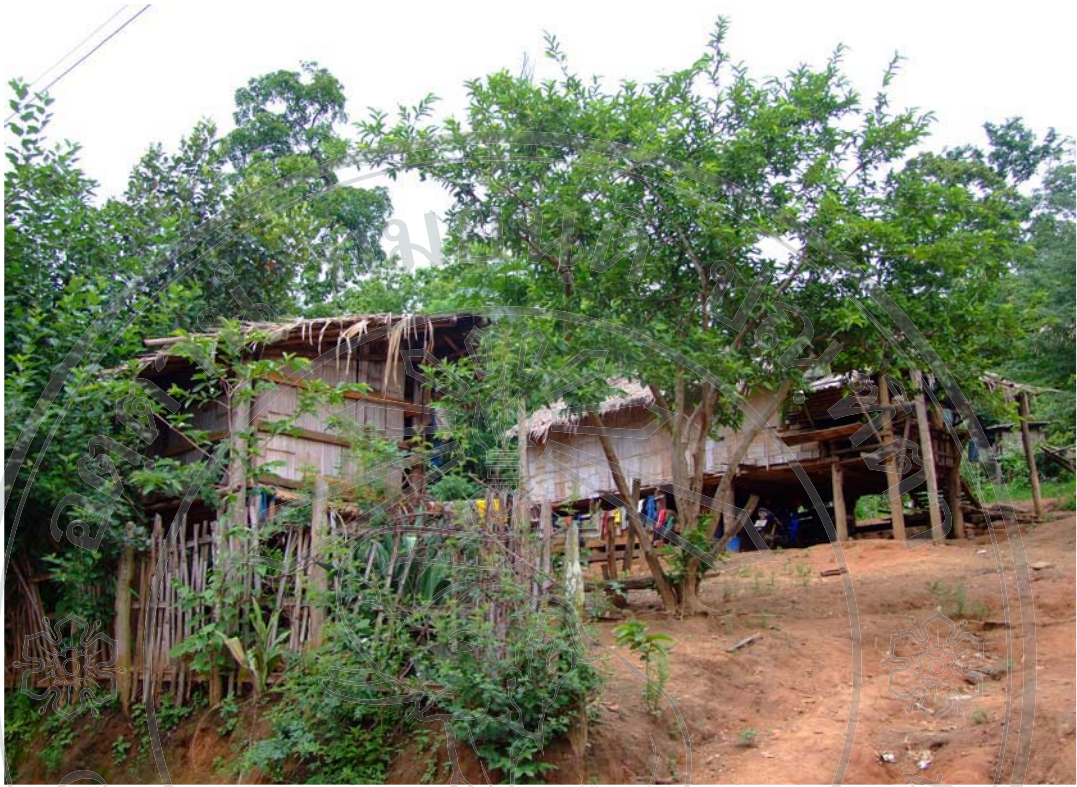
ภาพ 17 พื้นที่อยู่อาศัยบ้านไม้ข้างนาม