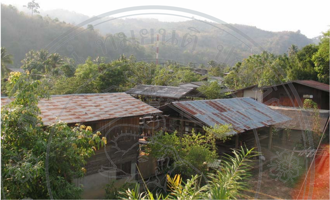
ภาพ 14 พื้นที่อยู่อาศัยของชาวบ้านนาปลาจาด