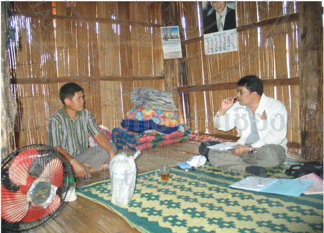
ภาพ 18 การสนทนาผู้ช่วยผู้ใหญ่บ้านไม้ข้างนาม