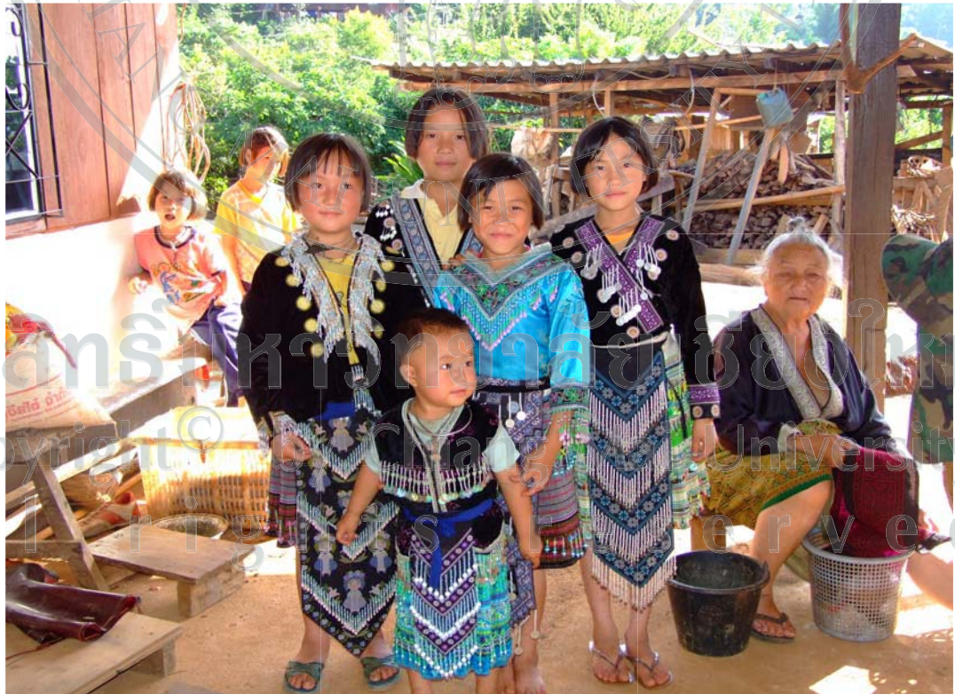
ภาพ 25 ชุดแต่งกายประจำเผ่าม้ง