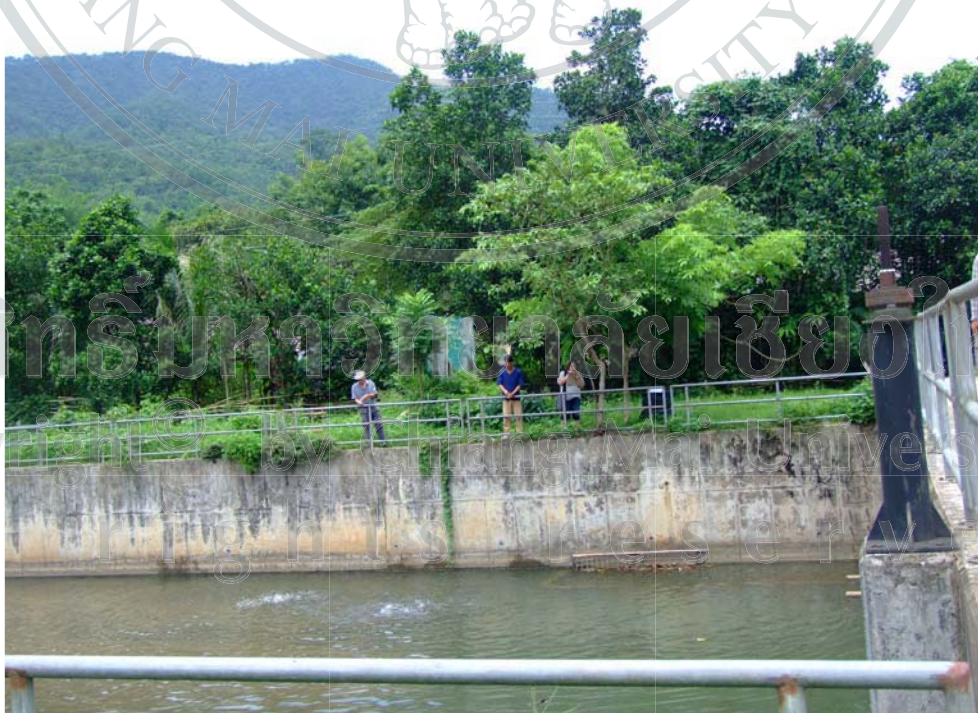
ภาพ 13 พื้นที่อนุรักษ์พันธุ์ปลาของชาวบ้านนาปลาจาด