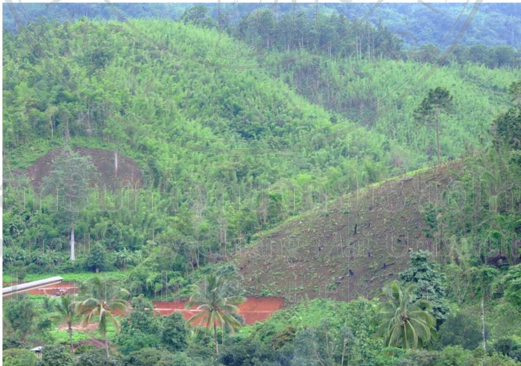
ภาพ 20 พื้นที่ทางการเกษตรของหมู่บ้านไม้สะเป่