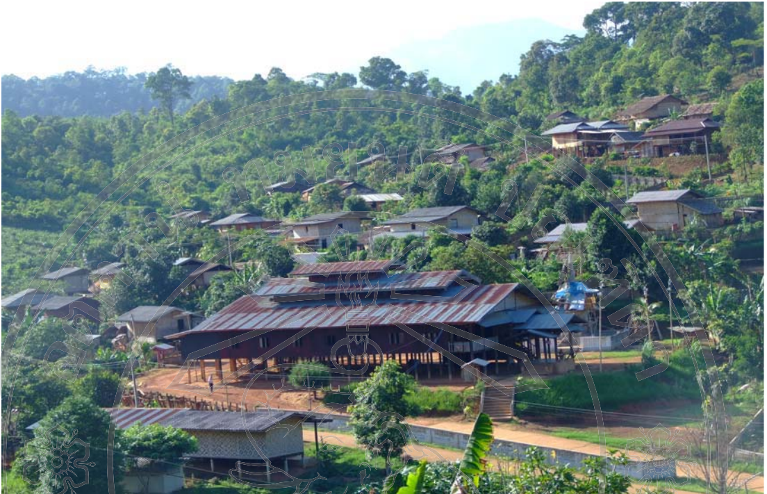
ภาพ 24 พื้นที่อยู่อาศัยบ้านห้วยมะเจือส้ม