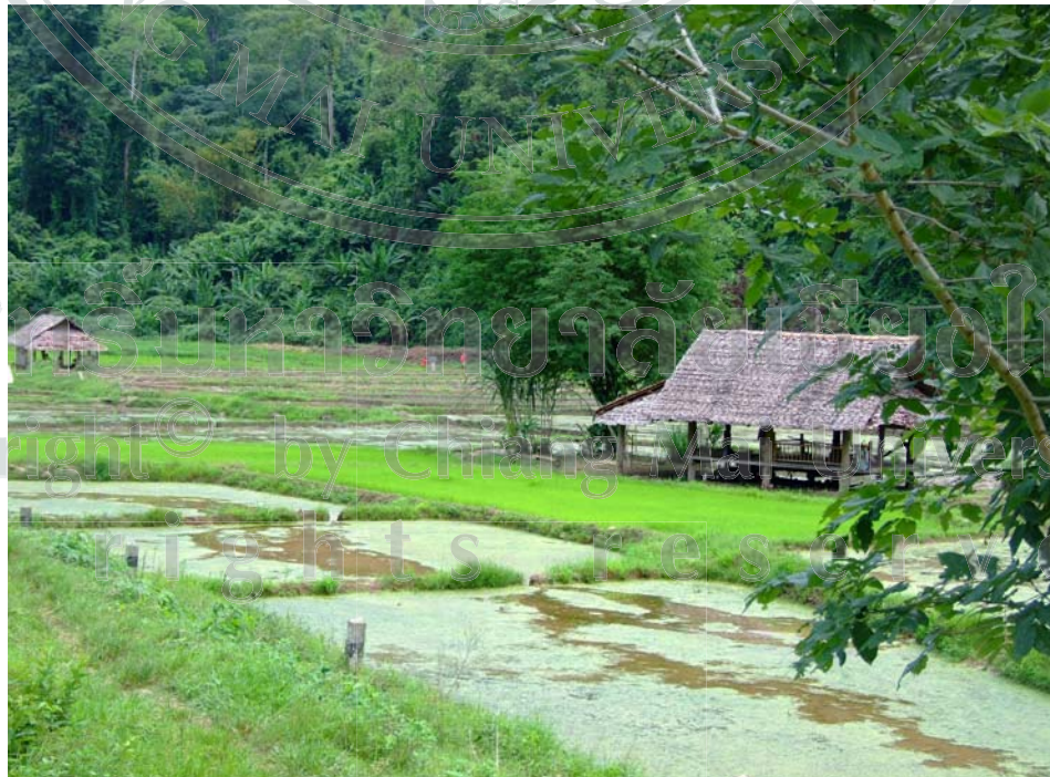
ภาพ 11 พื้นที่ทำการเกษตรของชาวบ้านนาปลาจาด

ลิขสิทธิ์ © รับทศวรรษ ๒๕๖๓ Copyright © by Chiang Mai University All rights reserved