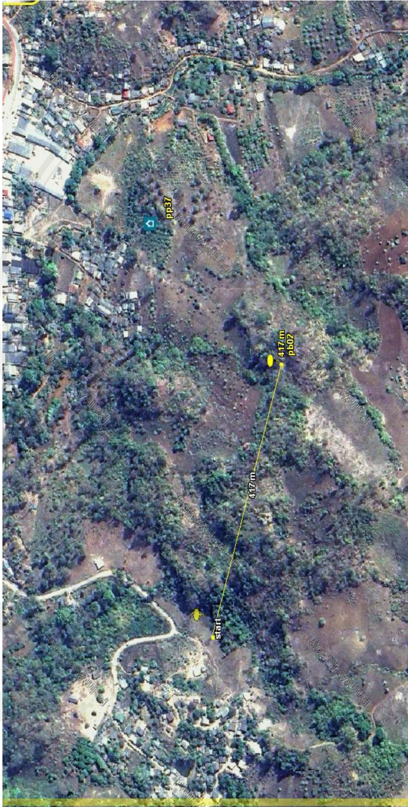
ภาพ 3 แสดงระยะห่างจากหมู่บ้านถึงเสาเดียว PB02 ในพื้นที่หมู่บ้านหนองตอง