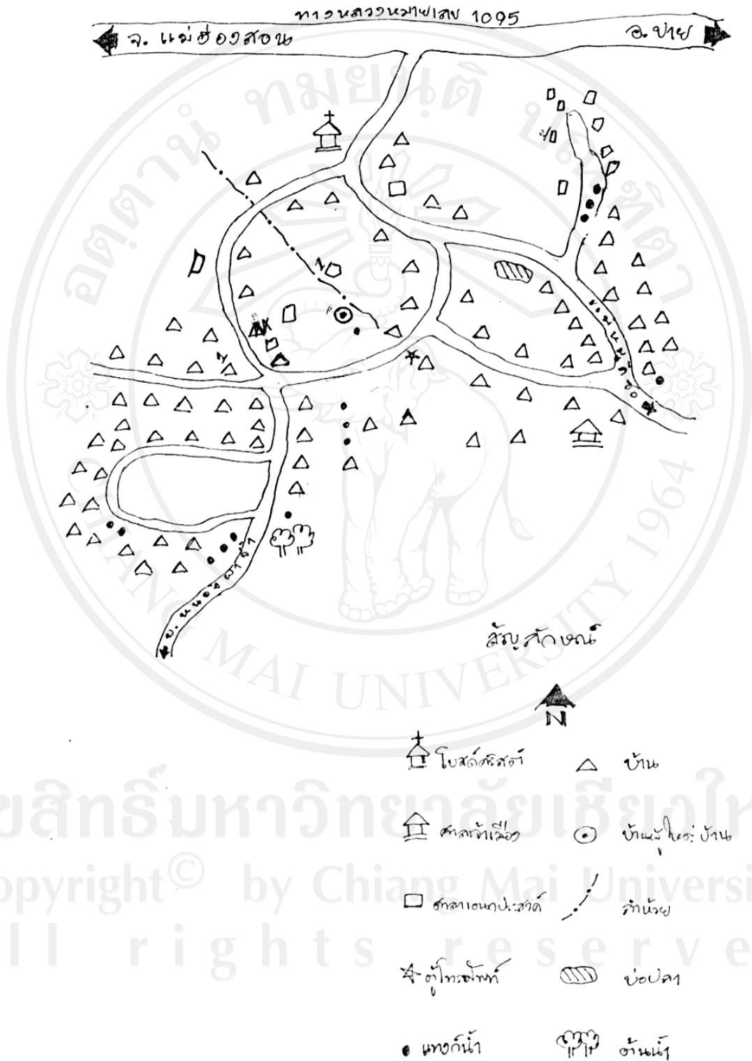
ภาพ 1 แสดงแผนผังที่ตั้งหมู่บ้านหนองตอง