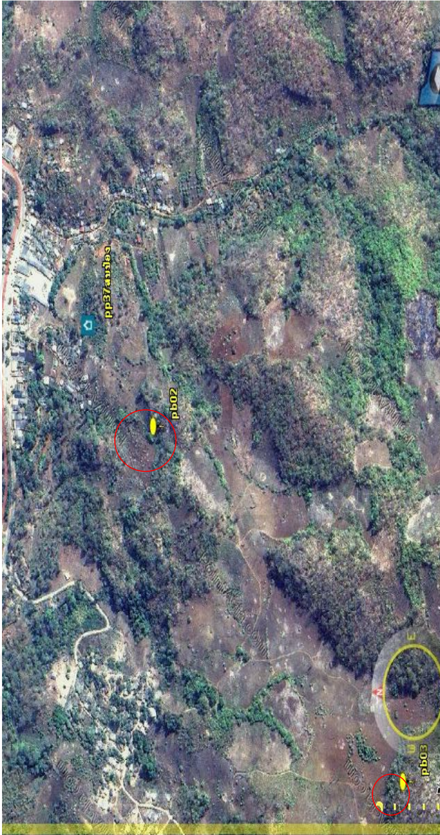
ภาพ 4 แสดงบริเวณจุดตัดงูเตา PB02 และ PB03 ในพื้นที่บ้านหนองตอง

ลิขสิทธิ์ Copyright All Rights Reserved มหาวิทยาลัยบูรพา Burihan University