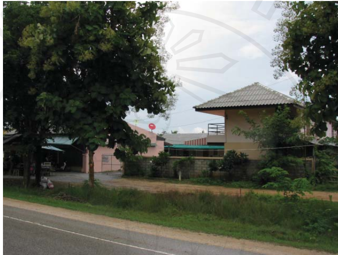
ภาพ 4.4 รูปภาพหอพักที่ถูกสร้างขึ้นในหมู่บ้าน

ชุมชนเดิมที่มีโอกาสแต่งงานกับชาวต่างชาติ และกลับมาปลูกบ้านพักใหม่ ก็นับได้ว่าไม่อยู่ในหลักเกณฑ์การขอทำประโยชน์ในพื้นที่สำหรับชาวบ้านผู้ที่มีฐานะยากจน จึงทำให้ฝ่ายภาครัฐ ซึ่งได้แก่ เจ้าหน้าที่ป่าไม้ ไม่สามารถที่จะ โอนอ่อนผ่อนตามกับข้อเรียกร้องร้องขอของชาวบ้านได้นั่นเอง