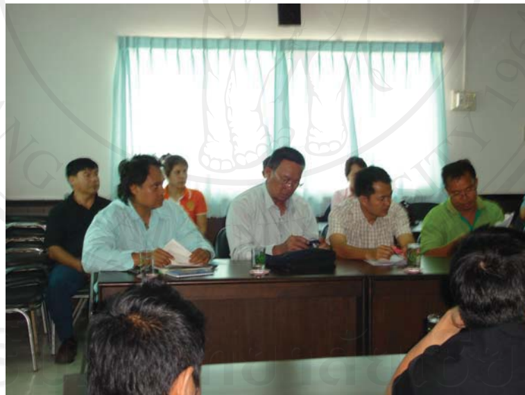
ภาพ 4.7 ผู้วิจัยเข้าไปสังเกตการณ์ ในการประชุม