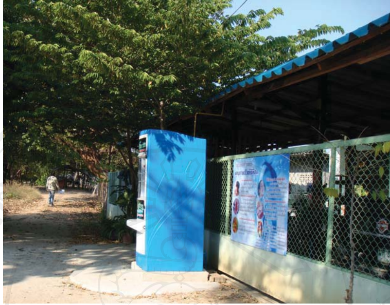
ภาพ 4.11 ตู้หยอดน้ำดื่มแบบหยอดเหรียญเพื่อบริการแก่นักศึกษาในหอพัก