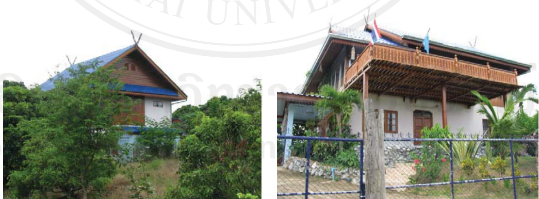
ภาพ 4.5 บ้านที่ปลูกสร้างในหมู่บ้านซึ่งลักษณะแตกต่างจากบ้านหลังอื่น