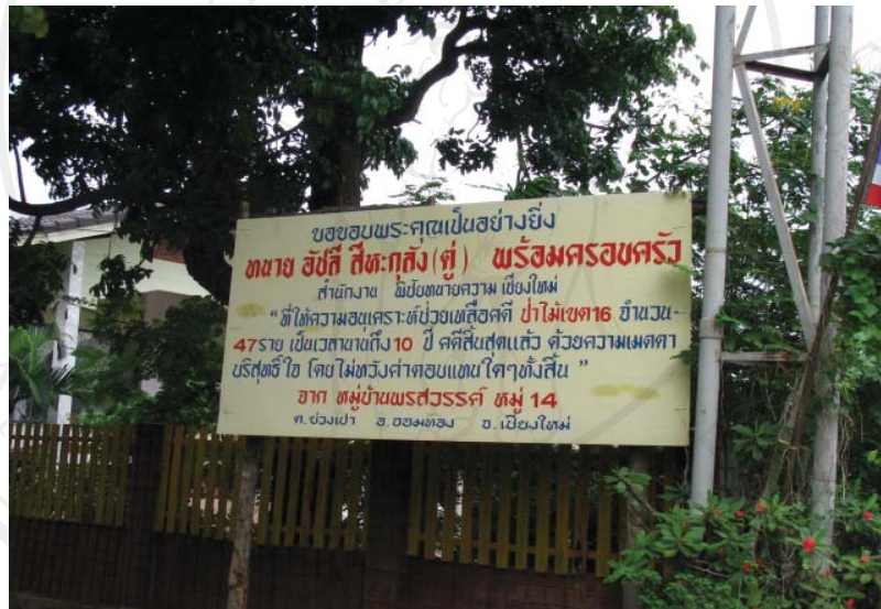
ภาพ 4.8 ป้ายขอบคุณนายความที่ช่วยเหลือเรื่องคดีของชาวบ้าน

จังหวัดเชียงใหม่ได้ช่วยเหลือชาวบ้านจำนวน 47 รายที่ถูกฟ้องร้องดำเนินคดี เป็นการต่อสู้ที่ยาวนานกว่าสิบปี และไม่มีค่าจ้างตอบแทนใดๆ รวมทั้งมือคิด ส.ส.ของจังหวัดเชียงใหม่ที่อาสาเข้ามาเป็นตัวแทนไกล่เกลี่ยปัญหาระหว่างชาวบ้านกับเจ้าหน้าที่รัฐ จะเห็นได้ว่ามีกลุ่มการเมืองจากภายนอกที่เข้ามาช่วยเหลือชาวบ้านในการต่อสู้กับภาครัฐทำให้เจ้าหน้าที่รัฐไม่สามารถดำเนินการทางกฎหมายได้อย่างเต็มที่ อีกทั้งยังทำให้ชาวบ้านสามารถที่จะปฏิเสธคำสั่งต่างๆ ของทางเจ้าหน้าที่ และคำสั่งของศาลที่สั่งบังคับคดีอีกด้วย นอกจากนี้ผู้วิจัยยังพบที่ปัจจุบันชาวบ้านพรสวรรค์มีจำนวนทั้งสิ้น 62 ครัวเรือน นั้น เกิดขึ้นจากการขยายตัวของกลุ่มบุคคลที่เข้ามาในช่วงระยะเวลาที่เกิดความขัดแย้งของทั้งฝ่าย เพื่อให้ได้มาเพื่อผลประโยชน์ โดยอาศัยชาวบ้านเดิม จำนวน 47 ครัวเรือนที่ถูกดำเนินคดีเป็นเครื่องมือ ในการต่อสู้กับภาครัฐ