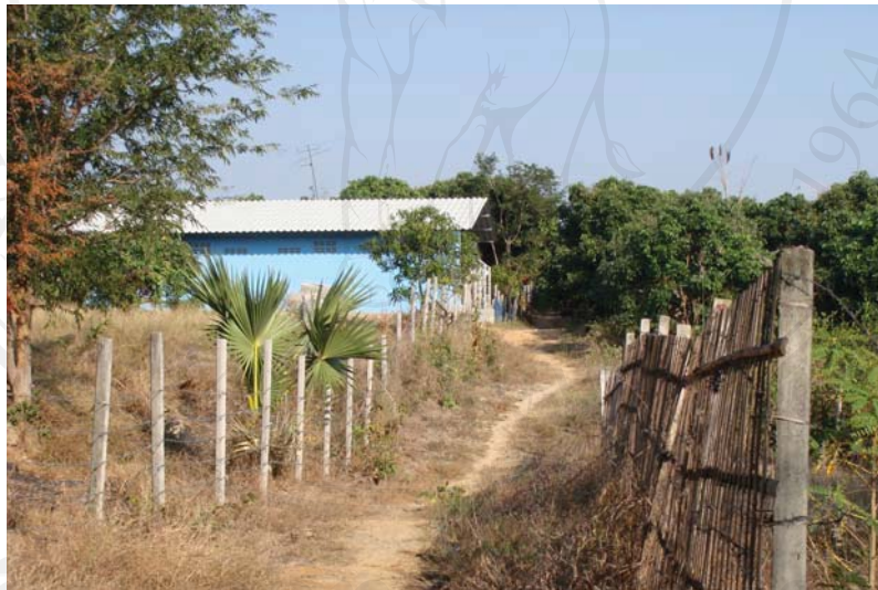
ภาพ 4.10 หอพักอีกแห่งหนึ่งในหมู่บ้านสำหรับให้บริการแก่นักศึกษา