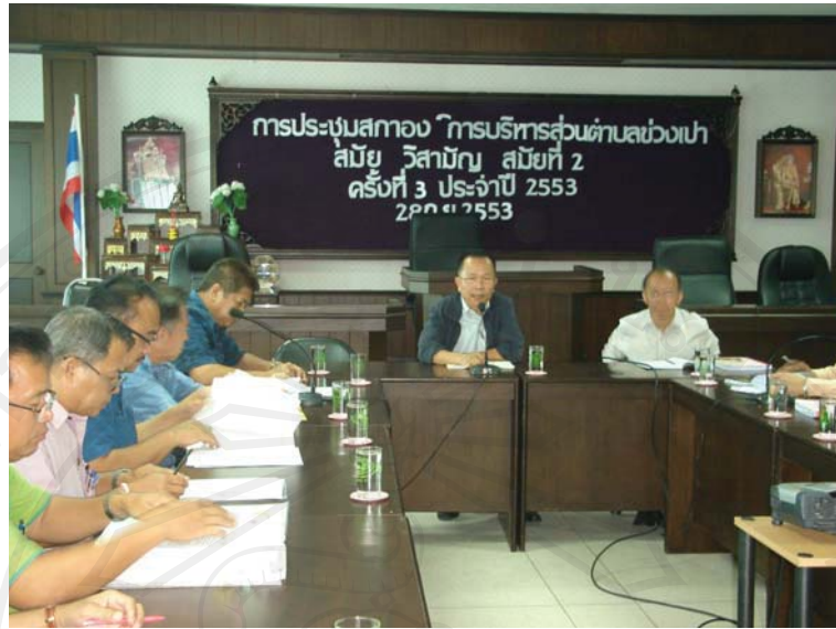
ภาพ 4.6 การประชุมเพื่อหาทางออกครั้งล่าสุด