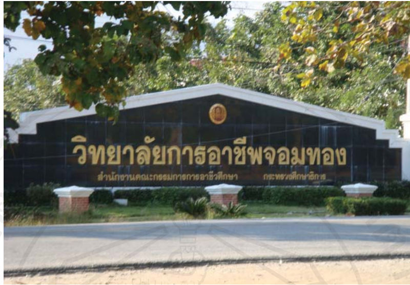
ภาพ 4.9 วิทยาลัยการอาชีพจอมทองตั้งอยู่ตรงข้ามกับบ้านพรสวรรค์