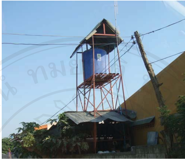
ภาพ 4.3 แท็งค์น้ำที่ชาวบ้านช่วยกันสร้างเพื่อเก็บน้ำไว้ใช้