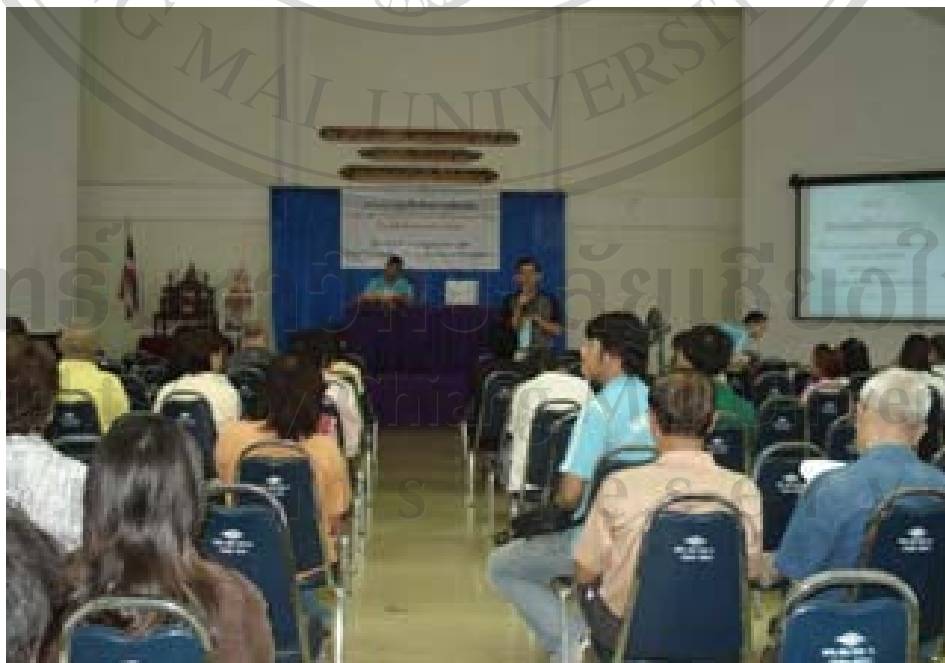
ภาพ 5 การประชุมรับฟังความคิดเห็นร่างเทศบัญญัติ