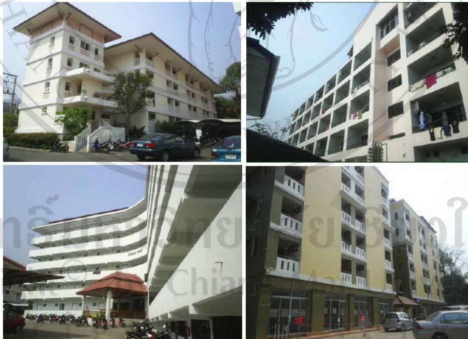
ภาพ 9 สภาพปัญหาอาคารสูงชุมชนซอยวัดคูโมงค์