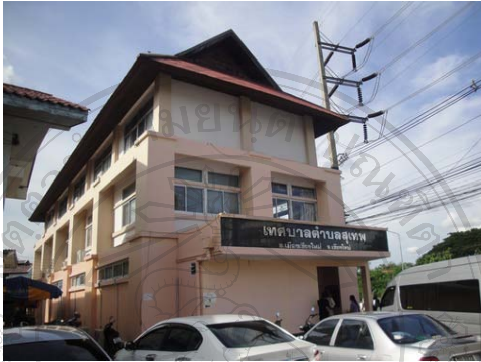
ภาพ 6 เทศบาลตำบลสุเทพ