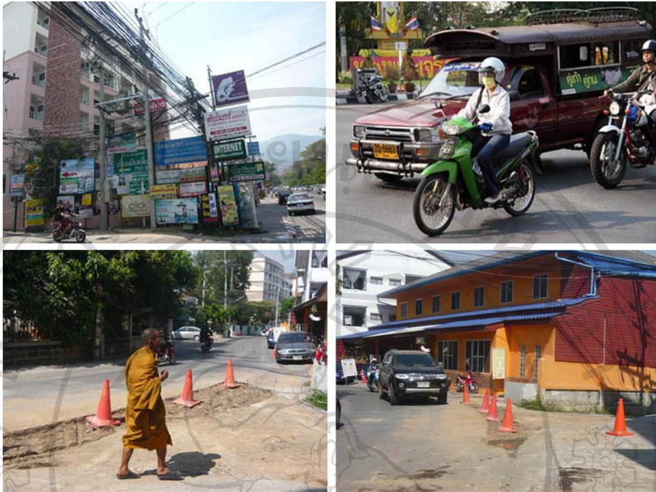
ภาพ 10 สภาพปัญหาอาคารสูงชุมชนซอยวัดคูโมงค์