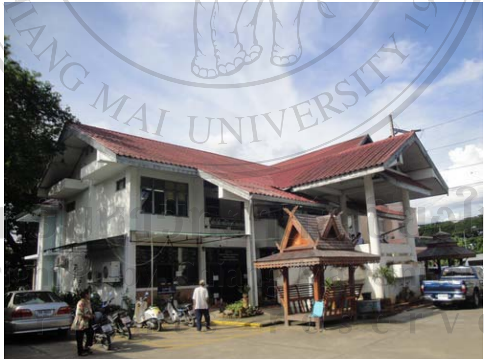
ภาพ 7 สถานีอนามัยเทศบาลตำบลสุเทพ