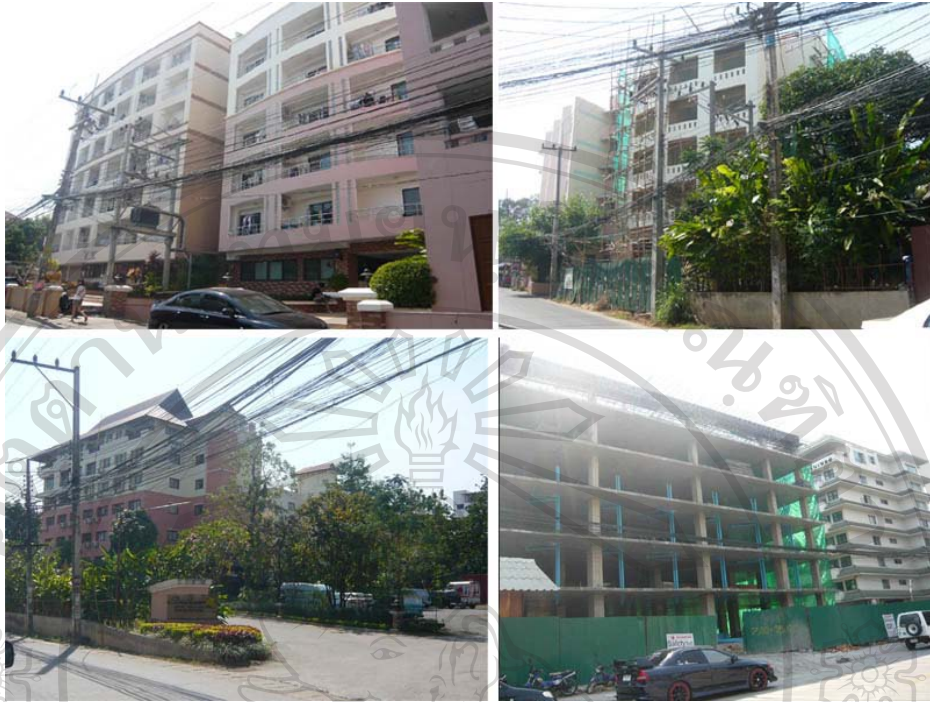
ภาพ 8 สภาพปัญหาอาคารสูงชุมชนซอยวัดคูโมงค์