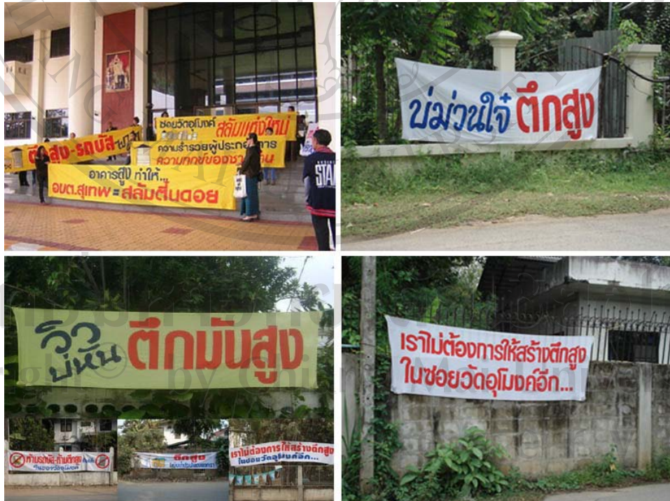
ภาพ 11 สภาพปัญหาอาคารสูงชุมชนซอยวัดคูโมงค์