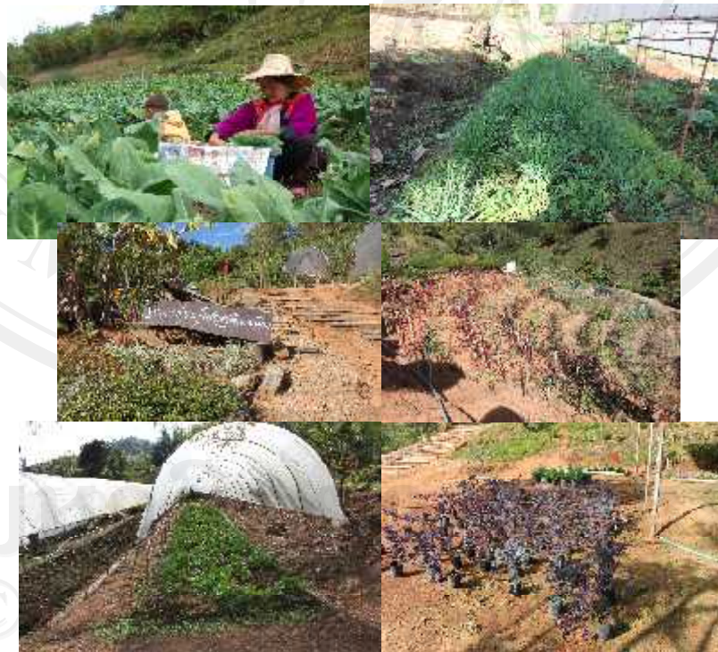
ภาพ 4.5 ภาพกิจกรรมแปลงสาธิตการปลูกผัก ไม้ดอก และ ไม้ผล

กิจกรรมแปลงสาธิตการปลูกผัก ไม้ดอก และ ไม้ผลทุกประเภท จะมีเจ้าหน้าที่ที่คอยดูแล ให้คำแนะนำแก่นักท่องเที่ยวที่มาท่องเที่ยว เช่นกัน โดยกิจกรรมการสาธิตทุกอย่าง ในด้านการเรียนรู้ นักท่องเที่ยวที่ต้องการเรียนรู้สามารถสอบถามทั้งชื่อ ชนิดของผัก ไม้ดอก ไม้ผล และวิธีการเพาะชำปลูก ได้จากเจ้าหน้าที่ คือนายอาเบ แสนอย่าง ได้ทุกอย่าง