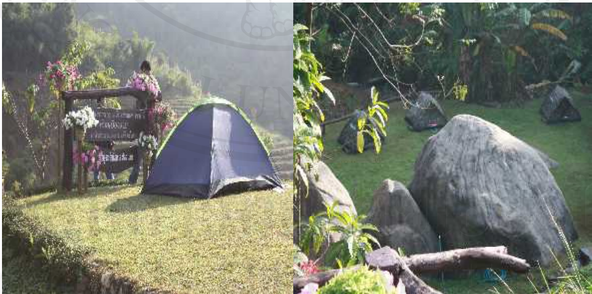
ภาพ 4.9 ลานกางเต็นท์