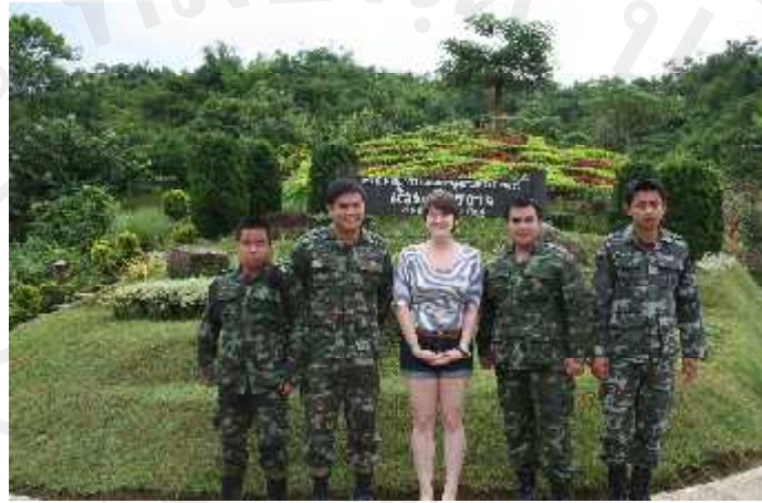
ภาพ 4.6 ทหารชุดคุ้มครองความปลอดภัย

ผลัดเปลี่ยนเวรกันทำงานปีละคณะ หรือ 12 เดือน/ครั้ง โดยจะเปลี่ยนเวรชุดใหม่ขึ้นไปปฏิบัติงานแทน