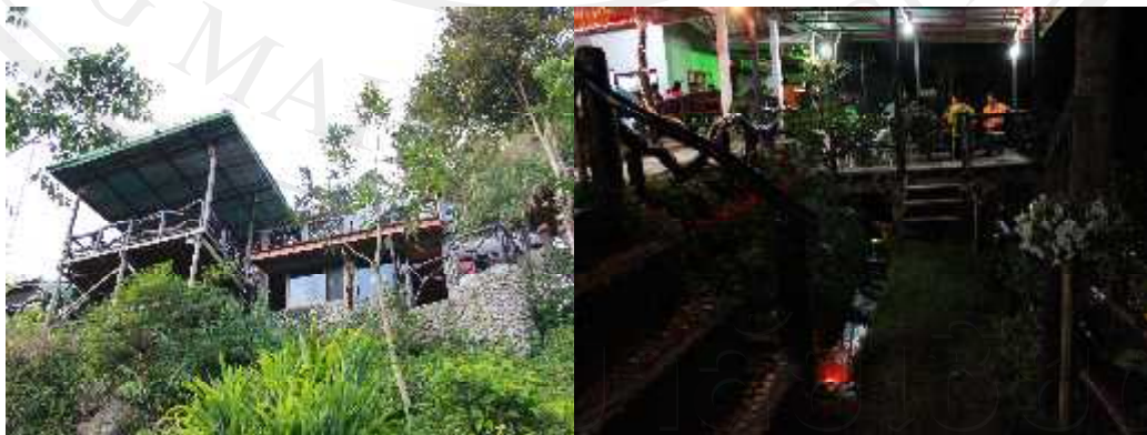
ภาพ 4.8 บ้านพักรับรองนักท่องเที่ยว

หลังที่ 5 ตั้งอยู่ติดกับหลังที่ 4 (บ้านหลังที่ 4,5 เป็นบ้าน A เฟม ส่วนใหญ่จะให้แขก VIP จะมีเฟอร์นิเจอร์ เครื่องอำนวยความสะดวก เช่น เครื่องทำน้ำอุ่น ฝักบัว โต๊ะเครื่องแป้ง เตียง และหน้าบ้านจะมีลานกางเต็นท์ ได้ประมาณ 3 เต็นท์ใหญ่