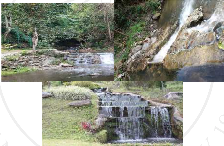
ภาพ 4.3 น้ำตกและฝายกั้นน้ำ

อีกส่วนหนึ่ง น้ำตกจากฝายกั้นน้ำที่เป็นน้ำตกตามธรรมชาติ โดยไม่ได้จัดสร้างขึ้น แต่เป็นน้ำตกที่เกิดจากฝายกั้นน้ำสำหรับเก็บไว้ใช้ในพื้นที่โครงการฯ ตลอดทั้งปี ทำให้เกิดความเป็นชั้นของน้ำตกที่สวยงามตามธรรมชาติ และมีน้ำไหลตลอดปี