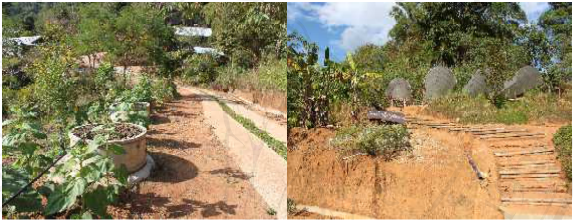
ภาพ 4.4 เส้นทางเดินป่า

กิจกรรมการเดินป่า โครงการฯจะมีเจ้าหน้าที่ คือ นายวรสันต์ พรหมวัน และนายทรงเกียรติ พรหมเมือง ซึ่งเป็นพนักงาน โครงการฯ ที่คอยแนะนำเรื่องของการเดินป่า เส้นทางเดินป่า ระยะเวลาการเดินป่าและสิ่งที่จะต้องเตรียมไปสำหรับการเดินป่า นอกจากนั้นเจ้าหน้าที่หรือพนักงานดังกล่าวจะบริการสำหรับนักท่องเที่ยวที่ต้องการให้พาไปเดินป่า โดยในส่วนของเส้นทางเดินป่าในพื้นที่โครงการฯ มี 2 เส้นทาง แต่ละเส้นทางใช้เวลาเดินทาง ประมาณ 3-4 ชั่วโมง