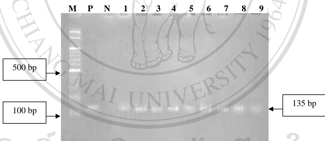
ภาพ 1 แสดงแถบดีเอ็นเอขนาดตำแหน่ง 135 bp จากการตรวจวิเคราะห์ตัวอย่างดีเอ็นเอจากเนื้อสุกรด้วยการวิเคราะห์ยีนไซโตโครมบีในไมโทคอนเดรีย เทียบกับดีเอ็นเอมาตรฐาน (100 bp ladder) ; ช่อง M ดีเอ็นเอมาตรฐาน, ช่อง P Positive Control (เลือดสุกร), ช่อง N Negative Control (น้ำ), ช่องที่ 1-9 น้ำสกัดดีเอ็นเอจากเนื้อสุกร

ผลการระบุสารพันธุกรรมของสุกรด้วยการวิเคราะห์ยีนไซโตโครมบีในไมโทคอนเดรีย โดยเทคนิค PCR แล้วนำมาวิเคราะห์ใน agarose gel electrophoresis โดยเปรียบเทียบกับดีเอ็นเอมาตรฐาน (100 bp ladder) พบว่าปรากฏแถบดีเอ็นเอขนาดประมาณ 135 คู่เบส ทั้ง 70 ตัวอย่าง คิดเป็นความถูกต้อง 100 % และเมื่อทำการตรวจสอบซ้ำอีก 2 ครั้งต่อตัวอย่าง ยังได้ผลเหมือนเดิม (ภาพ 1)