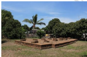
โบราณสถานวัดคูไม้แดง หรือ วัดสามมุเตอ