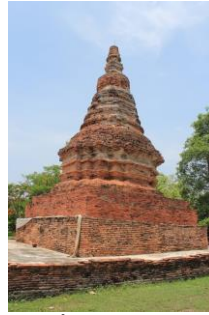
เจดีย์แปดเหลี่ยม โบราณสถานกลุ่ม กลางเวียง ตั้งอยู่บริเวณกลางเวียง