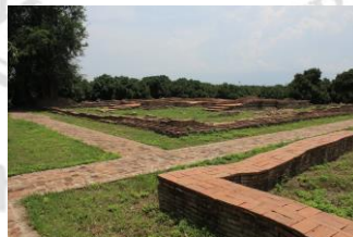
โบราณสถานวัดหนองสระ