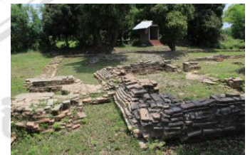
โบราณสถานวัดหางมกร