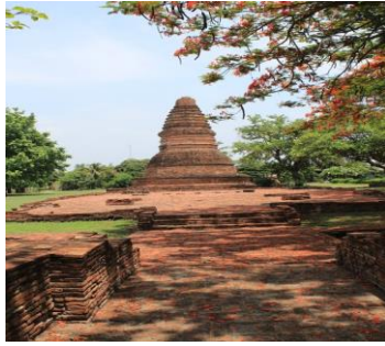
โบราณสถานวัดกลางเมือง