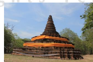
โบราณสถานวัดตันกอก