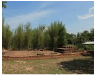
โบราณสถานวัดตันโพธิ์