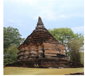
โบราณสถานวัดพระอุโบสถ