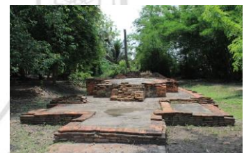
โบราณสถานวัดน้อย