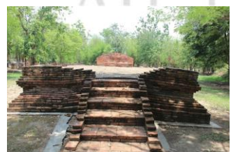
โบราณสถานวัดป่าเป่า