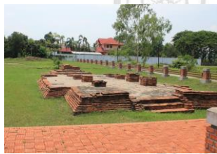
โบราณสถานวัดหนองหล่ม