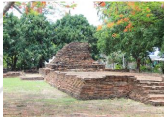
โบราณสถานวัดหัวข่วง