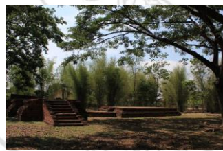
โบราณสถานวัดป่าไม้รวก