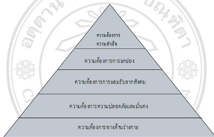
ภาพที่ 2.1 แสดงลำดับชั้นตามความต้องการของมาสโลว์

มาสโลว์ (1954) ได้พัฒนา ทฤษฎีลำดับชั้นความต้องการของมาสโลว์ (Maslow's Hierarchy of Needs Theory) เป็นทฤษฎีการจูงใจที่นักการจัดการ ให้ความสนใจเนื่องจากเป็นการศึกษาความต้องการของพนักงาน โดยนำมาเป็นสิ่งจูงใจให้พนักงานมีความตั้งใจทำงานอย่างเต็มที่ เพื่อให้บรรลุเป้าหมายสูงสุดขององค์กรและส่วนหนึ่งเพื่อตอบสนองความต้องการของพนักงานเช่นกัน เนื่องจากมนุษย์ย่อมมีความต้องการและเมื่อความต้องการยังไม่ได้รับการตอบสนองก็จะเกิดความเครียดนำไปสู่การกระตุ้นให้เกิดแรงขับเคลื่อน เพื่อหาวิธีการหรือพฤติกรรมที่นำไปสู่สิ่งที่ตนเองต้องการ เพื่อลดความตึงเครียดนั้นคุณภาพชีวิต การทำงาน และความสุขทฤษฎีลำดับชั้นความต้องการของมาสโลว์ แบ่งเป็น 5 ระดับ ดังภาพที่ 2.1