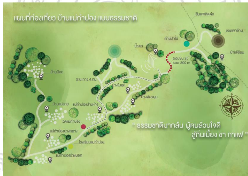
Copyright © by Chiang Mai University All rights reserved

จุดที่สี่ ท่องเที่ยวชมน้ำตกแม่กำปอง ที่อยู่ห่างจากวัดวัดคันชาพฤกษา ประมาณ 4 กิโลเมตร โดยการเดินทางด้วยเท้าหรือรถยนต์ได้สะดวก