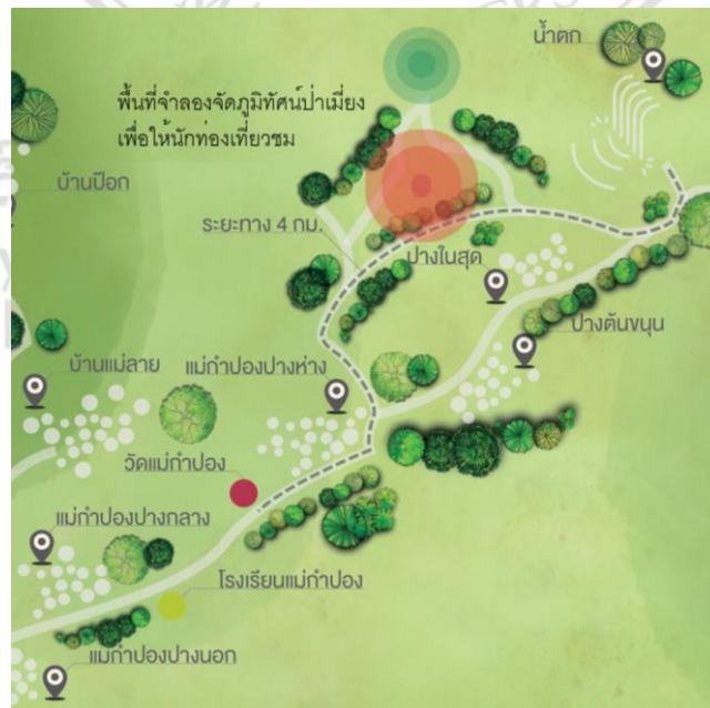
ภาพที่ 5.12 ผังตำแหน่งบริเวณที่ตั้งบริเวณวัดสถานที่จัดแสดงภูมิทัศน์ป่าเมือง

ตั้งอยู่ในแนวเส้นทางการท่องเที่ยวที่ได้จัดไว้เพื่อเป็นตัวอย่างสภาพป่าเมือง ต้นเมือง และสิ่งแวดล้อมของป่าเมืองโดยรวมเพื่อให้เกิดเป็นแหล่งเรียนรู้และท่องเที่ยวเชิงวัฒนธรรมอย่างมีประสิทธิภาพ