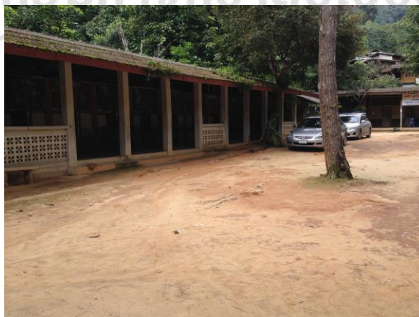
ภาพที่ 5.5 แสดงศาลาบำเพ็ญประโยชน์ของวัดคันธาพฤกษา

การจัดแสดงของศูนย์ข้อมูลการเรียนรู้และท่องเที่ยวเชิงวัฒนธรรม ผู้ศึกษาเสนอให้ใช้ศาลาวัดคันธาพฤกษา ซึ่งเป็นอาคารโล่งว่าง อาคารค้ำถั่วมีขนาดกว้างประมาณ 5 เมตร ยาวประมาณ 12 เมตร ซึ่งเหมาะสมจะใช้เป็นสถานที่จัดแสดงข้อมูลเพราะเป็นศูนย์กลางของชุมชนและนักท่องเที่ยวมักแวะชม