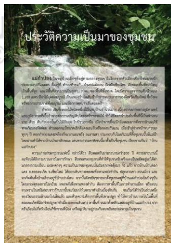
ภาพที่ 5.7 แสดงลักษณะบอร์ดนิทรรศการประวัติความเป็นมาชุมชน