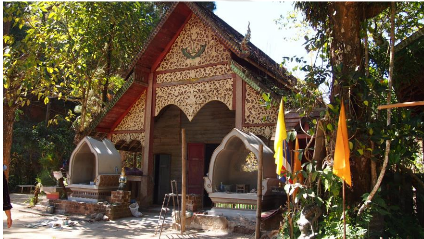
ภาพที่ 5.1 แสดงลักษณะวิหารของวัดคันธาพฤกษา

ศาลาบำเพ็ญประโยชน์ไม่ได้ใช้ประโยชน์ ควรจะปรับปรุงให้มี ส่วนบริการข้อมูลเพิ่มเติมอีกส่วนหนึ่งเพื่อให้เป็นบริการการเรียนรู้ และท่องเที่ยว เกี่ยวกับ ประวัติศาสตร์ หรือ วิถีชีวิต รวมถึงวัตถุจัดแสดงที่น่าสนใจ จัดแสดงในบริเวณศาลาบำเพ็ญประโยชน์ เพื่อให้เกิดเป็นแหล่งเรียนรู้และท่องเที่ยวเชิงวัฒนธรรมอย่างมีประสิทธิภาพ