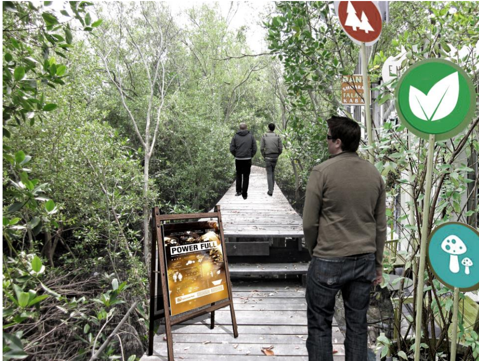
ภาพที่ 5.13 แสดงภาพภูมิทัศน์ภายในสวนเมือง

พื้นที่สวนเมืองธรรมชาติในเส้นทางท่องเที่ยวภาพ จาก ลักษณะของสภาพพื้นที่ของป่าเมือง ปรับปรุงภูมิทัศน์ให้เอื้อต่อ การเรียนรู้โดยจัดทำทางเดินและป้ายนำชม ต่าง ๆ ของสวนเมือง