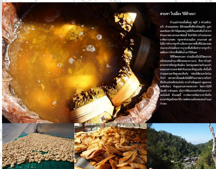
ภาพที่ 5.15 ตัวอย่างการแสดงการจัดทำแผ่นพับ

เพื่อเพิ่มประสิทธิภาพการเรียนรู้และท่องเที่ยวเชิงวัฒนธรรมป่าเมี่ยงและการทำเมี่ยง ตลอดจนวิถีชีวิตของชุมชนบ้านแม่กำปอง ควรมีการจัดทำ เอกสารแผ่นพับ ผู้ศึกษาจึงได้ออกแบบการจัดแผ่นพับเพื่อให้นักท่องเที่ยวและผู้สนใจ โดย ตัวอย่างการออกแบบแผ่นพับจะมีการอธิบายถึงประวัติความเป็นมาของชุมชน ป่าเมี่ยง การทำเมี่ยง และลักษณะของอุปกรณ์การทำเมี่ยง และผลิตภัณฑ์ที่แปร รูปจากใบชา