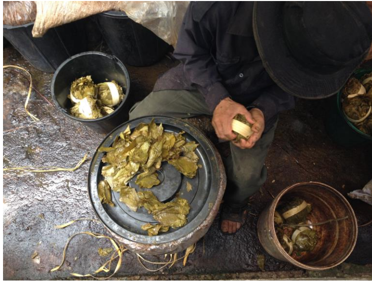
ภาพที่ 5.4 แสดงวิถีชีวิตการทำเมี่ยง