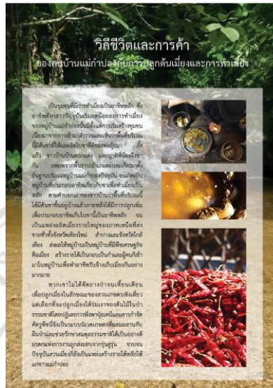
ภาพที่ 5.8 แสดงลักษณะบอร์ดนิตรรศการ วิถีชีวิตและการค้าของคนบ้านแม่กำปอง กับการปลูกต้นเผือกและการทำเผือก