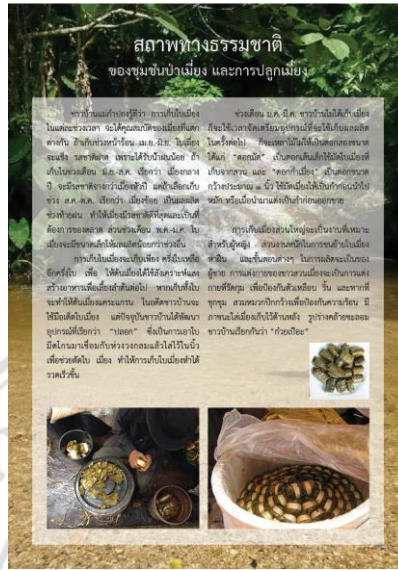
ภาพที่ 5.10 แสดงลักษณะบอรรถนิทรรศการ การทำเมี่ยงและผลิตภัณฑ์เกี่ยวกับเมี่ยง