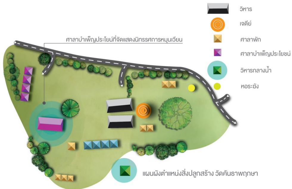
ภาพที่ 5.3 แสดงให้เห็นถึงพื้นที่ใช้สอยต่าง ๆ ภายในวัดคั่นราพฤกษา