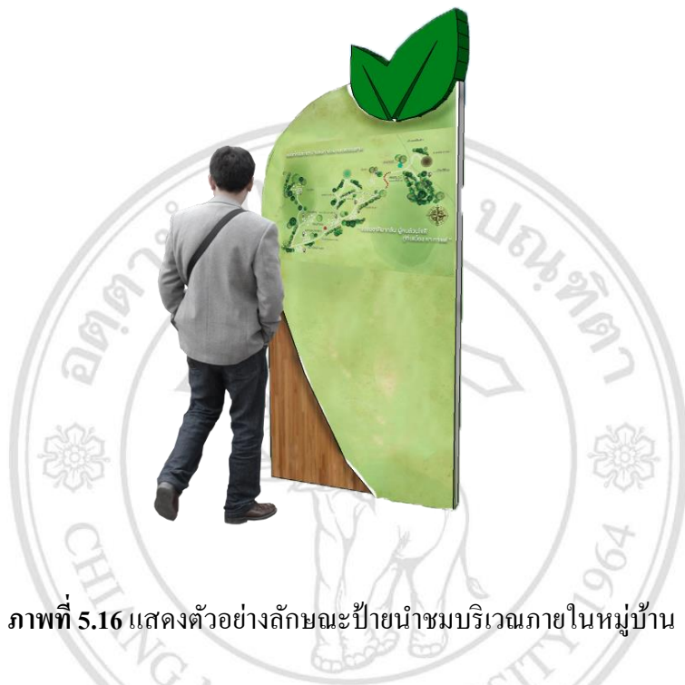
ภาพที่ 5.16 แสดงตัวอย่างลักษณะป้ายนำชมบริเวณภายในหมู่บ้าน

อาทิ ป้ายแสดงทิศทาง ป้ายสถานที่ ป้ายนำ แผนที่เส้นทางท่องเที่ยว ห้องน้ำ ร้านค้าสิ่งของเครื่องใช้ สถานที่จอดรถ ศาลาที่พัก และอื่นๆ ซึ่งการดำเนินการ ส่วนนี้ชุมชนอาจดำเนินการเองหรือประสานความร่วมมือกับองค์กรปกครอง ส่วนในท้องถิ่น