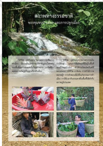
ภาพที่ 5.9 แสดงลักษณะบอร์ดนิตรรศการ สภาพทางธรรมชาติของป่าเผือกและการปลูกเผือก