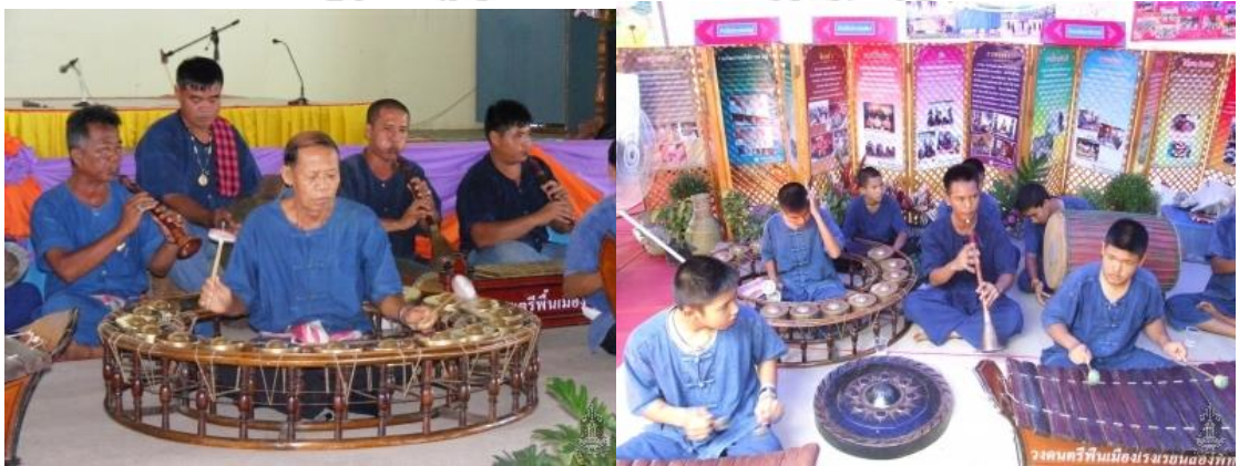
ภาพที่ 5.1 แสดงลักษณะวงปี่พาทย์ (พาทย์ก้อง)