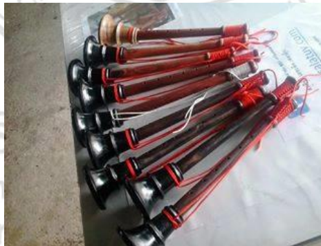
ภาพที่ 5.11 ปี่แน ขนาดต่างๆ

ปี่แนอาจไม่เหมาะสำหรับบรรเลงในโรงพยาบาล เพราะให้เสียงที่สูง และ มักใช้ประกอบงานอวมงคล ทำให้ผู้ฟังเกิดความรู้สึกอึดอัด และไม่เป็นมงคล ส่งผลต่อจินตนาการ ต่อญาติของตนเอง อาจเพิ่มความวิตกกังวลมากกว่าเดิมได้ อีก