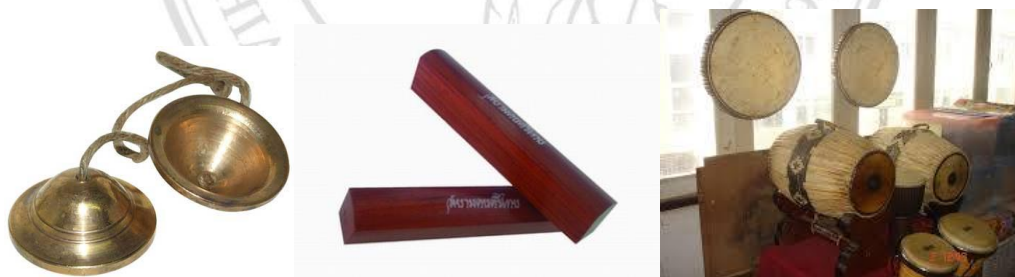
ลิขสิทธิ์มหาวิทยาลัยเชียงใหม่ Copyright © by Chiang Mai University All rights reserved ภาพที่ 5.9 ฉิ่ง กรับ กลอง

2.3) เครื่องตี กระทบกระทั่งด้วย “ไม้” ได้แก่ กรับ กระทบกระทั่งด้วย “โลหะ” ได้แก่ ฉิ่ง กระทบกระทั่งด้วย “หนังสัตว์” ได้แก่ กลอง ทำให้ผู้ฟังการความรู้สึก สนุกสนานได้ในบางจังหวะ แต่เสียงที่แหลมของฉิ่ง ต้องเลือกให้เหมาะสมกับบริบทที่ บรรเลง อาจไม่จำเป็นนักในการบรรเลงเพื่อส่งเสริมสุขภาพในล้านนา การสั่นสะเทือน ของกลองที่มากเกินไปทำให้ผู้ป่วยไม่สุขสบาย เนื่องจาก ผลของการสั่นสะเทือนที่เข้าไป รบกวนระบบต่างๆของร่างกายได้มาก