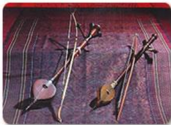
ภาพที่ 5.8 แสดงลักษณะระนาด ขนาดต่างๆ

2.3) เครื่องตี กระทบกระทั่งด้วย “ไม้” ได้แก่ กรับ กระทบกระทั่งด้วย “โลหะ” ได้แก่ ฉิ่ง กระทบกระทั่งด้วย “หนังสัตว์” ได้แก่ กลอง ทำให้ผู้ฟังการความรู้สึก สนุกสนานได้ในบางจังหวะ แต่เสียงที่แหลมของฉิ่ง ต้องเลือกให้เหมาะสมกับบริบทที่ บรรเลง อาจไม่จำเป็นนักในการบรรเลงเพื่อส่งเสริมสุขภาพในล้านนา การสั่นสะเทือน ของกลองที่มากเกินไปทำให้ผู้ป่วยไม่สุขสบาย เนื่องจาก ผลของการสั่นสะเทือนที่เข้าไป รบกวนระบบต่างๆของร่างกายได้มาก