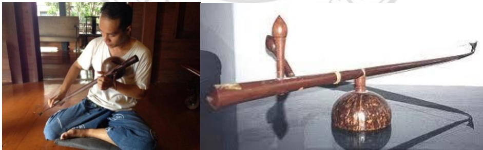
ภาพที่ 5.7 แสดงพิณเป็ยะ และการบรรเลง

2.1.2 พิณเป็ยะ เป็นเครื่องดนตรี ประเภท “ดีด น่าจะเกิดหลัง “ซิ่ง” เพราะต้องใช้เทคโนโลยีขั้นสูง ทั้งด้านการสร้าง ส่วนการบรรเลง มี 2 สาย ต่อมาจึงพัฒนาเป็น 3 สาย 4 สาย จนถึง 7 สาย เป็ยะ ไม่นิยมนำมาบรรเลงผสมวง เนื่องจากเสียงที่บรรเลงออกมานั้น เบา เหมาะสำหรับใช้ประเทืองอารมณ์และบรรเลงในสถานที่เงียบสงบแต่เพียงชิ้นเดียว ไม่เหมาะที่จะนำไปบรรเลงร่วมกับเครื่องดนตรีชนิดอื่น เพราะเครื่องดนตรีอื่นจะดังกลบเสียงหมด