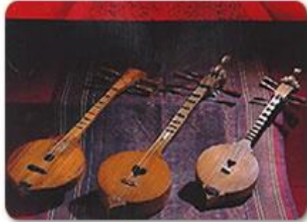
ภาพที่ 5.6 ซิ่งที่ใช้บรรเลง

ใกล้เคียงกับสะล้อ ซึ่งที่ใช้อยู่ทั่วไป มี 3 ขนาด แบ่งเป็น คือซิ่งเล็ก ซิ่งกลาง ซิ่งใหญ่ ให้เสียงที่ต่อเนื่องในการรับฟัง