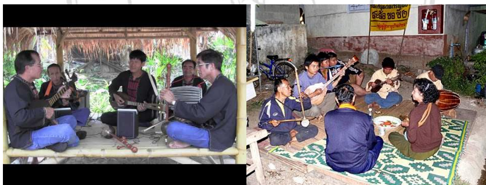
ภาพที่ 5.5 การบรรเลงวง สะล้อ ซอ ซึง ในบรรยากาศ ที่ไม่เป็นทางการ