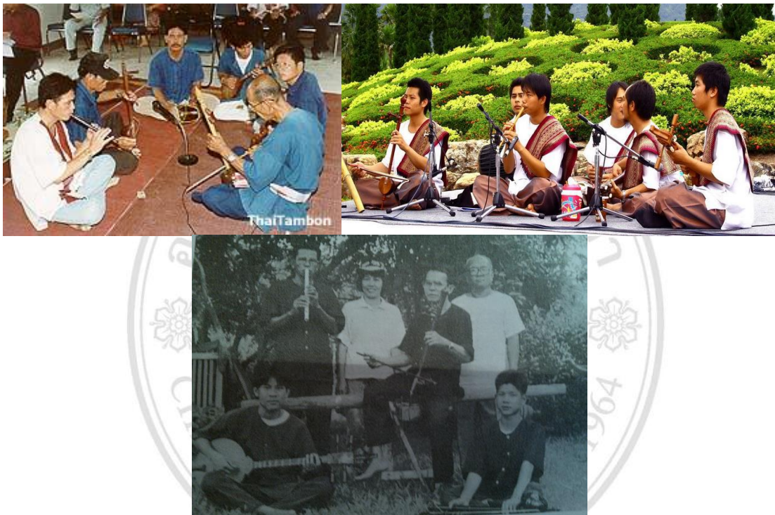
ภาพที่ 5.2 แสดงลักษณะวง ซึงสะล้อ

แบบที่ 2 เป็นวงเฉพาะกิจ นำมาบรรเลงด้วยศรัทธา ปัจจุบันกลายเป็นวงดนตรีพื้นเมืองล้านนาที่เดิมมีชื่อว่า “วงสะล้อซอซึง” แต่ปัจจุบันมีชื่อเรียกอีกชื่อหนึ่งว่า “วงซึงสะล้อ”