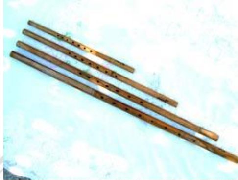
ภาพที่ 5.10 แสดงขลุ่ย ขนาดต่างๆ

ขลุ่ยที่ชำนาญ ควรเลือกเสียงของขลุ่ยที่ฟังแล้วเกิดความนุ่มนวล พริ้วไหว และ เกิดอารมณ์คล้อยตาม โทนเสียงต่ำ การบรรเลงเป็นจังหวะซ้ำสม่ำเสมอ