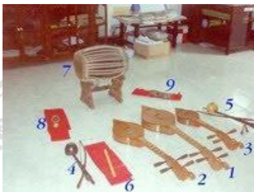
ภาพที่ 5.4 แสดง องค์ประกอบ เครื่องดนตรี ในวงสะล้อ ซอ ซึง ขลุ่ย

กลอง และการให้เสียงที่พริ้วไหว เช่นขลุ่ย นั้นทำให้ผู้ฟังรู้สึกถึงความหมายและอารมณ์ จากเสียงเพลงตามจินตนาการที่ได้เคยได้เห็นและ ได้ยินมา ส่งผลต่อสภาวะสุขภาพ ของผู้ ที่ได้ฟัง และ อิริยาบถ ของผู้บรรเลงที่เป็นธรรมชาติ ให้ความเป็นอันเองกับผู้ฟัง ทำให้ ผู้ฟัง ก่อให้เกิด การใช้สมรรถนะ จากตัวเองเพื่อบำบัดความเครียดและความวิตกกังวล ให้ หหมดไปได้