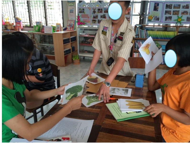
นักเรียนทำกิจกรรมชุดทรัพยากรพาเพลิน (แยกประเภทของอาหารหลัก 5 หมู่)