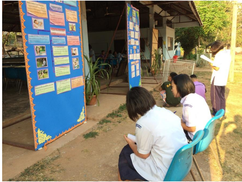
นักเรียนศึกษานิทรรศการเกี่ยวกับอาหารและโภชนาการด้วยความตั้งใจ