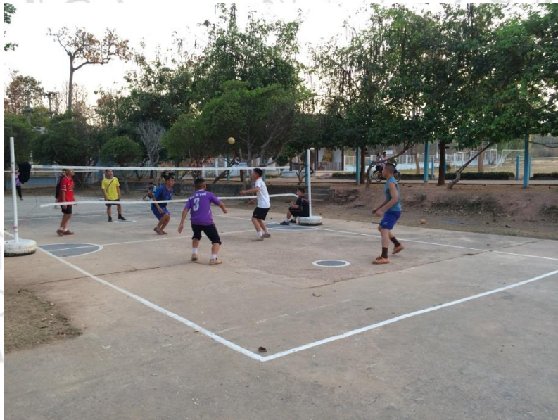
นักเรียนออกกำลังกายร่วมกันตอนเย็น