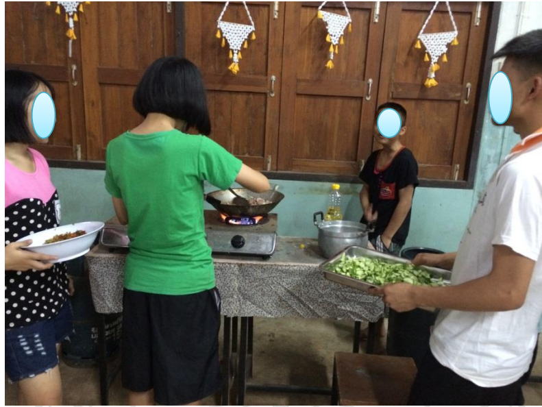
นักเรียนเรียนรู้วิธีการประกอบอาหาร