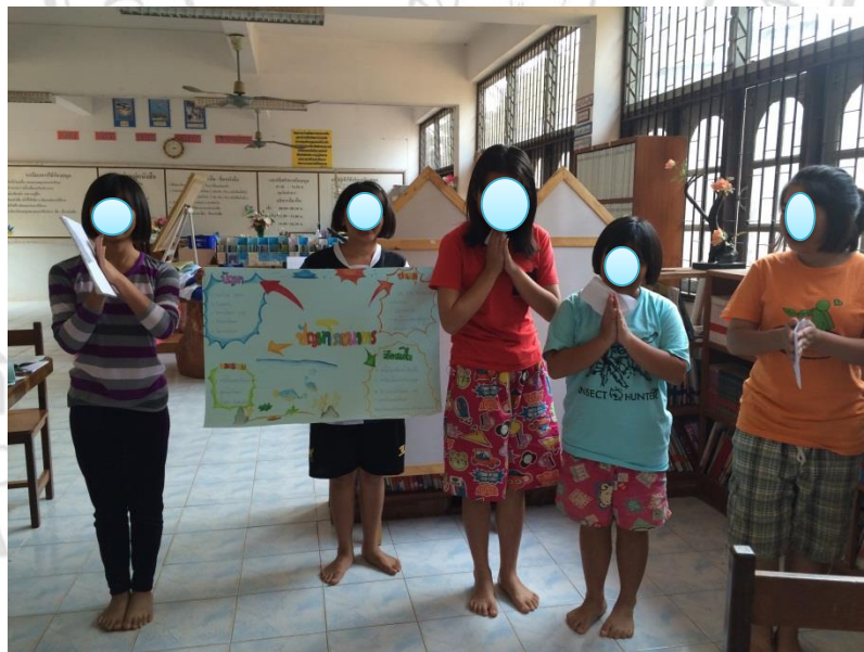
นักเรียนทำกิจกรรมกลุ่มแลกเปลี่ยนเรียนรู้ปัญหาโภชนาการร่วมกัน