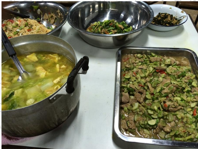
ตัวอย่างอาหารที่นักเรียนทำ