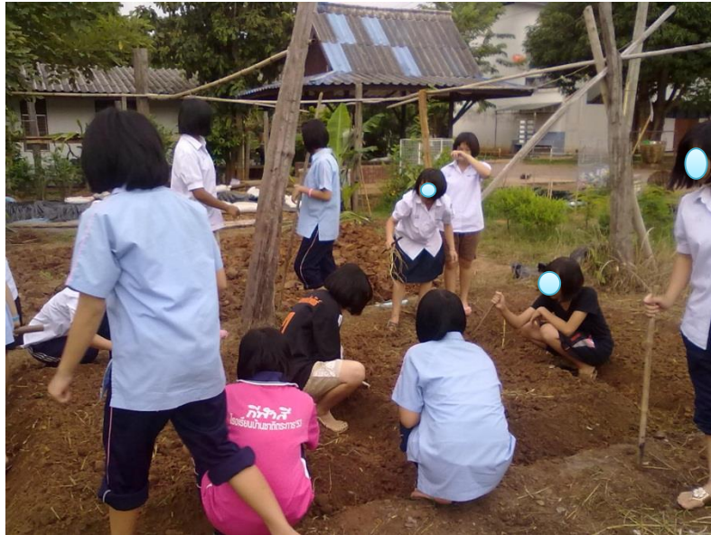
นักเรียนพรวนดินปลูกผักเพื่อใช้เป็นวัตถุดิบในการประกอบอาหาร