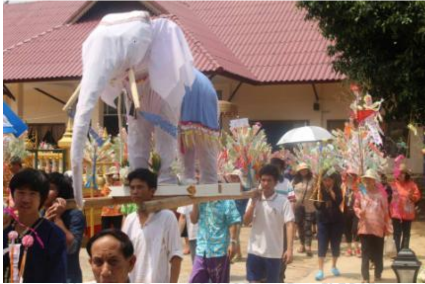
ภาพที่ 5.3 ขบวนแห่ช้างผ้า

รูปแบบการจัดตั้งขบวนในงาน “ประจำปีประเพณีแห่ช้างผ้าของชุมชนเกาะหลวง”