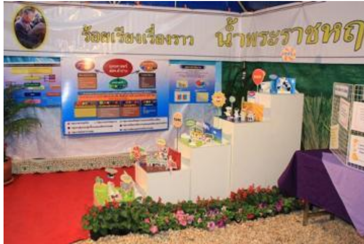
ภาพที่ 5.8 ตัวอย่างนิทรรศการการเรียนรู้