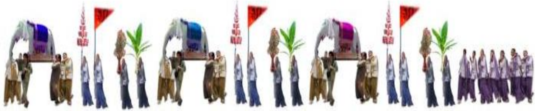
ภาพที่ 5.6 ขบวนช้างบ้านในแต่ละกลุ่ม