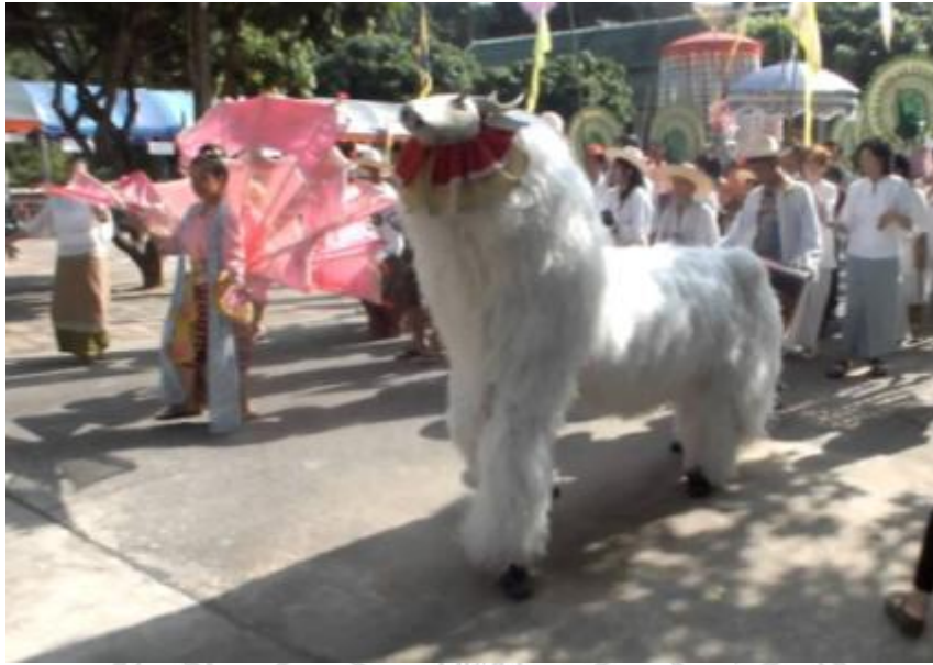
ภาพที่ 5.1 การพ่อนก โต