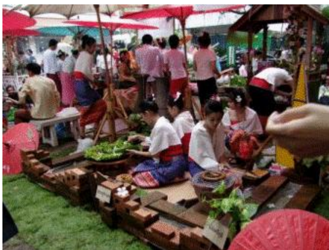
ภาพที่ 5.7 ตัวอย่างตลาดล้านนา