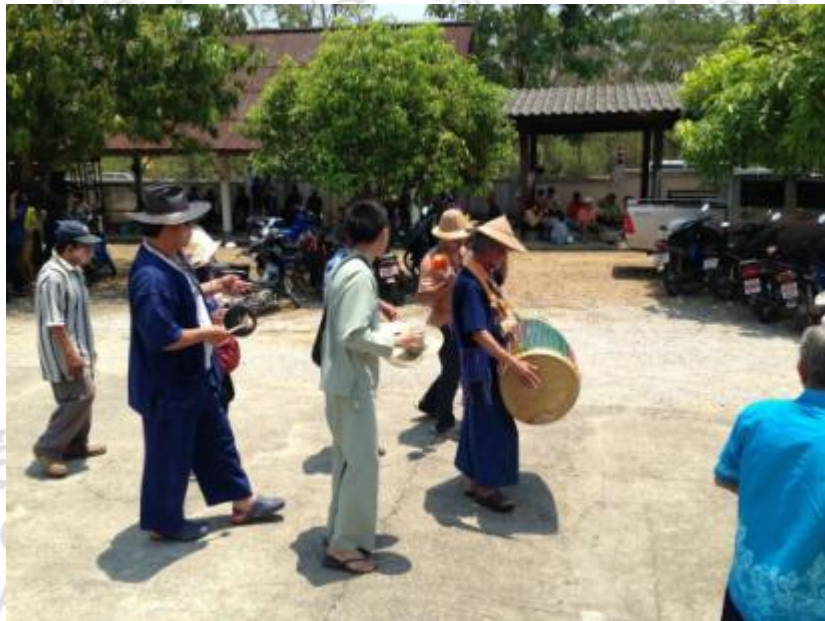
ภาพที่ 5.2 ขบวนกลองมอญเชิงรูปแบบใช้แห่ช้างผ้าในอิต