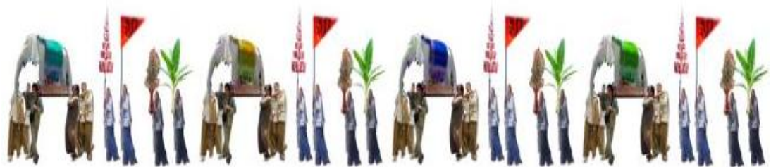
ภาพที่ 5.5 ขบวนช้างบ้านในแต่ละกลุ่ม