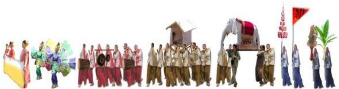
ภาพที่ 5.4 หัวขบวนงานประจำปีประเพณีแห่ช้างผ้าของชุมชนเกาะหลวง

รูปแบบการจัดตั้งขบวนในงาน “ประจำปีประเพณีแห่ช้างผ้าของชุมชนเกาะหลวง”