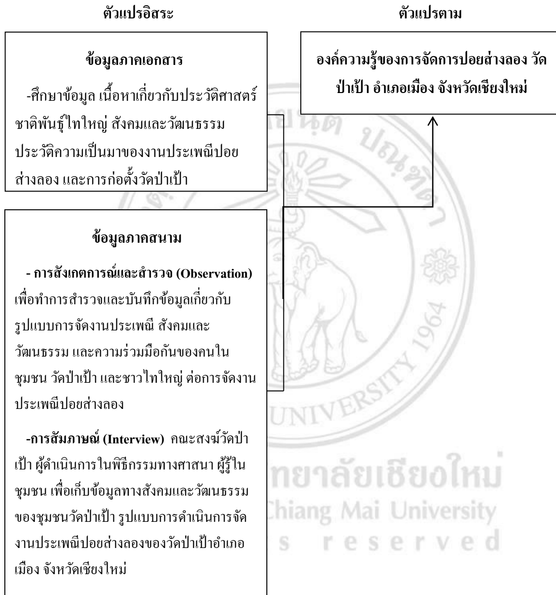
แผนภาพที่ 3 : กรอบแนวคิดในการศึกษาวิจัย