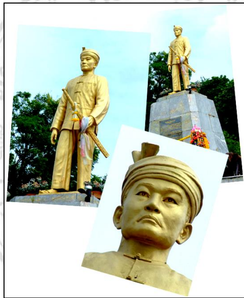
ภาพที่ 2.2 อนุสาวรีย์خانกะเล หรือ พญาสิงหนาทราชา

สิงหนาทราชา” (ภาพที่ 2.2) ครองเมืองแม่ฮ่องสอน ในปีพุทธศักราช 2417 ตรงกับสมัย รัชกาลที่ 5 ต่อมาในปีพุทธศักราช 2427 หลังจากทำนุบ้านเมือง มาได้ 10 ถึง พญาสิงหนาทก็ ถึงแก่กรรม ผู้ที่ครองเมืองแม่ฮ่องสอนต่อมาคือ “เจ้านางเมี้ยว” ครองเมืองแม่ฮ่องสอนอยู่ 7 ปี ได้นำความเจริญมาสู่เมืองแม่ฮ่องสอนเป็นอันมากและถึงแก่กรรมเมื่อปีพุทธศักราช 2434