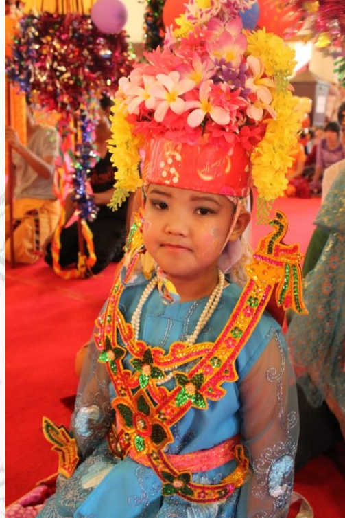
ภาพที่ 2.4 ช่างลง หรือ ลูกแก้วที่เข้าร่วมพิธีกรรม

กรุงกบิลพัสดุ์ก่อนจะออกผนวช การกระทำอย่างในช่วงเวลาการเป็นช่างลงจะปฏิบัติ เสมือนการปฏิบัติต่อพระมหากษัตริย์ 32 (ภาพที่ 2.4)