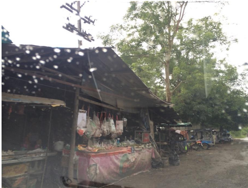
ภาพที่ 4.13 ร้านค้าไทใหญ่หลังวัดป่าเป้า