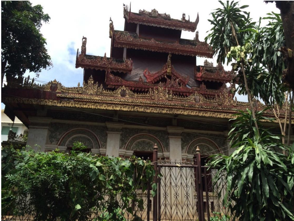
ภาพที่ 4.6 พระอุโบสถ