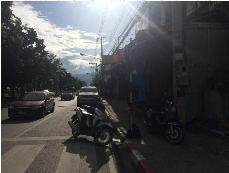
ภาพที่ 4.8 ชุมชนวัดป่าเป้า จังหวัดเชียงใหม่

ประตู่ข้างม่อย นอกจากกลุ่มไทใหญ่แล้วบริเวณย่านประตู่ข้างเฟือกและที่ตั้งชุมชนป่าเป้ามีความอุดมสมบูรณ์เป็นอย่างมาก ต่อมาเมื่อพ่อค้ามุสลิมเชื้อสายปาเกีสถานและอินเดียประมาณ 4 - 5 (ครอบครัวนำโดยท่านนะปะซางหรือพ่อเลี้ยงเลานะมาตั้งถิ่นฐาน) ใช้เป็นพื้นที่เลี้ยงสัตว์ โดยระยะแรกไม่นานมาขที่มัสยิดข้างคลาน ต่อมาเมื่อมีพ่อค้ามุสลิมมาอยู่เพิ่มขึ้นจึงสร้างมัสยิดที่ประตู่ข้างเฟือกเสาไม้ไผ่ หลังคามุงด้วยใบตอง ฝาขัดแตะ ไม่มีพื้น และต่อมา พ่อเลี้ยงเลานะได้ปรับปรุงเป็นอาคารทำด้วยไม้กระดานและได้รับการยกย่องเป็นอิหม่ามของสัปบุรุษแห่งนี้ ต่อมาคณะกรรมการสมัยฮัจยี ศรีบุญย์ วารีย์เป็น ประธานได้ปรับปรุงก่อสร้างมัสยิดใหม่สร้างเป็นสถาปัตยกรรมปาเกีสถานดังเห็นสืบมาในปัจจุบัน