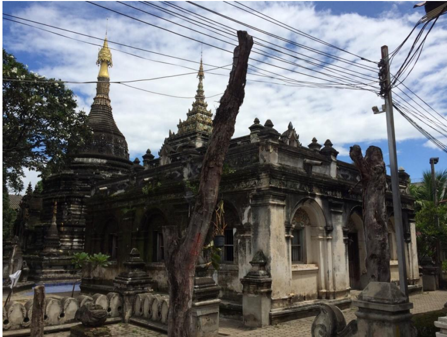
ภาพที่ 4.5 คันทกฤฎี

3) พระอุโบสถ เป็นพระอุโบสถทรงพม่าแบบตึกผสมไม้ หลังคาทรงจั่วซ้อนชั้นขึ้นไปเป็นสถาปัตยกรรมลานที่เรียกว่า “พญาธาตุ” โดยเป็นหลังคาทรงสูงซ้อนกันหลายชั้น และชั้นบนสุดจะมียอดแหลมประดับด้วยไม้แกะสลักฝีมือประณีต เป็นที่ประดิษฐานพระพุทธรูป 3 องค์ ชั้นล่างเป็นผนังก่ออิฐ ถูปูน โดยทำปูนปั้นเป็นซุ้มโค้งบริเวณช่องหน้าต่างแบบศิลปะตะวันตก