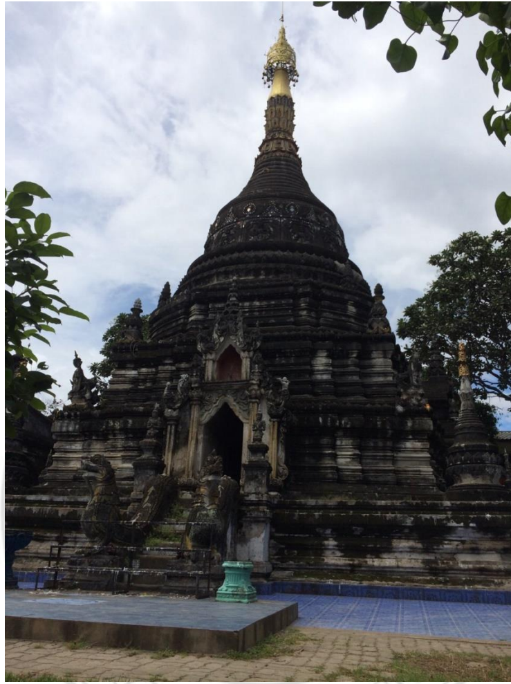
ภาพที่ 4.4 องค์พระเจดีย์

2) คันธฤฎี เป็นอาคารก่ออิฐถือปูน ที่มีศิลปะผสมผสานระหว่าง พม่าและตะวันตก โดยมีผนังทำปูนปั้นเป็นซุ้มโค้งแบบ ตะวันตกส่วนยอด เป็นทรงปราสาทซ้อนชั้นศิลปะพม่า สร้างขึ้นเมื่อปี พ.ศ. 2468 ภายหลังได้ ใช้เป็นพิพิธภัณฑ์ภายในวัด