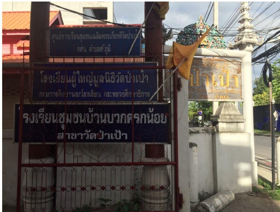
รูปที่ 4.10 วัดป่าเป้า อำเภอเมือง จังหวัดเชียงใหม่