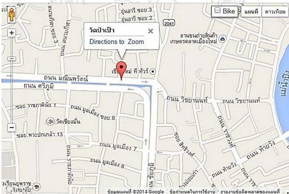
ภาพที่ 4.1 แผนที่วัดป่าเป้า อำเภอเมือง จังหวัดเชียงใหม่

วัดป่าเป้า ตั้งอยู่เลขที่ 58 บริเวณแจ้งศรีภูมิ ถนนมณีนพรัตน์ ตำบลศรีภูมิอำเภอเมือง จังหวัดเชียงใหม่ แต่เดิมมีพื้นที่ทิศเหนือ ห่างจากวัด 100 วา ทิศใต้จนถึงคูเมืองทิศตะวันออก ห่างจากวัด 100 วา และทิศตะวันตก ห่างจากวัด 100 วา วัดป่าเป้าในปัจจุบันมีพื้นที่ดินสี่เหลี่ยมจัตุรัส มีเนื้อที่ 10 ไร่ 81 ตารางวา อีกทั้งยังมีที่ภายนอกกำแพงที่เป็นที่ธรณีสงฆ์ มีเนื้อที่ 1 ไร่ 2 งาน 73 ตารางวา เมื่อคิดรวมกันแล้วมีเนื้อที่ทั้งหมด 11 ไร่ โดยประมาณ