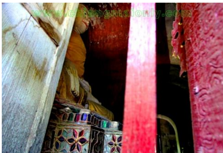
ภาพที่ 4.3 พระพุทธรูปศิลปะพม่า ของวัดป่าเป้า อำเภอเมือง จังหวัดเชียงใหม่