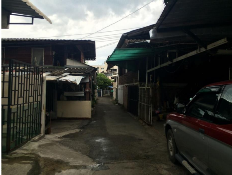
ภาพที่ 4.12 ชุมชนไทใหญ่วัดป่าเป้า