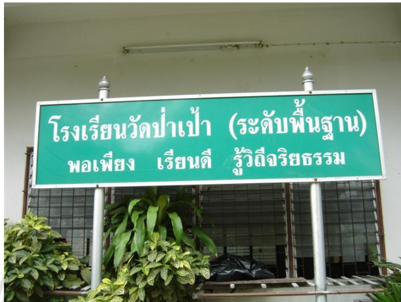
ภาพที่ 4.7 ศูนย์การเรียนรู้วัดป่าเป่า