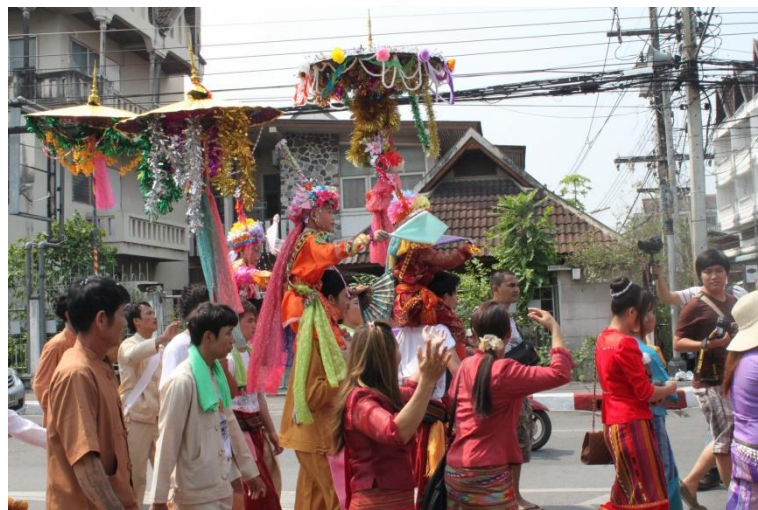
ภาพที่ 4.6 พิธีการแห่ต่างลง ณ วัดป่าเป้า จังหวัดเชียงใหม่

บุพการีของต่างลง โดยจะมีการแห่ต่างลงรอบเจดีย์ 9 รอบ แล้วจึงนำขึ้นไปบนวิหาร เพื่อรับผ้าจีวรไปนุ่ง และกลับมาเปล่งวาจาขอรับศีล 10 และขอนิสัง และต่อมาพระอุปัชฌาย์จะให้ศีล บอกรักษามัญฐานและให้โอวาทต่างลงเพื่อเปลี่ยนสถานเป็นสามเณร โดยหลังจากหลังจากเสร็จพิธีจะมีเทศนา 1 กัณฑ์ทำพิธีบรรพชา และถวายไทยทานเป็นเสร็จพิธี