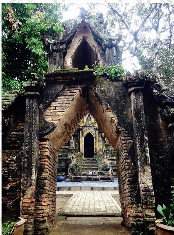
ภาพที่ 4.2 ศิลปะพม่าของวัดป่าเป้า อำเภอเมือง จังหวัดเชียงใหม่

วัดป่าเป้า อำเภอเมือง จังหวัดเชียงใหม่ ซึ่งเรียกได้ว่าเป็นวัดของไทยใหญ่วัดแรกในจังหวัดเชียงใหม่ ด้วยประวัติศาสตร์อันยาวนาน วัดป่าเป้า อำเภอเมือง จังหวัดเชียงใหม่ ได้รับการบูรณะ และก่อสร้างขึ้นโดยกลุ่มคนไทยใหญ่ซึ่งนำโดยหม่อมบัวไหล วัดป่าเป้า อำเภอเมืองจังหวัดเชียงใหม่ จะมีศาสนสถานเป็นลักษณะศิลปะพม่าไทใหญ่ ซึ่งมีความสวยงาม และเป็นที่น่าสนใจของนักท่องเที่ยวทั้งชาวไทย และชาวต่างชาติ