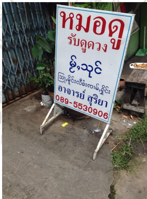
ภาพที่ 4.14 บ้านหมอเมืองดี