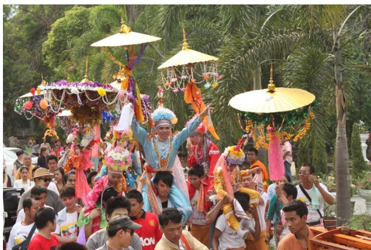
ภาพที่ 4.15 ประเพณีปอยส่างลองวัดป่าเป่า วันที่ 5 เมษายน 2556