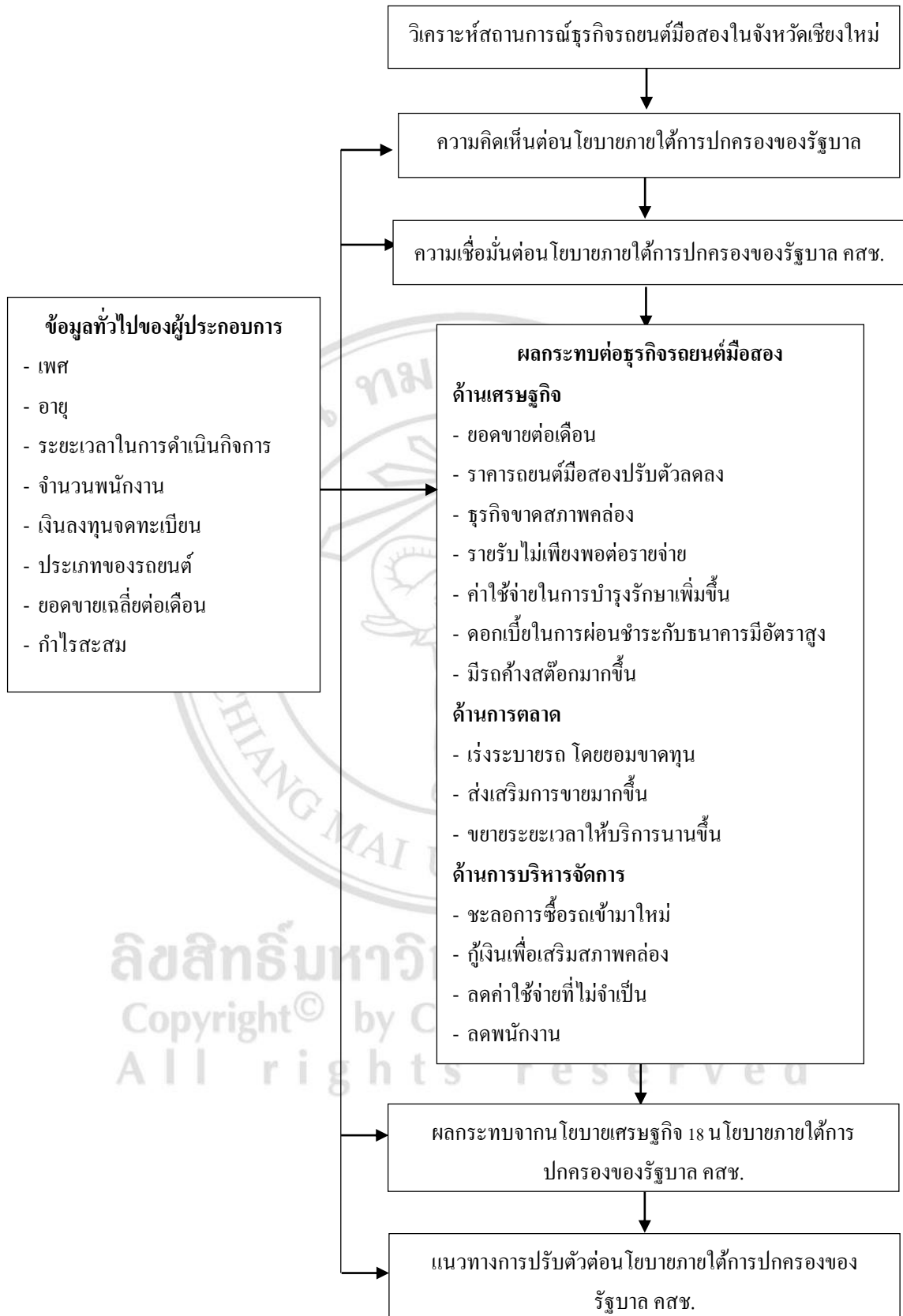
ภาพที่ 2.1 กรอบแนวคิด