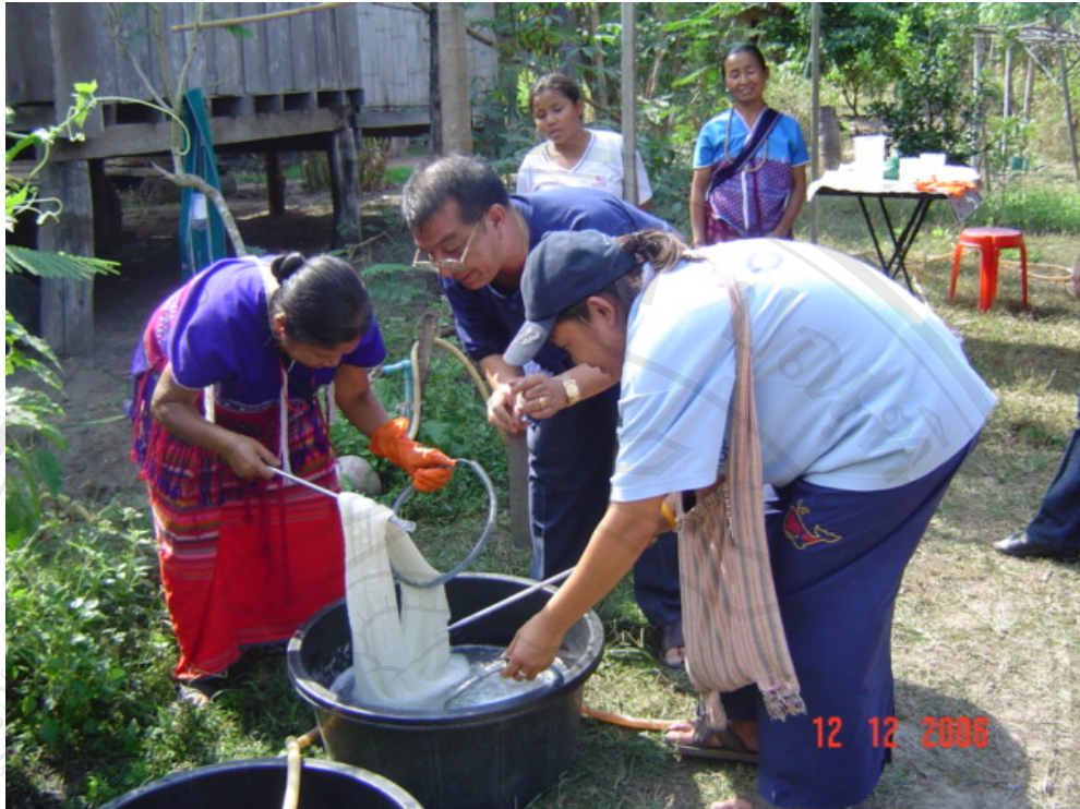
ภาพที่ 10, 11 การอบรม“การย้อมสีธรรมชาติ” สนับสนุนงบประมาณโดยสำนักงานอุตสาหกรรม จังหวัดลำพูน