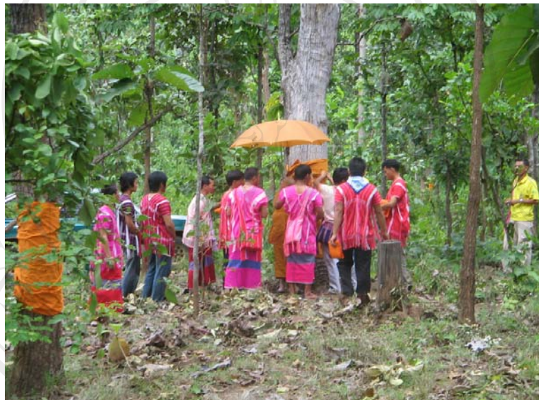
ภาพที่ 5 พิธีการบวชป่าชุมชนของชุมชนพระบาทห้วยต้ม

จากการที่ชนเผ่าปกากะญอต้องอาศัยทรัพยากรธรรมชาติ แม่น้ำลำธาร ขุนเขาป่าไม้ในการดำรงชีวิต ชนเผ่าปกากะญอมีความผูกพันกับป่า รักและหวงแหนธรรมชาติมาก การนำวิถีธรรมชาติมาใช้ในปัจจุบันของชนเผ่าปกากะญอ คือการปลูกฝ้ายมาใช้ในการทอผ้า การใช้เปลือกไม้ ใบไม้ ดอกไม้ ดินโคลน มาเป็นสีย้อมผ้า ดังนั้นเมื่อนำวิถีธรรมชาติมาใช้ประโยชน์ จึงได้มีการอนุรักษ์ทรัพยากรธรรมชาติไว้เพื่อสืบต่อลูกหลานในอนาคต เมื่อนำมาใช้ก็จะทำการทดแทนเพื่อไม่ให้หมดไปจากป่า และได้สั่งสอนลูกหลานสืบต่อกันมาจนถึงปัจจุบัน