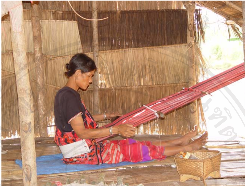
ภาพที่ 1 การทอผ้าแบบกี่เอวของสตรีชนเผ่าปกากะญอ

จากการสัมภาษณ์สมาชิกวิสาหกิจชุมชนพระบาทห้วยต้ม พบว่า ในสมัยนั้นชนเผ่าปกากะญอทุกครัวเรือนจะปลูกฝ้าย เพื่อใช้ในการถักทอเครื่องนุ่งห่ม สำหรับสมาชิกในครอบครัว ฝ้ายที่ชนเผ่าปกากะญอปลูกเป็นฝ้ายพันธุ์พื้นเมือง มีลักษณะลำต้นพอม สูง ไม่แตกพุ่ม ปุยฝ้ายเส้นหยาบ ซึ่งเป็นฝ้ายคุ่น เป็นฝ้ายที่มีสีน้ำตาลอ่อน และฝ้ายขาว มีวิธีการปลูก 2 วิธี คือ ปลูกปนกับข้าวไร่ โดยใช้เมล็ดหวานลงลงในไร่ข้าว หลังจากที่ปลูกข้าวและต้นข้าวสูงประมาณ 1-5 คืบ เมื่อเมล็ดฝ้ายออกเป็นต้นกล้า ถ้ามีจำนวนต้นฝ้ายหนาแน่นเกินไปจะถอนออก เพื่อให้ฝ้ายเจริญเติบโตได้ดี ทั้งนี้การปลูกฝ้ายปนกับข้าวไร่ นั้น ต้นฝ้ายจะไม่แย่งอาหารต้นข้าว และไม่ทำให้ข้าวชะงักการเจริญเติบโต สามารถเก็บเกี่ยวข้าวได้ก่อนฝ้ายโดยไม่ทำให้ต้นข้าวเสียหาย และอีกวิธีหนึ่งเป็นการปลูกปนกับพืชสวนครัวในบริเวณบ้านหรือสวนใกล้บ้าน ซึ่งปลูกได้จำนวนจำกัด เนื่องจากมีพื้นที่น้อย ต้องแบ่งปลูกกับพืชหลายชนิด