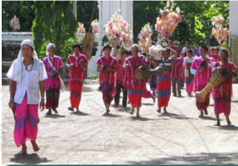
ภาพที่ 3 การแต่งกายในชุดแต่งกายประจำเผ่าในการประกอบพิธีทางศาสนา

ชนเผ่าปกากะญอจะมีเอกลักษณ์ในการแต่งกาย ที่ยังคงยึดถือวัฒนธรรมและประเพณีนี้ อย่างเคร่งครัด โดยการแต่งกายของผู้หญิงสาวจะสวมชุดยาวสีขาว และผู้หญิงที่แต่งงานแล้วก็จะ สวมใส่เสื้อคนละท่อน คือนุ่งผ้าซิ่นและเสื้อที่ทอขึ้นใช้เอง สาเหตุที่ผู้หญิงที่แต่งงานแล้วต้องนุ่งคน ละท่อนเพราะเป็นการให้เกียรติแก่ผู้หญิงที่ยังไม่ได้แต่งงาน