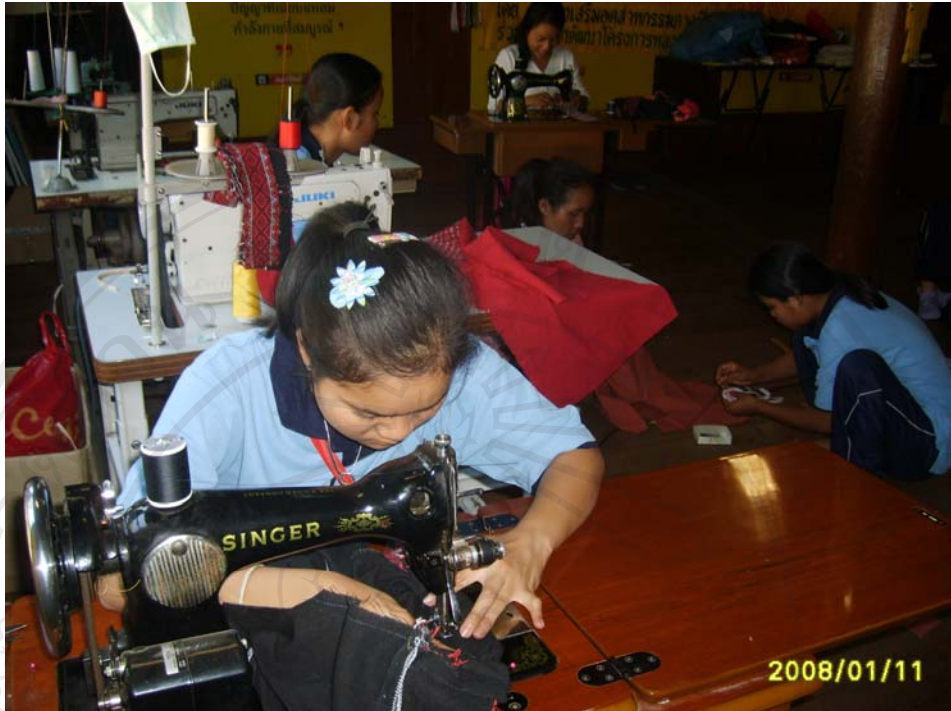
ภาพที่ 12, 13 การอบรม “การแปรรูปผลิตภัณฑ์ผ้าทอกะเหรี่ยง” วันที่ 10 – 13 มกราคม 2551 สนับสนุนงบประมาณโดยมูลนิธิโครงการหลวง

ในด้านงบประมาณสนับสนุน วิทยาลัยชุมชนพระบาทห้วยต้มได้รับงบประมาณจากผู้ว่าราชการจังหวัด พัฒนาชุมชน พัฒนาสังคม มูลนิธิโครงการหลวง ศูนย์ส่งเสริมการเกษตรที่สูงจังหวัดลำพูน เขตพัฒนาและสวัสดิการบนพื้นที่สูง 1 ถี่ และองค์การบริหารส่วนตำบลนาทรายอย่างต่อเนื่อง โดยวิทยาลัยชุมชนพระบาทห้วยต้มนำไปใช้ในการดำเนินกิจกรรมกลุ่ม ปรับปรุงศูนย์เรียนรู้ และรวมทั้งเป็นสวัสดิการแก่สมาชิก