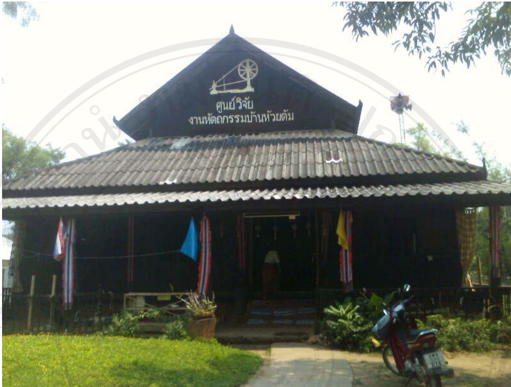
ภาพที่ 6 ศูนย์วิจัยงานหัตถกรรมบ้านห้วยต้ม