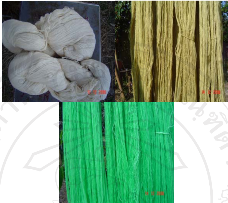
ภาพที่ 2 ฝ้ายที่ยังไม่ได้ย้อมสี ฝ้ายที่ได้จากการย้อมสีธรรมชาติและฝ้ายที่ได้จากการย้อมสีเคมี

ผ้าทอของชนเผ่าปกากะญอจะมีเอกลักษณ์คือผ้าที่ทอจะมีขนาดเล็ก แคบ จึงทำให้เครื่องนุ่งห่มของชนเผ่าปกากะญอ มีรอยต่อในการเย็บเป็นตัวเสื้อ เมื่อนำมาเย็บประกอบติดกันไม่มีส่วนโค้งเว้า ลวดลายของตัวเสื้อได้มาจากตำนานที่เล่าขานนานมาคือลายงูเหลือม และมีการอนุรักษ์ลายผ้าไว้ตลอดชั่วอายุคน การอนุรักษ์ลายงูเหลือมซึ่งคนส่วนใหญ่จะบอกว่าเป็นลายดอกไม้ แต่ชนเผ่าปกากะญอจะรู้กันว่าเป็นลายของงูเหลือม และประเพณีการสวมใส่เสื้อผ้าก็ยังคงอนุรักษ์ไว้ จากความเชื่อและการให้เกียรติในการใช้เครื่องนุ่งห่ม หากมีประเพณีที่สำคัญในชุมชนชนเผ่าปกากะญอทุกคนจะต้องแต่งกายประจำเผ่าของตนเอง เนื่องจากมีความเชื่อในการสวมใส่ว่าหากสวมใส่เสื้อประจำเผ่าในการประกอบพิธีต่างๆ จะทำให้ชีวิตดี และทำให้การประกอบพิธีต่างๆ มีความศักดิ์สิทธิ์ จากความเชื่อนี้ชนเผ่าปกากะญอจึงยึดถือและปฏิบัติตามมาโดยตลอด