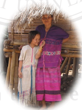
ภาพที่ 4 การแต่งกายของผู้หญิงชนเผ่าปกากะญอ

ชนเผ่าปกากะญอจะมีเอกลักษณ์ในการแต่งกาย ที่ยังคงยึดถือวัฒนธรรมและประเพณีนี้ อย่างเคร่งครัด โดยการแต่งกายของผู้หญิงสาวจะสวมชุดยาวสีขาว และผู้หญิงที่แต่งงานแล้วก็จะ สวมใส่เสื้อคนละท่อน คือนุ่งผ้าซิ่นและเสื้อที่ทอขึ้นใช้เอง สาเหตุที่ผู้หญิงที่แต่งงานแล้วต้องนุ่งคน ละท่อนเพราะเป็นการให้เกียรติแก่ผู้หญิงที่ยังไม่ได้แต่งงาน