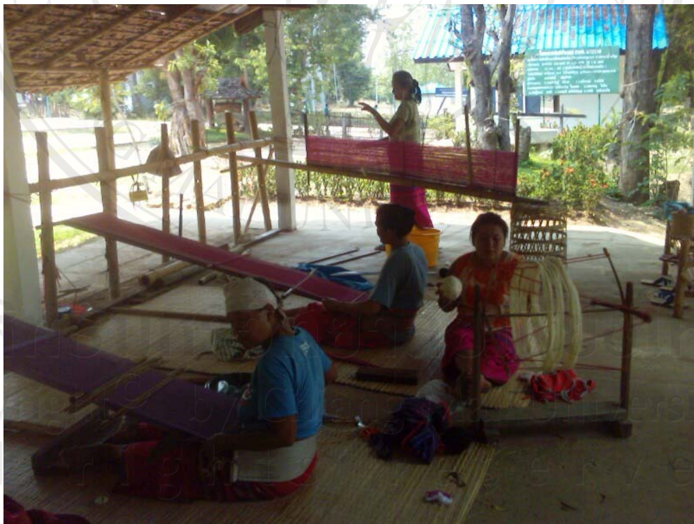
ภาพที่ 8-9 สมาชิกวิสาหกิจชุมชนพระบาทห้วยต้มร่วมกันทำกิจกรรมที่ศูนย์เรียนรู้ในการทอผ้า การปั่นด้าย การขึ้นรูปตัวผ้า