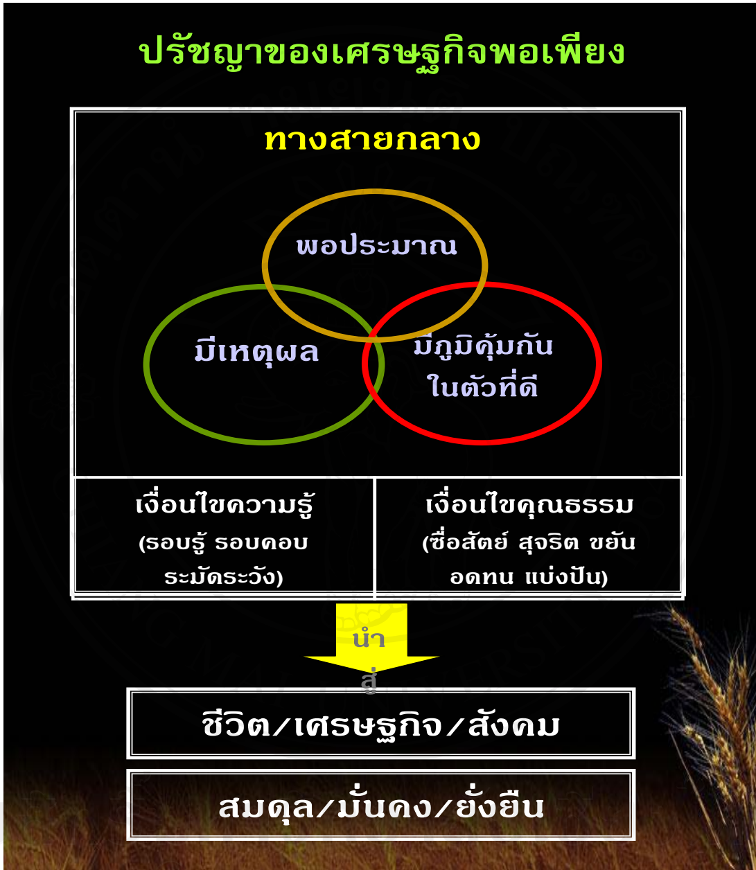
ภาพที่ 1 แนวคิดปรัชญาเศรษฐกิจพอเพียง