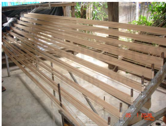
รูปที่ 7 การคั่นฝ้าย หรือ การจั่นฝ้าย

การคั่นฝ้าย หรือที่ชาวบ้านเรียกว่า “การจั่นฝ้าย” คือ การนำเส้นฝ้ายขึ้นมากำหนด ความกว้างและความยาวตามที่ต้องการทอและพอดีกับจำนวนฟันพืม ที่ต้องการ โดยเริ่มจากการนำ ฝ้ายที่เป็นก้อนๆนำมาใส่กงแล้วกรอใส่อีก แล้วเริ่มการจั่นเส้นฝ้ายด้วยการใช้มือจับเส้นฝ้ายทุก เส้นแล้วเดินเส้นฝ้ายหลักคั่น (ตะขอ) จนได้จำนวนและขนาดตามที่ต้องการ เมื่อเสร็จแล้วก็นำ เชือกมาผูกเครื่องฝ้ายหรือเครื่องทอไว้เพื่อความสะดวกในการนับจำนวนเส้นฝ้ายและนำเส้นฝ้ายออก จากหลักคั่น (ตะขอ) ดังรูปที่ 7