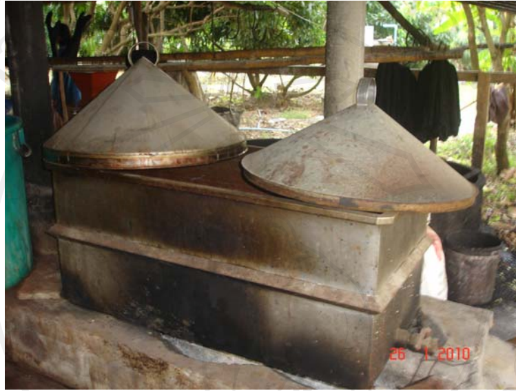
รูปที่ 4 หม้อต้มที่ใช้สำหรับการย้อมสีผ้าฝ้าย

การย้อมสีผ้าฝ้ายด้วยเปลือกไม้ นั้น มีลักษณะเด่นอยู่ที่สีที่ได้แต่ละครั้งจะไม่เหมือนกัน เพราะเปลือกไม้แต่ละต้น แต่ละส่วนนั้นให้สีต่างกัน ถึงแม้ว่าจะมีการชั่ง ตวง วัตถุดิบก็ตาม ดังนั้น เมื่อมีใบตั่งสินค้าจำนวนมาก จำเป็นจะต้องต้มเปลือกไม้ และย้อมในครั้งเดียวกันหลายๆ หากทำคนละครั้งกันจะได้สีที่เหมือนกัน (รูปที่ 4)