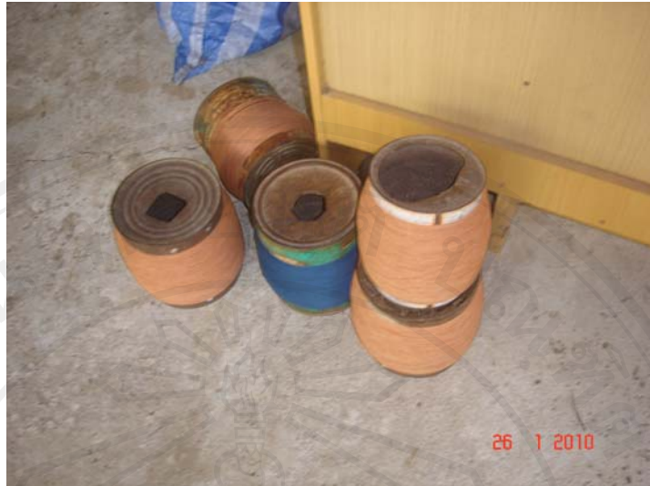
รูปที่ 5 เส้นฝ้ายที่ผ่านการกวัก โดยการกรอใส่กระป๋อง

การคั่นฝ้าย หรือที่ชาวบ้านเรียกว่า “การจั่นฝ้าย” คือ การนำเส้นฝ้ายขึ้นมากำหนด ความกว้างและความยาวตามที่ต้องการทอและพอดีกับจำนวนฟันพืม ที่ต้องการ โดยเริ่มจากการนำ ฝ้ายที่เป็นก้อนๆนำมาใส่กงแล้วกรอใส่อีก แล้วเริ่มการจั่นเส้นฝ้ายด้วยการใช้มือจับเส้นฝ้ายทุก เส้นแล้วเดินเส้นฝ้ายหลักคั่น (ตะขอ) จนได้จำนวนและขนาดตามที่ต้องการ เมื่อเสร็จแล้วก็นำ เชือกมาผูกเครื่องฝ้ายหรือเครื่องทอไว้เพื่อความสะดวกในการนับจำนวนเส้นฝ้ายและนำเส้นฝ้ายออก จากหลักคั่น (ตะขอ) ดังรูปที่ 7