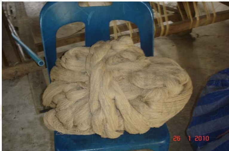
รูปที่ 2 เส้นฝ้ายยืนสำหรับขึ้นเครื่องทอ

วัตถุดิบหลักในการย้อม ได้แก่ เปลือกไม้คุณสมบัติของเปลือกไม้นั้นจะต้อง เป็นเปลือกไม้ที่ให้สี สังกะสีได้โดยที่ต้นไม้นั้นจะมียางเมื่อทดลองฉีกเปลือกของลำต้น แต่โดยส่วนใหญ่ แล้วเปลือกไม้ที่ใช้จะเป็นเปลือกไม้ในชุมชน เช่น เปลือกไม้มะม่วง เปลือกไม้ขนุน เปลือกไม้และเนื้อไม้ประคูน นอกจากนี้ยังมีการนำส่วนของผลมาใช้ในการย้อม เช่น มะเกลือ หรืออาจเป็นดินที่มีสี เช่น ดินแดง รวมทั้งครั้งได้ ซึ่งวัตถุดิบเหล่านี้จะให้สีแดง