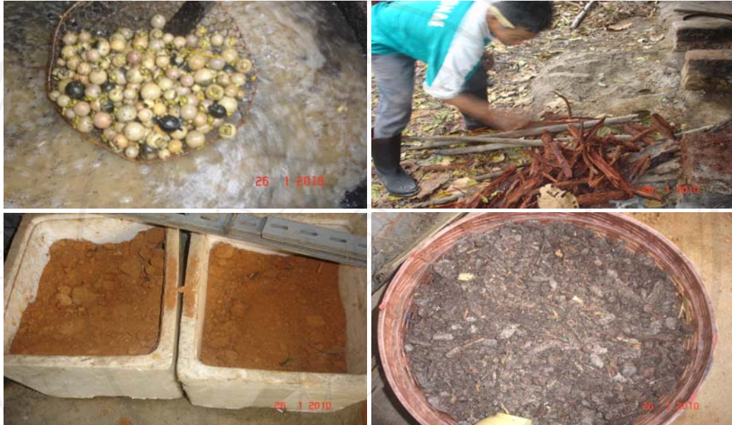
รูปที่ 3 วัตถุดิบธรรมชาติที่นำมาข้อมผ้าฝ้ายผลมะเกลือ (บนซ้าย) เปลือกประดู่ (บนขวา) ดินแดง(ล่างซ้าย) ฝรั่ง (ล่างขวา)

การข้อมสีธรรมชาติ โดยทั่วไปกลุ่มผู้ทอผ้าฝ้ายข้อมสีธรรมชาติจะทำการข้อมเส้นด้ายโดยการนำชิ้นส่วนของพืชที่ให้สีตรงตามต้องการไปสับให้ละเอียดแล้วแช่น้ำเอาไว้อย่างน้อย 1 คืน จากนั้นนำไปต้มในน้ำเดือดประมาณ 1 ชั่วโมง เพื่อสกัดเอาสีของเปลือกออกมาจาก นั้นนำน้ำสีไปอุ่นด้วยไฟอ่อนๆ ให้เดือดแล้วค่อยนำเส้นฝ้ายที่ผ่านการทำความสะอาด โดยการไล่ไขมันออกแล้วไปต้มในน้ำข้อมเวลาประมาณ 1 ชั่วโมง เพื่อให้ได้สีที่สม่ำเสมอในขั้นตอนนี้ผู้ผลิตจะต้องหมั่นยกเส้นฝ้ายขึ้นให้ถูกอากาศ และกลับเส้นฝ้ายให้ถูกน้ำข้อมเสมอกันทุกๆ 10-15 นาที จนสีซึมเข้าเส้นฝ้ายแล้วนำไปซักในน้ำเปล่าหลายๆ ครั้ง จนน้ำใส บีบน้ำออกให้แห้ง แล้วแขวนผึ่งไว้ในที่ร่มจนแห้งสนิท โดยเส้นฝ้ายที่เกิดจากการข้อมสีธรรมชาตินั้นทำให้เกิดสีธรรมชาติ และสวยงามอีกทั้งไม่เป็นอันตรายต่อสุขภาพของผู้ข้อมและผู้บริโภค น้ำสีที่เหลือจากการข้อมก็ไม่เป็นอันตรายต่อสิ่งแวดล้อม