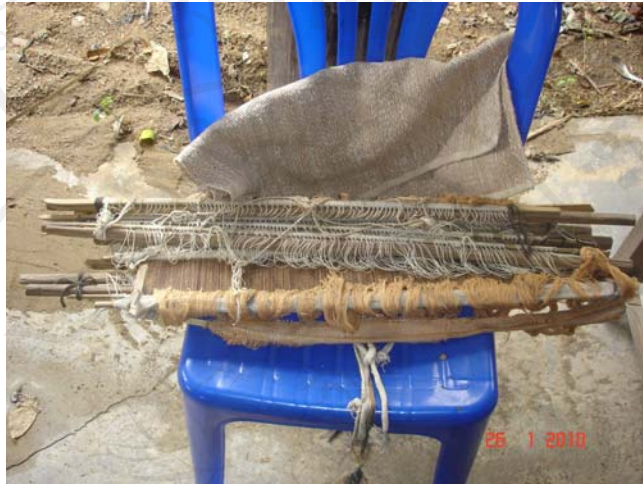
รูปที่ 6 ฟืมสำหรับการสืบหูก

การสืบหูก คือกรรมวิธีนำเอาเส้นฝ้ายขึ้นที่ย้อมสีแล้วไปต่อเข้ากับกอกหูก (ส่วนที่เหลือจากการทอครั้งสุดท้าย)ซึ่งการต่อเส้นด้ายที่หลีกกับเครื่องฝ้ายขึ้นนั้น ต้องผ่านฟืมและเขาหูก ซึ่งต้องใช้เวลานานและใช้ความละเอียดอ่อนมาก (รูปที่ 8)