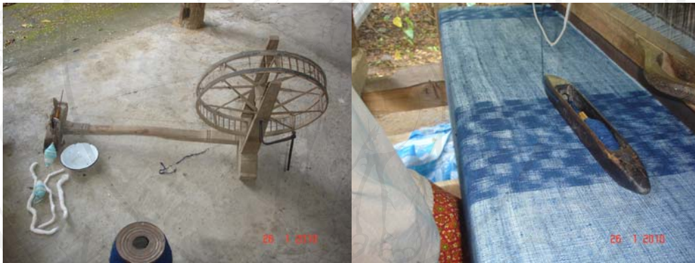
รูปที่ 8 การเตรียมเส้นฝ้ายพุ่ง การปั่นหลอด (ซ้าย) กระสวย (ขวา)