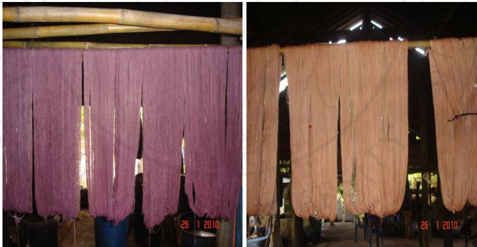
รูปที่ 9 เส้นด้ายที่ผ่านการย้อมสีเปลือกไม้ธรรมชาติ

นางบัวจัน มีคโห้ง ประธานกลุ่มทอผ้าบ้านตาลกลาง (วันที่ 26 มิถุนายน พ.ศ. 2554) ได้กล่าวเสริมว่า “กลุ่มได้ทำการผลิตผ้าเมตร และยังได้มีการแปรรูปผ้าที่ทอในกลุ่มเป็นกางเกง และเสื้อ” และนางแก้วตา คำมูลใจ สมาชิกกลุ่มทอผ้าบ้านตาลเหนือคนหนึ่ง (วันที่ 26 มิถุนายน พ.ศ. 2554) กล่าวเสริมว่า “กลุ่มได้มีการแปรรูปผ้าให้เป็นผลิตภัณฑ์ต่าง ๆ และผลิตภัณฑ์ที่เด่นของกลุ่มมีหลายอย่าง เช่น ผ้าเมตร กระเป๋ ผ้าพันคอ ผ้าซิ่น และเป็นที่นิยมและยอมรับเป็นอย่างมาก และยังทำให้คนรู้จักกลุ่มทอผ้าบ้านตาลมากขึ้น” นอกจากนี้ทางกลุ่มยังรับผลิตผ้าฝ้ายย้อมสีธรรมชาติตามคำสั่งซื้อของลูกค้า ผลิตภัณฑ์เด่นของกลุ่ม คือ ผ้าพันคอ และผลิตภัณฑ์ที่ผลิตโดยกลุ่มผลิตและแปรรูปผ้าฝ้ายย้อมสีธรรมชาติในตำบลบ้านตาลได้รับการยอมรับในตลาดเป็นอย่างมาก จะเห็นได้จากยอดขายผ้าพันคอ ที่มีความต้องการเป็นจากลูกค้าเป็นจำนวนมาก และจะมีคำสั่งซื้อเป็นจำนวนมากในช่วงฤดูหนาว