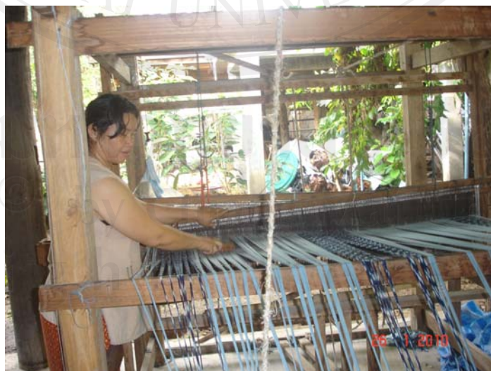
รูปที่ 7 การกางและการหวีหูก

การกางหูก คือการจัดนำเครื่องหูกที่ผ่านการสืบหูกแล้วมาผูกติดกับที่ทอผ้าโดยใช้เชือกครั้งกรั้งเรือหูกให้อยู่ในโครงที่ตามแนวระนาบ แขนงฟืมและตะกอให้อยู่ในแนวตั้งฉากกับเครื่องหูกเพื่อเตรียมพร้อมในการทอผ้าเป็นขั้นต่อไป (รูปที่ 8)