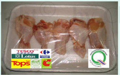
การ์ดที่ 19