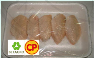
การ์ดที่ 17