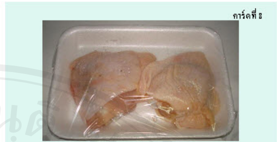
การ์ดที่ 8