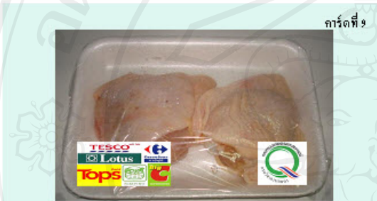
การ์ดที่ 9