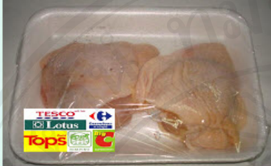
การ์ดที่ 1

การ์ดหรือชุดคุณลักษณะของเนื้อไก่สด(ส่วนสะโพก) ที่ให้นำเสนอในการสัมภาษณ์ผู้บริโภ�