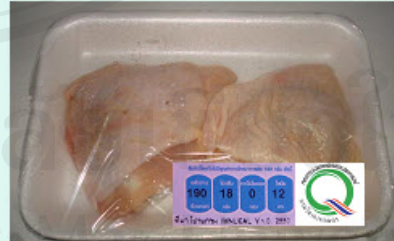
การ์ดที่ 6