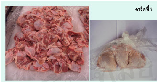
การ์ดที่ 7