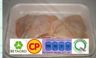
การ์ดที่ 2