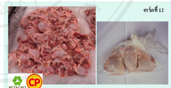
การ์ดที่ 12