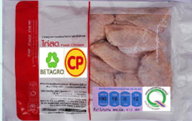
การ์ดที่ 16