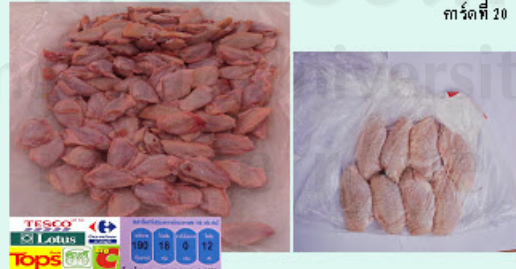
การ์ดที่ 20