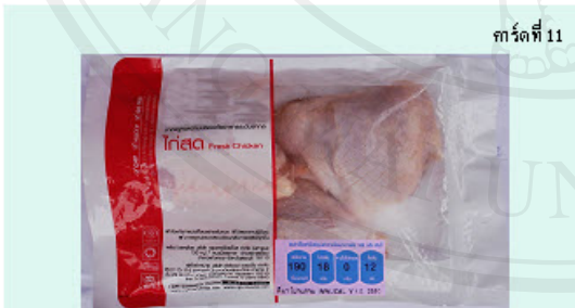
การ์ดที่ 11