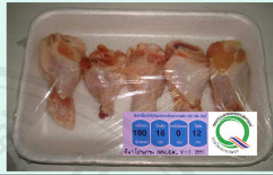
การ์ดที่ 14