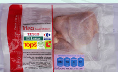
การ์ดที่ 5