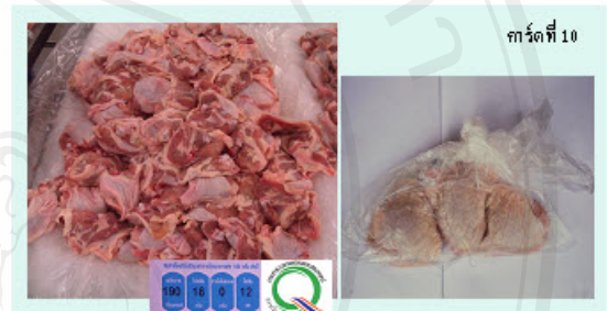
การ์ดที่ 10