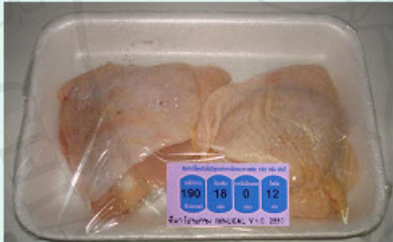
การ์ดที่ 3