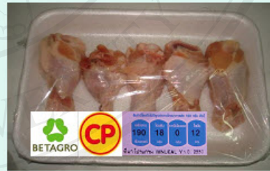
การ์ดที่ 18