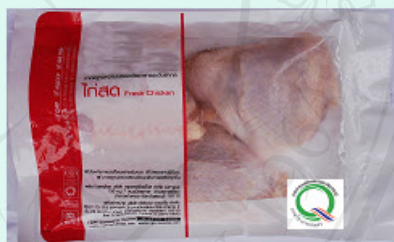
การ์ดที่ 4