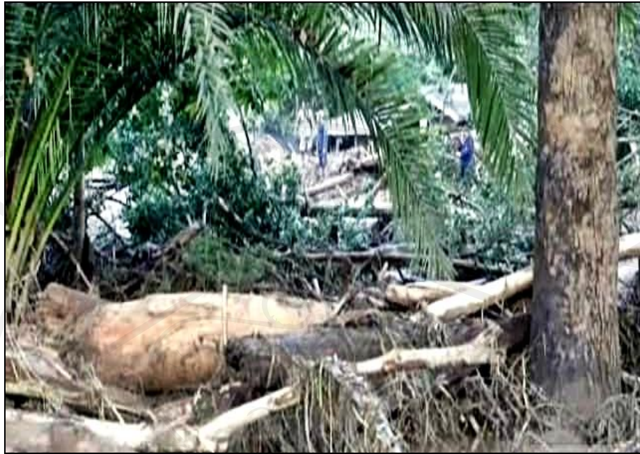
ภาพ 5 ความเสียหายหลังอุทกภัยน้ำป่าไหลหลาก และดินโคลนถล่ม