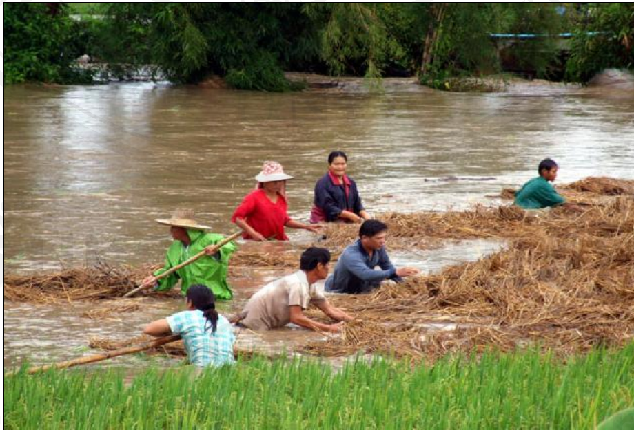
ภาพ 2 น้ำท่วมนาข้าวในพื้นที่ หมู่ที่ 2 บ้านดอน