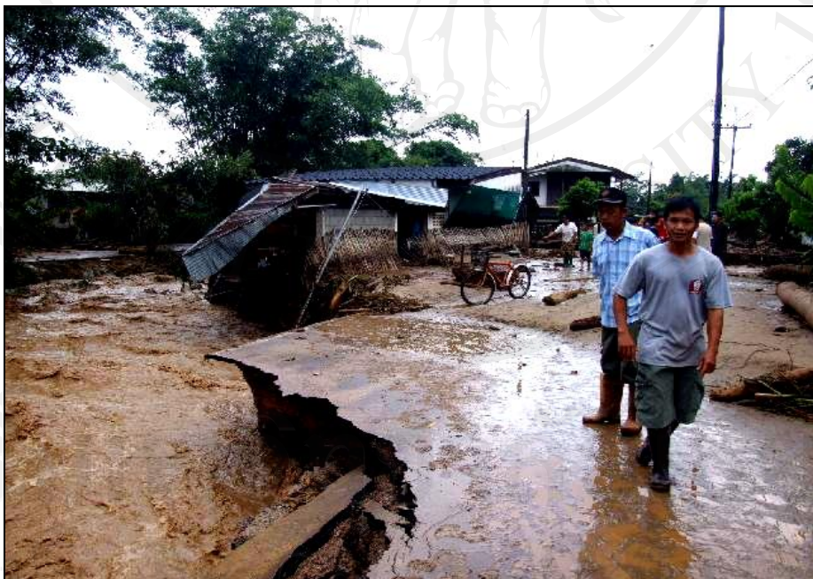
ภาพ 4 น้ำท่วมในพื้นที่ หมู่ที่ 6 บ้านเปียงกอก