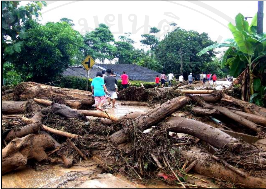
ภาพ 3 น้ำท่วมในพื้นที่ หมู่ที่ 5 บ้านต้นผึ้ง