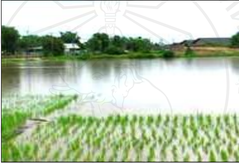
ภาพ 1 น้ำท่วมนาข้าวในพื้นที่ หมู่ที่ 1 บ้านหนองพ่วง

ภาพความเสียหายหลังอุทกภัยน้ำป่าไหลหลาก และดินโคลนถล่ม ในพื้นที่ตำบลโป่งน้ำร้อน อำเภอดงหลวง จังหวัดเชียงใหม่