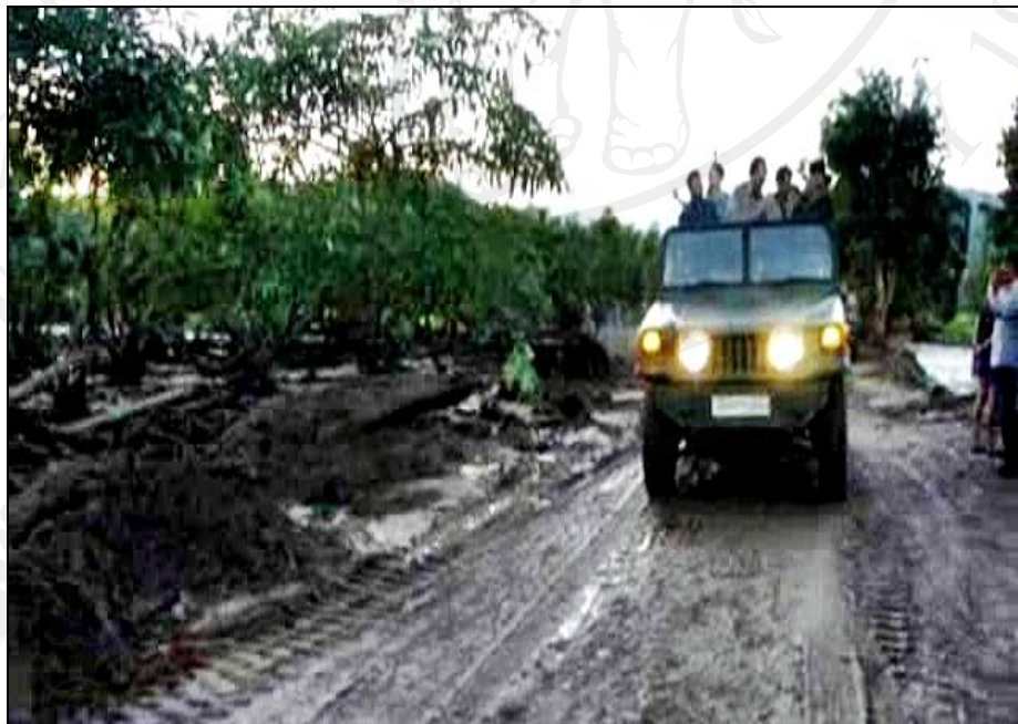
ภาพ 6 ความเสียหายหลังอุทกภัยน้ำป่าไหลหลาก และดินโคลนถล่ม