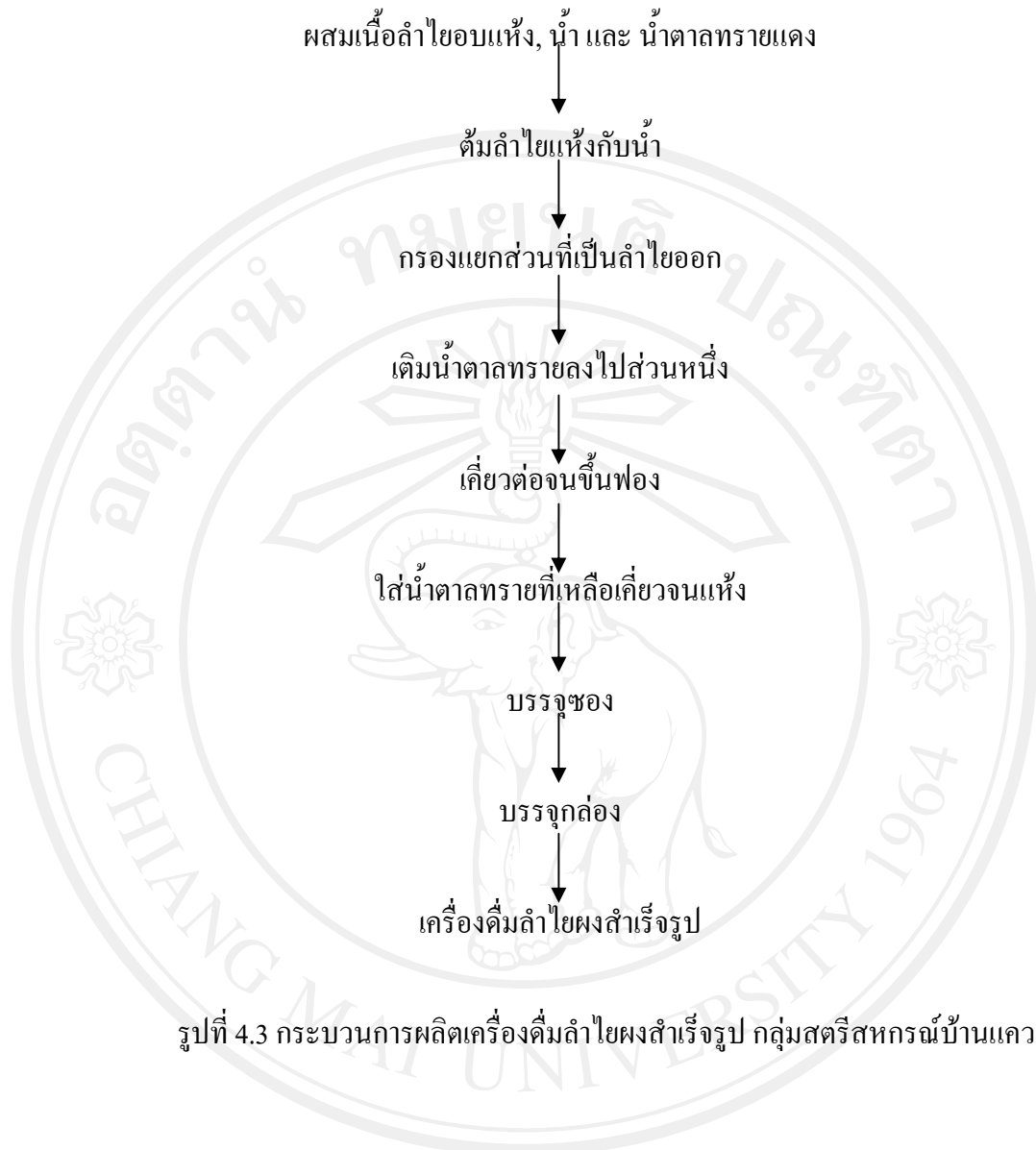
รูปที่ 4.3 กระบวนการผลิตเครื่องตีลำไยผงสำเร็จรูป กลุ่มสตรีสหกรณ์บ้านแคว