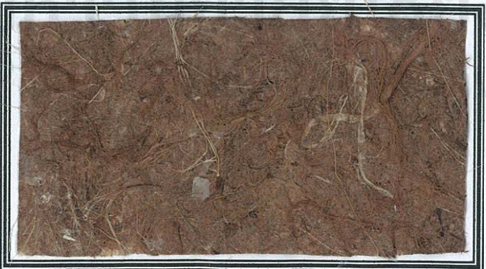
กระดาษตะขบป่าผสมใยกล้วย