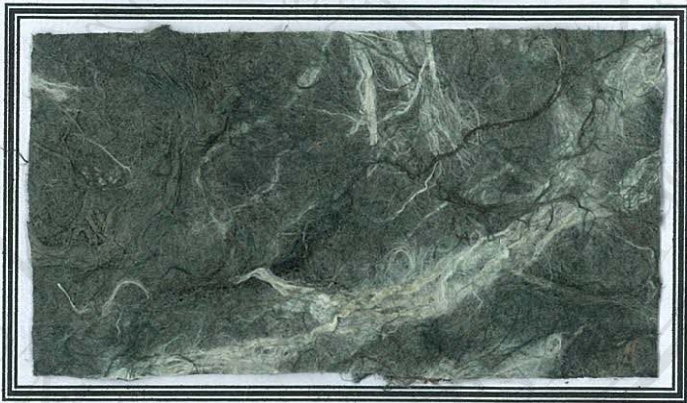
กระดาษตะขบป่าผสมสา