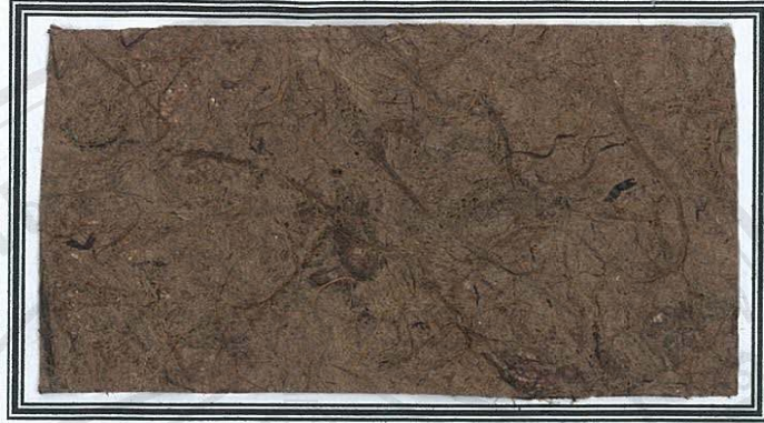
กระดาษตะขบป่าล้วน